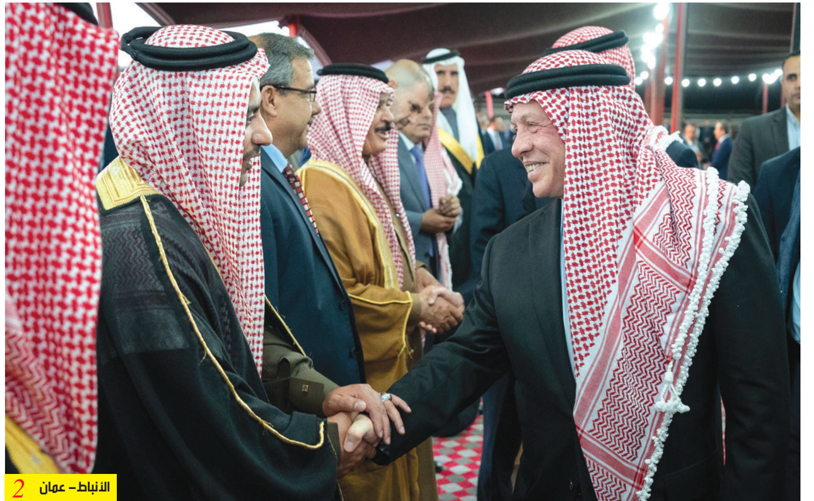
الأنباط - عمان 2