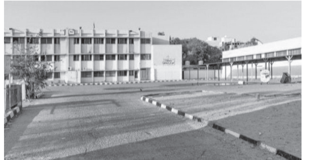
الأنباط - شدى حناملة

الهجرة تعيد الوضع إلى أسوأ مما كان عليه هذا من جانب، ومن جانب آخر ليس هناك من تمويل كاف للعمل الفني التعليمي، وخاصة فيما يتصل بتعيينات من هم على حساب التعليم الإضافي، وتدريب المعلمين وتحديث تقنيات التعليم وحوسبته، التي تصب جميعها في تراجع التعليم إلى مستويات كارثية .