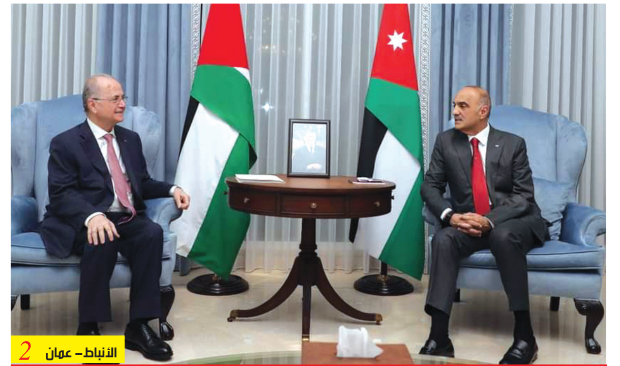
الأنباط- عمان 2

اكدا ضرورة الانتقال لأفق سياسي للإقامة دولة فلسطينية مستقلة