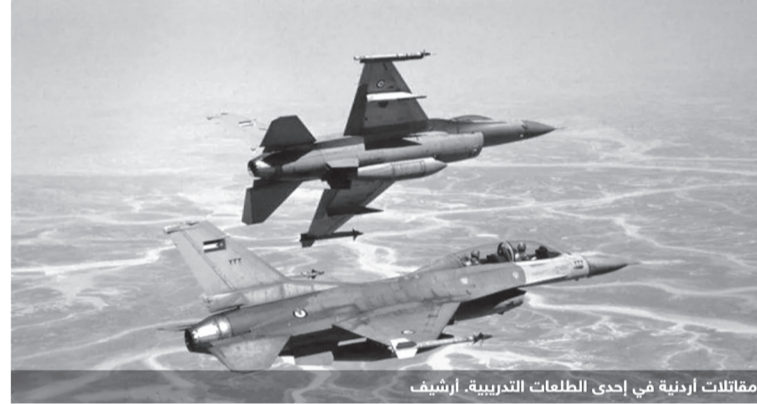
مقاتلات أردنية في إحدى الطلمات التدريبية.

وعلى الجميع ان يعلم ويتأكد بان قواتنا الجائلة القوات المسلحة توظف وستوظف جميع إمكاناتها وقدراتها في سبيل حماية الوطن، وتعمل على التصدي بكل قدرتها لما يهدد أمنه، وليس لديها أي اعتبار سوى الحفاظ على سلامة المواطنين.