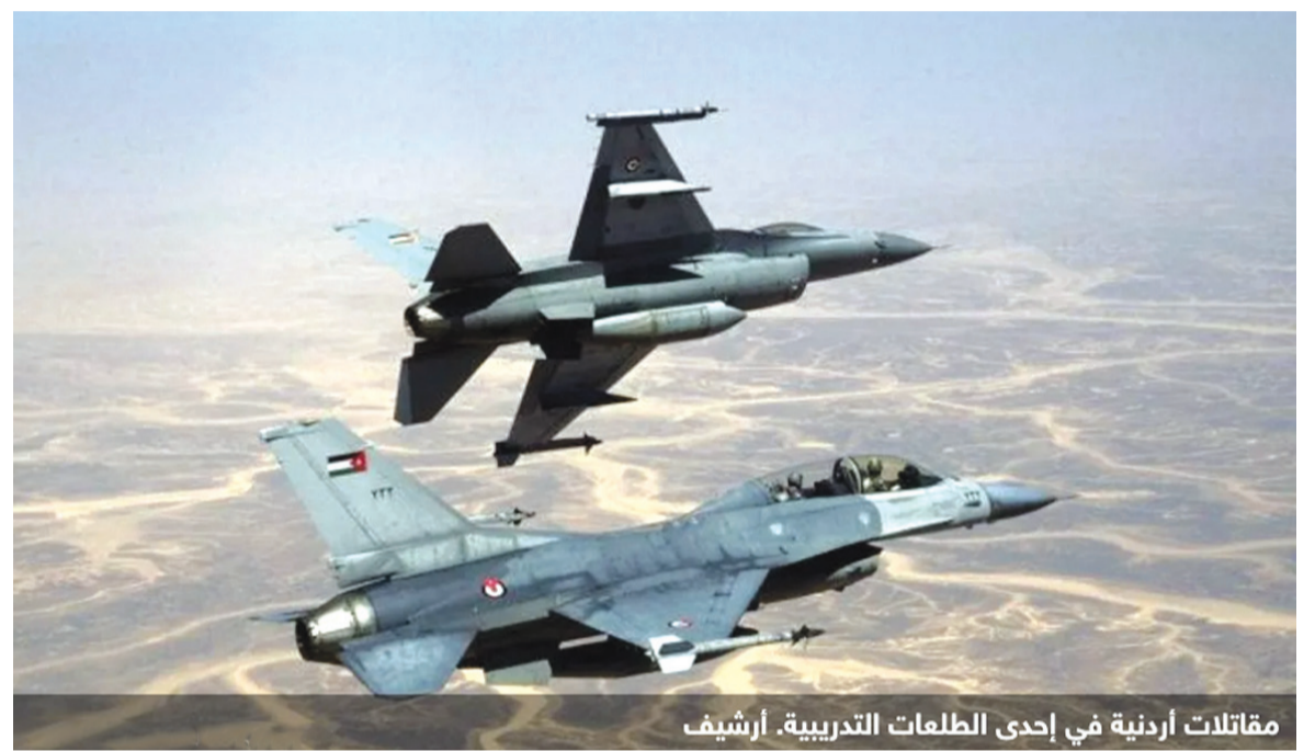
مقاتلات أردنية في إحدى طلعات التدريبية.