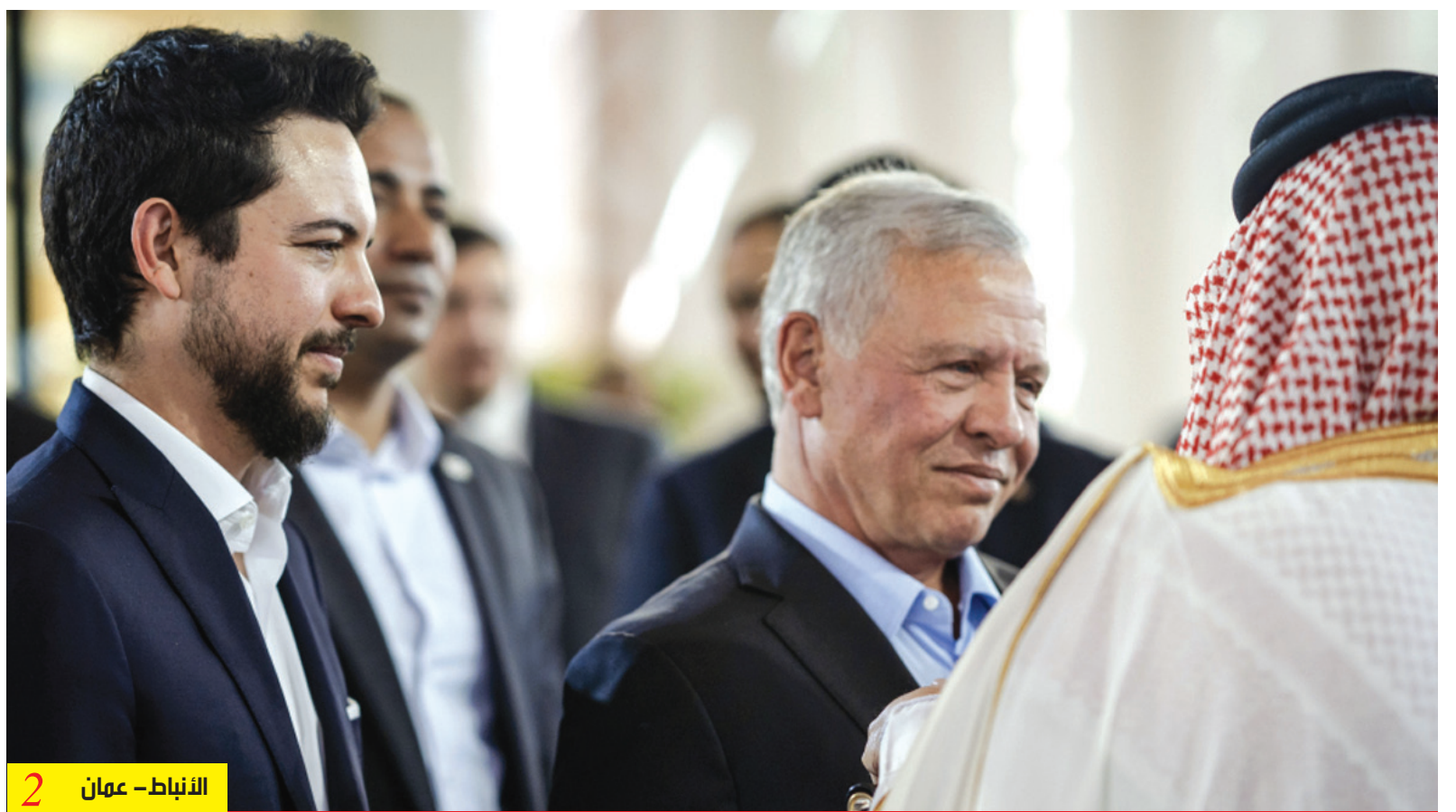
الأنباط - عمان 2

الأردن لن يكون ساحة معركة لأي جهة وحمية مواطنينا قبل كل شيء