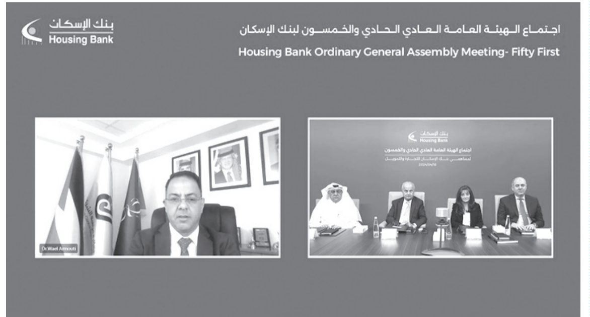
اجتماع الهيئة العامة العادي والحادي والخمسون لبنك الإسكان Housing Bank Ordinary General Assembly Meeting- Fifty First

١٤٠,٨ مليون دينار صافي الأرباح لعام ٢٠٢٣ وإنجازات متميزة في البنود الرئيسية لقائمة المركز المالي الموافقة على توزيع (٢٥٪) من القيمة الإسمية للسهم كأرباح نقدية لمساهمي البنك عن عام ٢٠٢٣