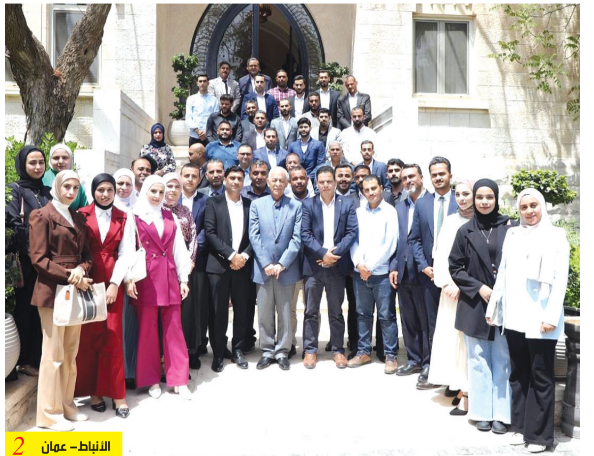
الأنباط - عمان 2