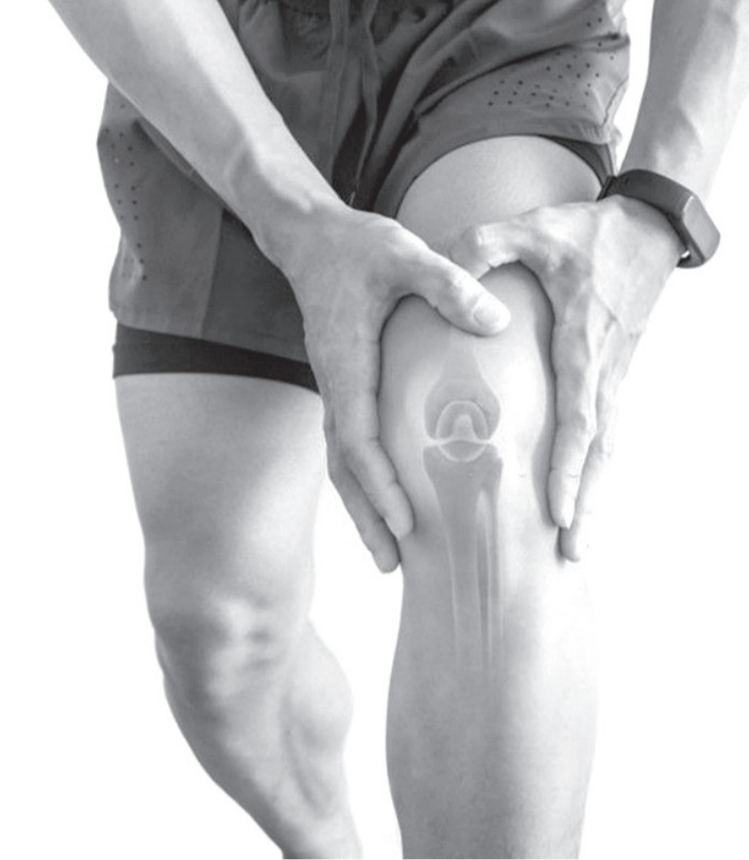
هو (خشونة المفصل) وتتراوح بين (بسيطة،متوسطة،شديدة) لتبدأ أعراض المرض بالظهور بعد ٤٠ سنة ، وذكر أن ١٢٪ من الأشخاص الذين تزيد أعمارهم

عن ٦٠ سنة مصابين بخشونة مفصل الركبة (على مستوى العالم)، وهي واحدة من اهم الاسباب التي تجعل المريض غير قادر على المشي عند كبار السن ، اذ تجري في الولايات المتحدة سنويا ٨٠٠ الف عملية تبديل مفصل الركبة. وبين، ان الادوية والطرق الطبية غير الجراحية تخفف من الألم خشونة الركبة وتساعد على زوال الاسباب تكون بتخفيف الوزن واعطاء مضادات التهاب غير استرويدية ،واعطاء كرياتمات الموضعية مسكنة للألم وممارسة التمارين الرياضية والمائية ، كما أن طرق تنقيف المريض عن طبيعة مرضه هامة جدا ،واعطاء ابر داخل المفصل بأنواعها ( الكورتزون ،البلازما ،الهايلورونيك اسيد ) ، وتختلف شدة الاستجابة من شخص لأخر حسب شدة الألم و درجة الخشونة اهمها ولكن لو فشلت يستدعي ذلك اجراء عملية تبديل مفصل. ونوه الى ان النساء اكثر عرضة للاصابة من الرجال نتيجة اضطراب هرمون الأستروجين ،ويلعب العامل الوراثي دور هام بالاصابة بامراض الركبة إذا ان بعض امراض الركبة وراثية ولا يمكن تجنبها اذا يتم علاجها عند اطباء الروماتيزم مثل (التهاب المفاصل الروماتويدي ،الحمى الذئبية، القرص).