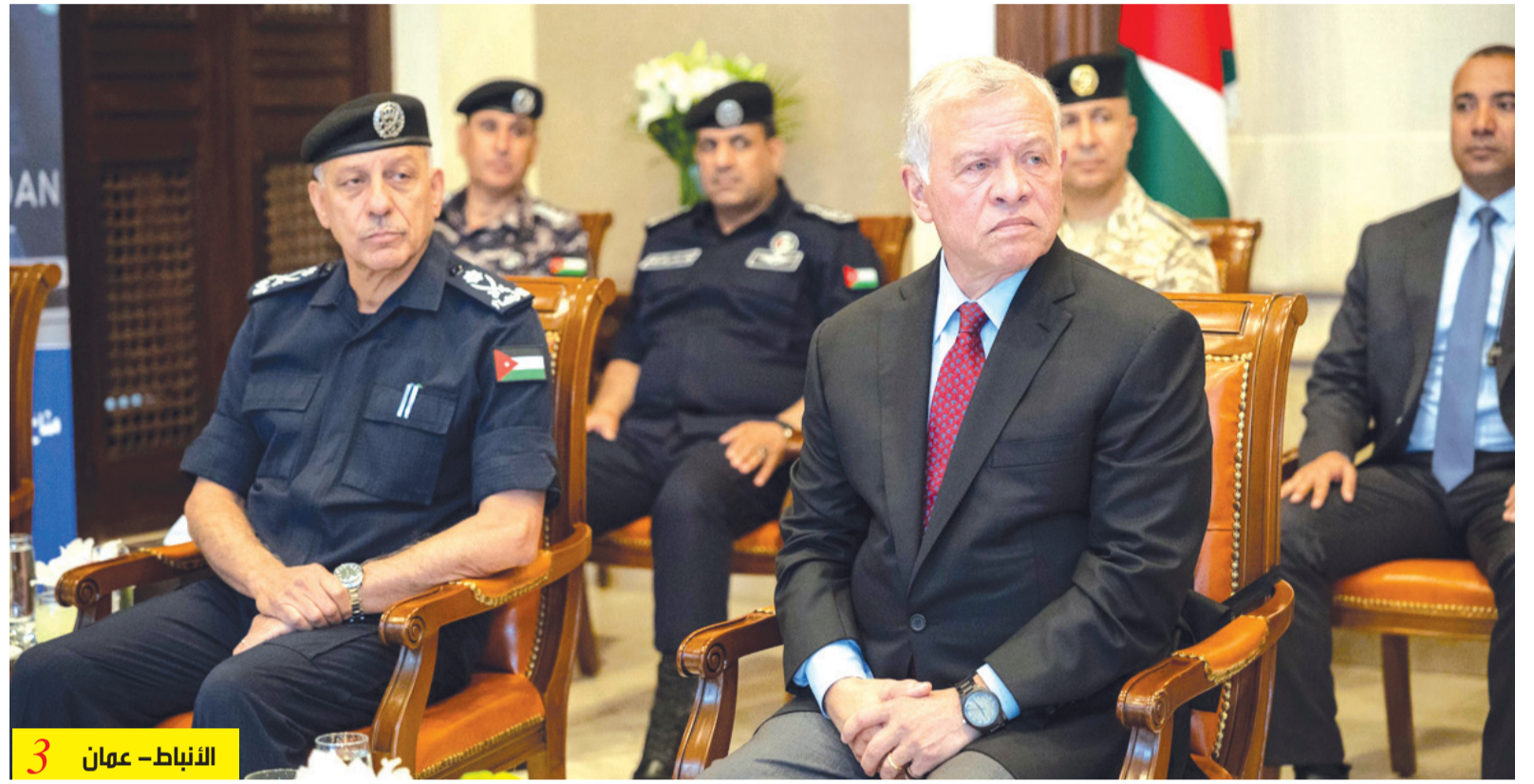
الأنباط - عمان 3

أكد الخبير الدكتور محمود الدباس، أن الحشوات الانتخابية لا يمكن أن تنتهي نظراً لـ ان نظام الحشوات مرتبط بحاجة الكتلة الانتخابية، موضحاً أنه في حال اجتمع أكثر من شخص بالقائمة من الازان الثقيلة، فانهم سيلجأون الى اضافة مرشحين من الازان الخفيفة ممن يسوا بالحشوات في حالات استثنائية لـ الاستفادة من مئات الاصوات الموجودة لـ اكتمال العتبة الانتخابية. وأضاف لـ «الأنباط»، أن هناك نموذجاً من الكتل الانتخابية يكون الاشخاص فيها من الازان المتفاوتة، من الممكن ان تستخدم الحشوات لترجيح الفوز لمرشحين يمثلون الازان المتوسطة المتقاربة، ونموذج يمثل