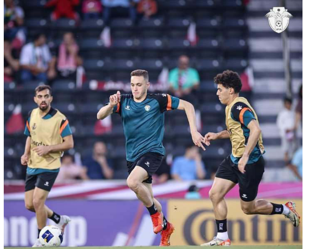
الدوحة - أحمد الخلايلة - موفد اتحاد الإعلام الرياضي

كانت أبرزها الإدارة الضعيفة للوقت حيث كان هنالك مبالغة باحتساب ١٠ دقائق وقت بدل ضائع عن أحداث الشوط الثاني. كما تم الحديث عن خطأ واضح لصالح منتخبنا في الشوط الأول وسبق تسجيل الهدف الأول لقطر كما ان احتساب الفاول الذي جاء منه الهدف الثاني لم يكن صحيحاً وان حكم الساحة احتسبه بالرغم من عدم رفع راية المساعد القريب للحالة. فيما كان التوجه لاعتماد صحة هدف منتخب قطر الثاني وعدم وجود أي خطأ قبل تسجيل الهدف بعد سقوط عون المحارمة، الذي كان قبل تنفيذ الركلة، وان