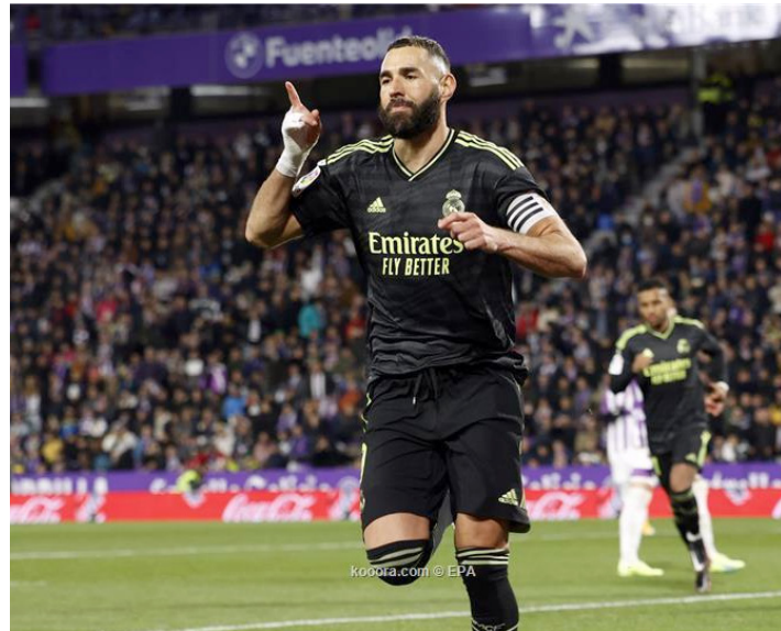
جدة - وكالات

لإنقاذ موسمه الأول في السعودية. ورغم ذلك، لم ينس بنزيمها، الاحتفال بتأهل ريال مدريد المثير على حساب مانشستر سيتي إلى نصف نهائي دوري أبطال أوروبا. وانتزع الملكي، تأهلاً صعباً بركلات الترجيح من ملعب "الاتحاد"، بعد تعادل الفريقين بنتيجة ٤-٤ في مجموع مباريات الذهاب والإياب. ونشر بنزيمها، مقطع فيديو عبر حسابه على سناب شات، وهو يحتسي القهوة العربية، فيما أرفق مقطعاً صوتياً يقول "هذا هو مدريد.. ويعد بنزيمها من أساطير ريال مدريد، إذ مثل العملاق الإسباني لمدة ١٤ عاماً في الفترة من ٢٠٠٩ حتى ٢٠٢٣، قبل أن ينتقل لاتحاد جدة.