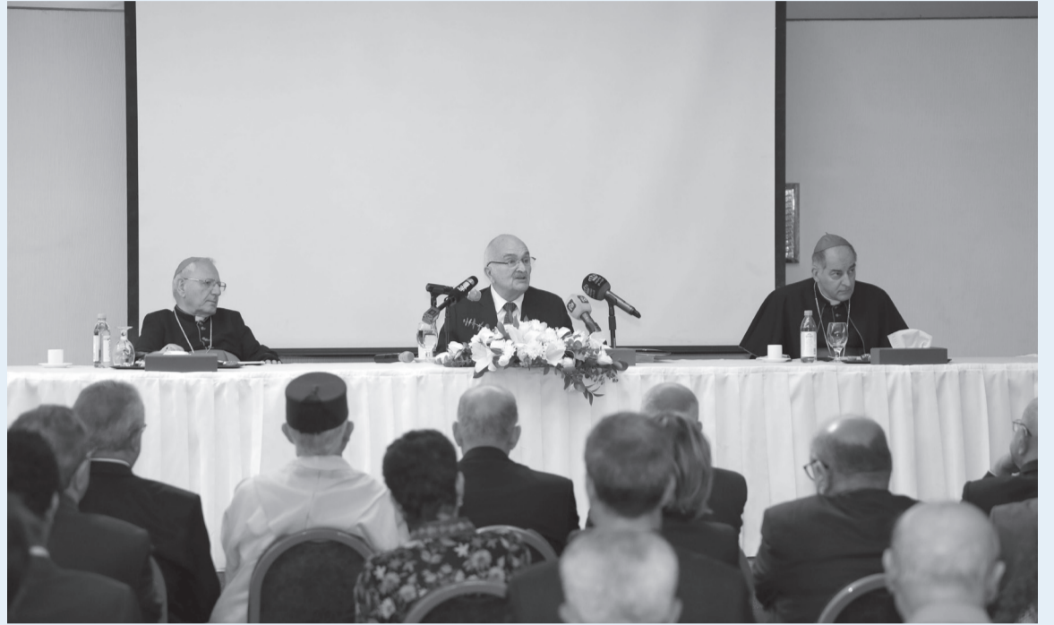
الأبواب - عمان

وأوضح سمو أهمية النظر الى المشرق بعين الإنسانية والحديث عن الثقافات المشرقية كحاضنة للحضارات تختزن في مضامينها روح الإشراق ووحدة الضمير الإنساني والقيم البشرية الجامعة. وأشار سموه الى ضرورة أن تصبح الكرامة الإنسانية مرشدا للسياسات والانتقال للحديث عن النخوية والاستقلال المتكافئ، واحترام هوية الآخر لتحقيق المساواة كدرجة مساوية للكرامة. وأشار سموه الى أن الماسي التي نراها يجب أن لا تضعف أو توهن من عقيدتنا وإيماننا،