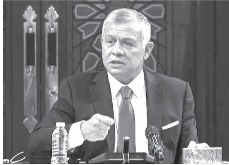
الأنباط - واشنطن

وجدد جلالة الملك، خلال الاتصال، إدانة المملكة للاعتداء على قافلة مساعدات أردنية كانت متجهة إلى غزة عبر معبر بيت حانون من قبل مستوطنين إسرائيليين متطرفين. بدوره، عبر ترودو عن قلقه من هجمات المتطرفين على قوافل المساعدات المتجهة للمدنيين الفلسطينيين في قطاع غزة. كما تم التأكيد، في الاتصال، على أهمية العمل على إيجاد أفق سياسي لإنهاء الصراع الفلسطيني الإسرائيلي على أساس حل الدولتين.