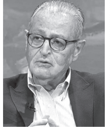
الأنباط - مينااس بني ياسين

ما زال الأردن يحرص وجوده البارز على طاولة فهم المناخ والمشاركة في الاتفاقيات الرامية إلى الحد من آثار التغير المناخي، علاوة على إستعراضه أبرز المشاكل الإقليمية والمحلية التي يعاني منها، من أبرزها: أزمتا لجوء وضغط على موارد الدولة البيئية والزراعية والمائية.