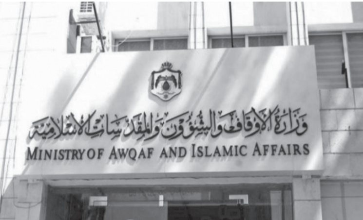
وزارة الأوقاف والشؤون والمؤسسات الإسلامية

١٠ آلاف ريال سعودي (١٨٩٠ ديناراً) مع مضاعفة الغرامة في حال التكرار، وترحيل المخالفين المقيمين، والمنع من دخول المملكة، إضافة إلى عقوبة كل من يتم ضبطه وهو ينقل المخالفين بالسجن مدة تصل إلى ٦ أشهر وبغرامة مالية تصل إلى ٥٠ ألف ريال، (٩٤٠٠ ديناراً)، ومصادرة وسيلة النقل البرية. وشدد البيان على أن فريضة الحج يجب أداؤها عبر تأشيرات حج معتمدة فقط، داعياً المواطنين إلى الحذر وعدم التعامل مع شركات وحملات وحسابات وهمية على وسائل التواصل الاجتماعي تزعم تنظيم رحلات الحج بأسعار مغرية.