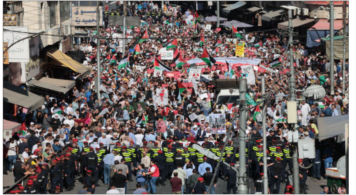
الأنباط - محافظات

نظمت مختلف الجمعيات الشعبية والحزبية والشبابية في العاصمة عمان وفي مختلف محافظات المملكة، بعد صلاة الجمعة أمس، مسيرات دعماً لغزة وتنديداً بالصمت الدولي إزاء الجرائم التي ترتكبها قوات الاحتلال الإسرائيلي في قطاع غزة