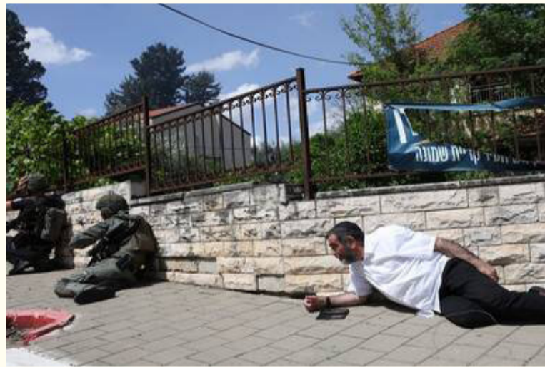
لا تغفل ما يكفي لحمايتنا، ونحن نفكر وتابع داهيدوفيتش: “نحن لا نريد أن نكون جزءاً من دولة لا تهتم بأمن