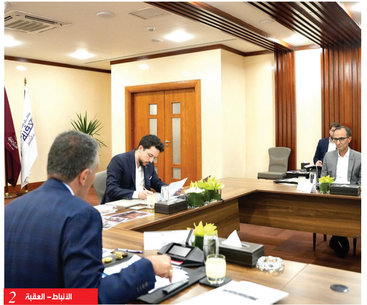
الأنباط - العقبة 2