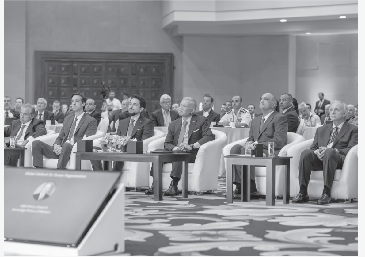
الأبناط - البحر الميت

حضر جلالة الملك عبدالله الثاني وسمو الأمير الحسين بن عبدالله الثاني ولي العهد، أمس الأربعاء، الجلسة الرئيسية للقمّة الإقليمية للمحيطات، التي عقدت في مركز الملك الحسين بن طلال للمؤتمرات بمنطقة البحر الميت. ويستضيف الأردن النسخة الإقليمية للقمّة، التي تعقد للمرة الأولى في منطقة الشرق الأوسط بتنظيم من مجموعة الإيكونوميست العالمية، ضمن مبادرة إيكونوميست إمباكت وبالتعاون مع مبادرة المجمع الدولي لمحمية العقبة البحرية، وبدعم من الحكومة وهيئة تشييط السياحة. وتجمع القمّة أكثر من ٢٠٠ مشارك من أنحاء العالم، من سياسيين ومسؤولين وروّساء شركات ومستثمرين وخبراء وأكاديميين، لتبادل الخبرات حول سبل تحقيق التوازن بين جهود حماية المحيطات وتعزيز النمو الاقتصادي المستدام. وقال رئيس الوزراء الدكتور بشر الخصاونة، في كلمة له خلال الجلسة،