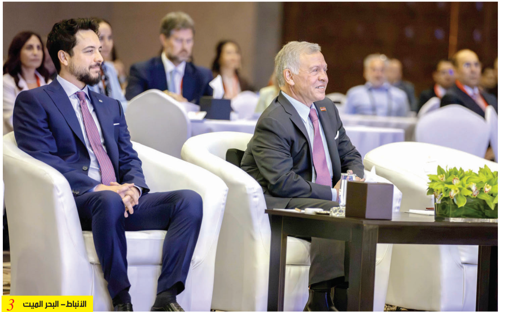
3 الأنباط - البحر الميت