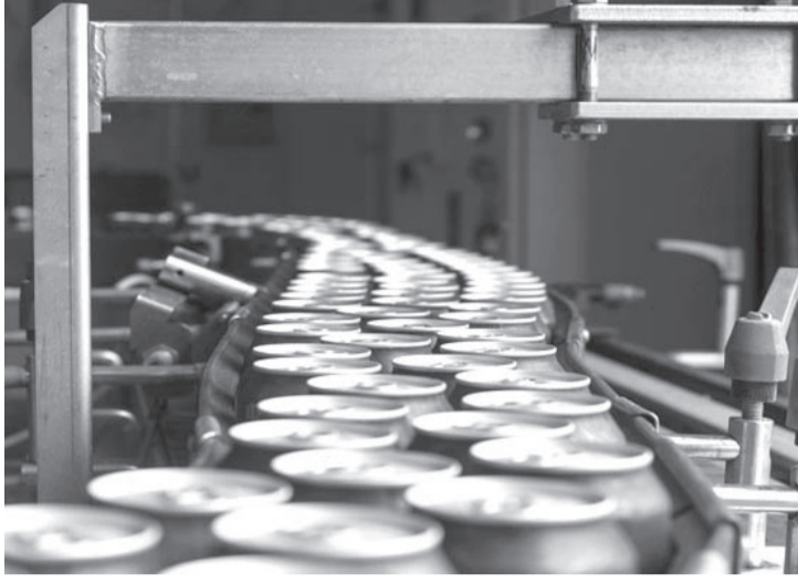
الأنباط - بترا

الغذائية وصل لحد الاكتفاء الذاتي ولا سيما من الألبان ومنتجاتها وبيض المائدة واللحوم ومنتجاتها والحلويات، بالإضافة إلى اكتفاء شبه ذاتي من بعض الصناعات على غرار الطحينية والحلاوة والمعلبات وغيرها.