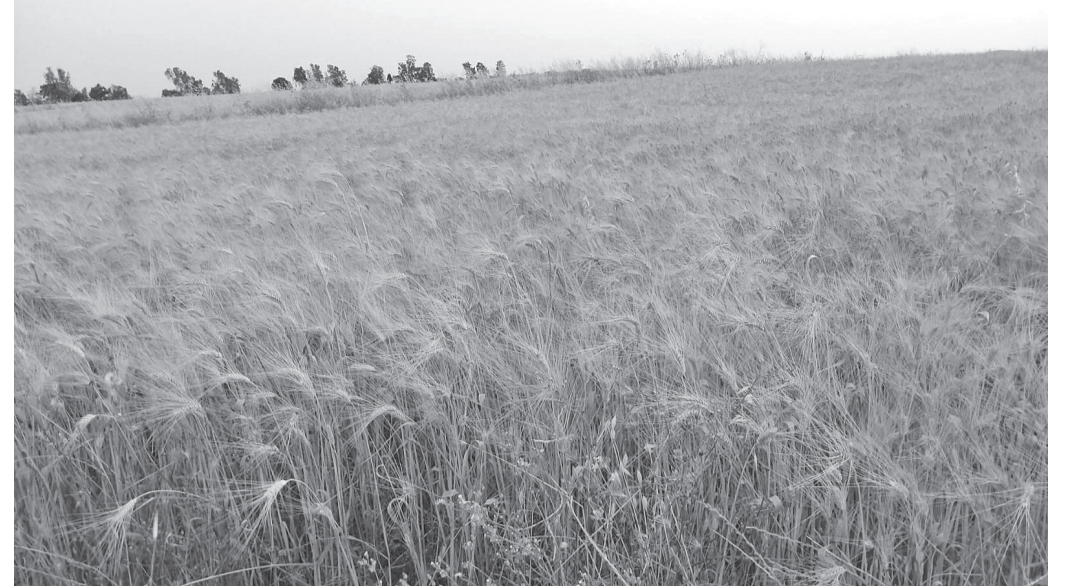
الأنباط - فرح موسى:

ابو عرابي: إنتاج القمح وصل الى ١٢ ألف طن ونصف