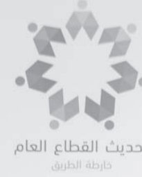
تحديث القطاع العام خارطة الطريق

وأوضح أن جميع وحدات الموارد البشرية والتطوير المؤسسي في الوزارات والدوائر الحكومية ستلتقي جلسات تعريفية بالنظام كون تنفيذه يقع على عاتقها، بينما ستتولى هيئة الخدمة والإدارة العامة دور الرقابة وتطوير السياسات والتشريعات الناظمة للموارد البشرية في القطاع العام.