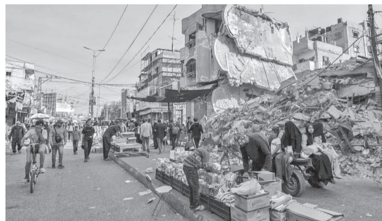
والتزام من كل ذلك الدمار وحرب الإبادة الجماعية، نشأ في قطاع غزة اقتصاد الحرب، وتحولت شوارع القطاع المدمرة إلى سوق للبقاء

يركز على الأساسيات، الغذاء والمأوى والمال. وتحولت شوارع القطاع المدمرة إلى سوق للبقاء وتحولت إلى ملاجئ، يصطف الباعة في زمن الحرب في الشوارع في قطاع غزة، يبيعون الملابس المستعملة وحبلى الأطفال والأطعمة المعلنة والكعك محلي الصنع. في بعض الحالات، تم تكديس طرود المساعدات بأكملها، التي من المفترض أن تكون توزيعها مجاناً، على الأرصفة وبيعها بأسعار لا يستطیع سوى القليل من الناس تحملها.