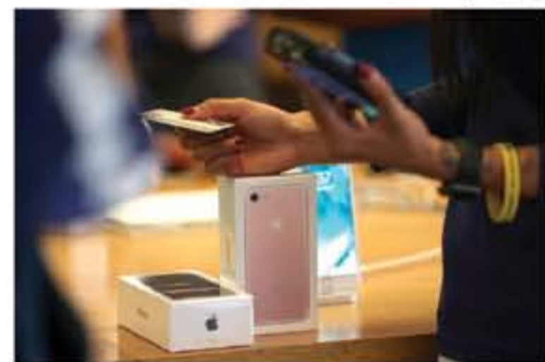
أوقفت شركة أبل بيع نموذج 1١٢ هجلايات من هاتف آيفون 7 بتاريخ ٧ يونيو (سبتمبر الحالي، أي في نفس يوم إصدار آيفون 7) حيث إنها أوقفت بيعها هاتف آيفون 7 نسخة ١٢٨ هجلايات من هاتف آيفون 7 من خلال متجرها.

أوقفت شركة أبل بيع نموذج 11٢ هجلايات من هاتف آيفون 7 بتاريخ ٧ يونيو (سبتمبر الحالي، أي في نفس يوم إصدار آيفون 7) حيث إنها أوقفت بيعها هاتف آيفون 7 نسخة 128 هجلايات من هاتف آيفون 7 من خلال متجرها.