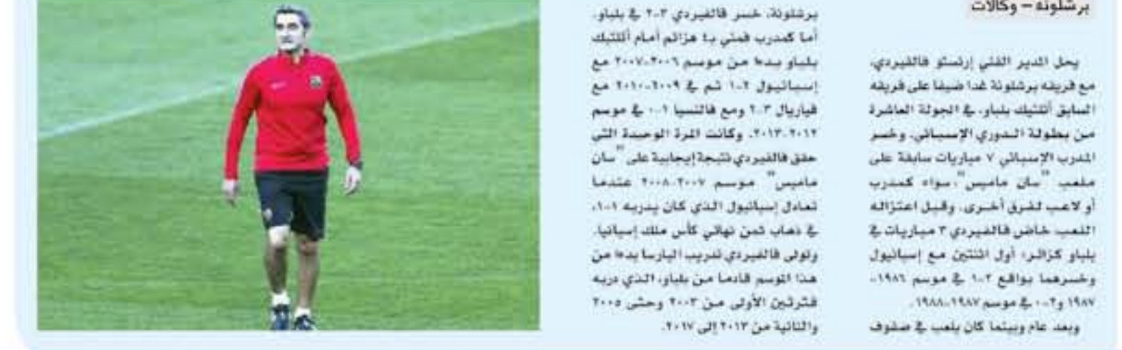
برشلونة - وكالات

برشلونة، خسر فالفيدي ٦-٣ في يناير، أما كعرب فحتى دا عزائم أمام ألتيك بخلاف موسم ٢٠١٦-٢٠١٥ مع إسبانيول ١-٠ ثم في ٢٠١٥-٢٠١٤ مع فالفيدي ١-٠ ومع فالفيدي ١-٠ في موسم ٢٠١٣-٢٠١٢. وكانت المرة الوحيدة التي حقق فيها فوزا (٣) في سان ماهيس "سان ماهيس" موسم ٢٠١٠-٢٠٠٩ عندما تمكن إسبانيول الذي كان يترديه ١-٠، في ذهاب حين تهاوى كان ملك إسبانيا. وكون فالفيدي ففريد البارسا بعد ١٥ من هذا الموسم قادما من بيلار، الذي مره ٢٠١٣ في الأول من ٢٠١٣ وحتى ٢٠١٥ والثانية من ٢٠١٣ إلى ٢٠١٧.