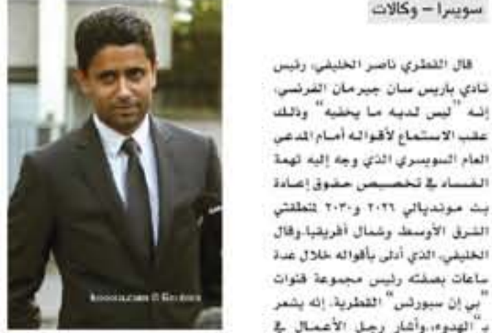
سويديا - وكالات

قال القطري ناصر الخليفي، رئيس نادي باريس سان جيرمان الفرنسي، إنه "ليس لديه ما يخفيه" عقب الاستماع لأقواله أمام المدعي العام السويدي الذي وجه إليه تهمة الفساد في تخصيص حقوق إعادة بث مبارياتي ٢٠١٦ و٢٠١٣. وتكشفت الشرق الأوسط وشمال أفريقيا وقال الخليفي، الذي أدى بأقواله خلال عدة ساعات بصفتك رئيس مجموعة فوات " بي إن سبورس" القطرية، إنه يشعر "بالهدوء" وأشار رجل الأعمال في تصريحات لوسائل الإعلام "حسرت على سويسرا من أجل الإلقاء بأقوالتي ليس لدي ما أخفيه، وولدت أمر التبايع العامة إذ دعيت محمدا، جئت عائدا وسأعود كذلك، بذكر أن هذا هو القطر الإقليمي الأول لتخليفي منذ إعلان المدعي العام السويدي فتح تحقيق ضده ضد سكرتير عام الاتحاد الدولي لكرة القدم (الفيفا) جيرمو فاتك، ورجل أعمال ثالث يعمل فريده الحصول عليها.