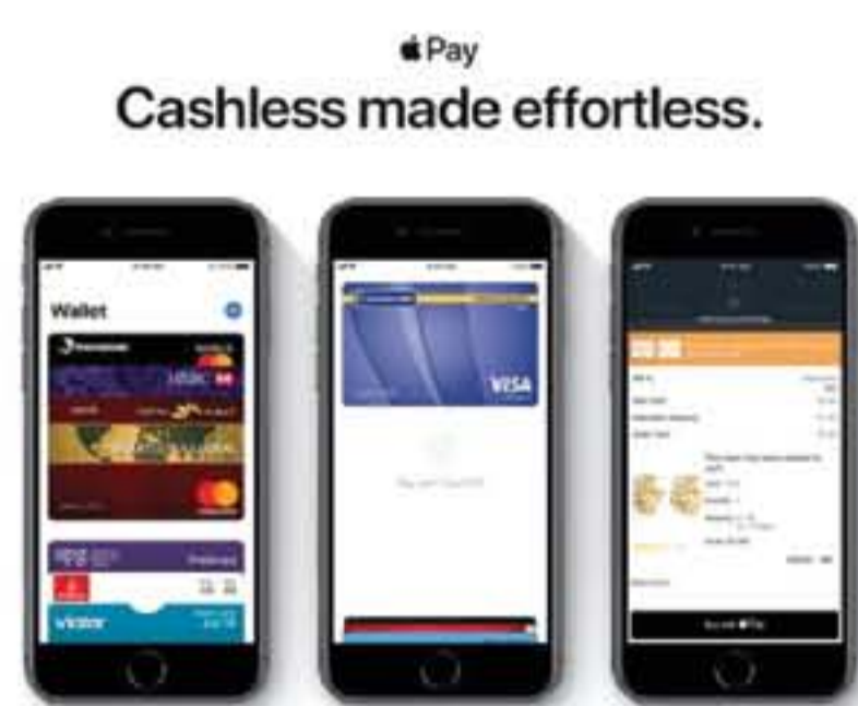
بطاقات الائتمان والخمسة أنظمة من أبل باي، ستدعم مجموعة من المصارف في الإمارات وما بعدها

أعلنت شركة أبل الثلاثاء رسمياً عن إطلاق خدمة الدفع الإلكتروني التابعة لها أبل باي، Apple Pay، في دولة الإمارات العربية المتحدة والتي قالت إنها ستستقل بمفهوم الدفع عن طريق الأجهزة المحمولة إلى بعد آخر يعتمد بالأساس على السرعة والأهم عامل الأمان.