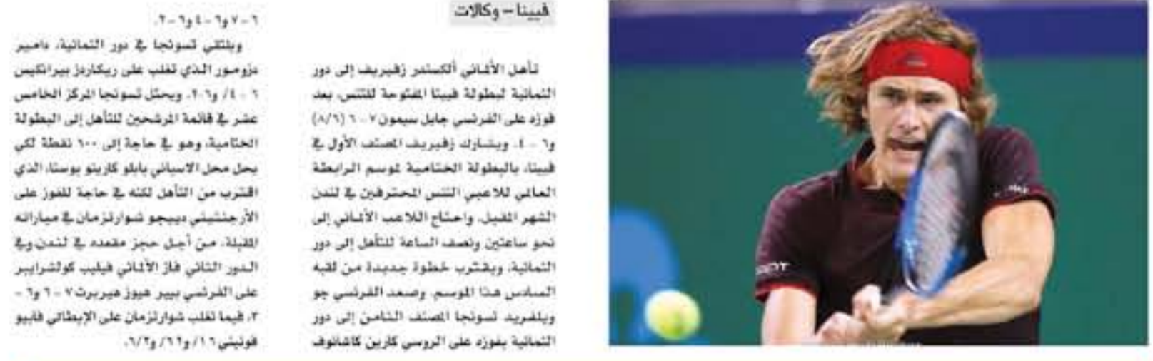
فيينا - وكالات

تأهل الألماني ألكسندر زفيريف إلى دور الثمانية لبطولة فيينا المفتوحة للتنس بعد فوزه على الفرنسي جابل سيغون (٦/٤). و٦-٤. وبشارت زفيريف تصفد الأول في فيينا، بالبطولة الخامسة موسم الرابطة الحالي للاعبين التنس المحترفين في لندن. ظهر الفيل، وأصبح اللاعب الألماني في دور ثمن ساعين ونصف الساعة لتتأهل إلى دور الثمانية، ويخسر خطوة جديدة من لقبه المسمى هذا الموسم، وبعد الفرنسي جو ويلفريد سولجا تصفد الثامن إلى دور الثمانية بطور على الفرنسي كرين كاشوف.