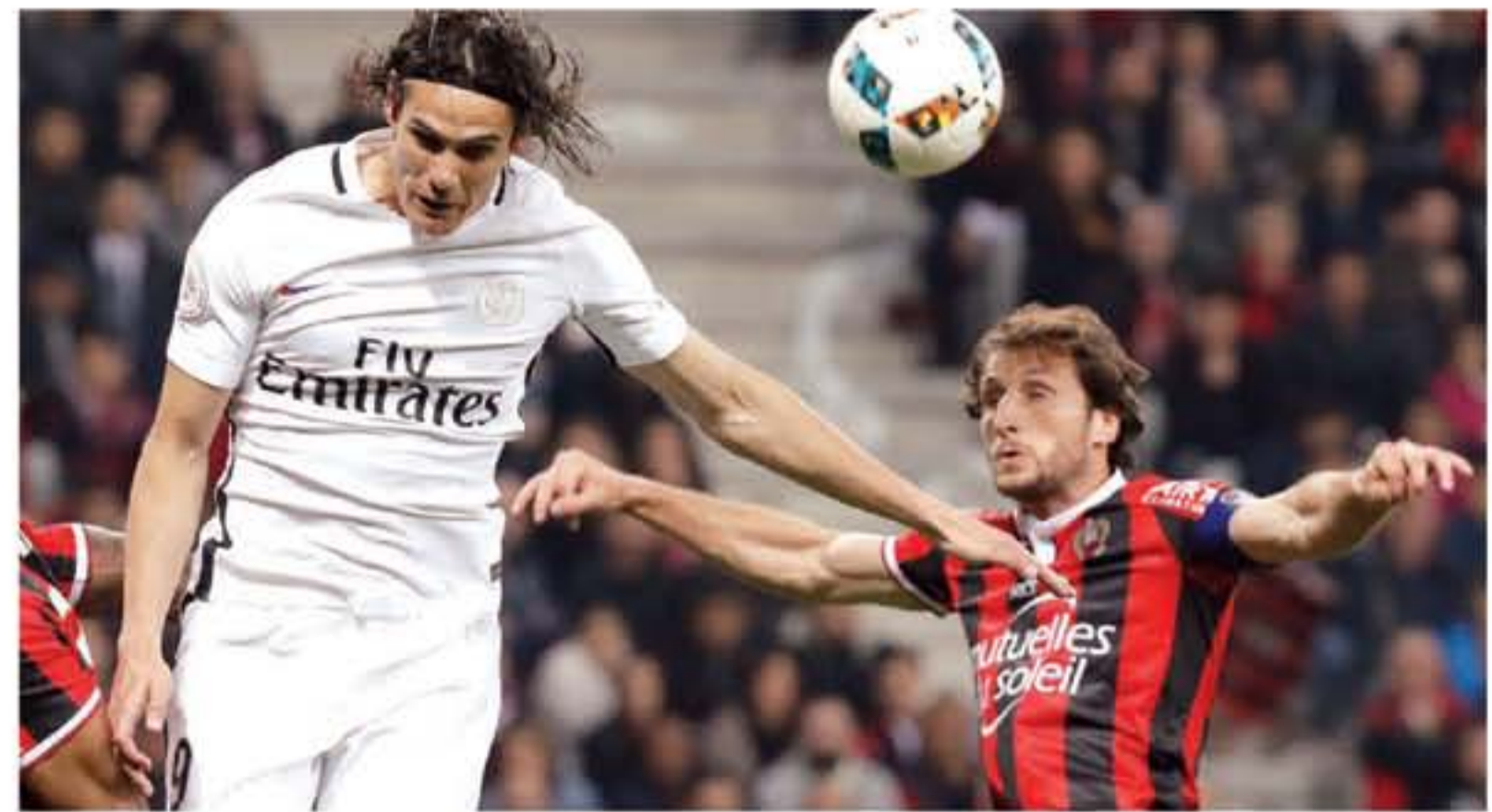
باريس - وكالات

الذي سيطر عليه بين ٢٠١٣ و٢٠١٦. فهو الوحيد حتى الآن لم يخسر في مبارياته العشر لكن فريق المشرق الاسياني أوناي إيستي سيواجه نيس لياقة من أسرة الكرة الأردنية لأهل القيد وأسرة نادي الجزيرة مستذكرا إنجازاته لا حياء ومدنيا واداريا داعيا أهلي عز وجل أن يتقدمه بواجب رحمة وإن يستكف فيح جنازه.