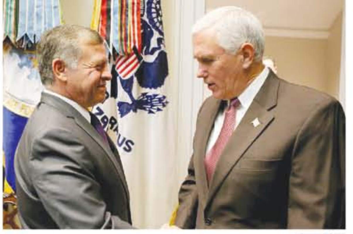
واشنطن - يترأ ركزت اللقاءات التي أجراها جلالته الملك عبدالله الثاني، في واشنطن أمس الاثنين، مع عدد من أركان الإدارة الأمريكية على آليات تعزيز الشراكة الاستراتيجية