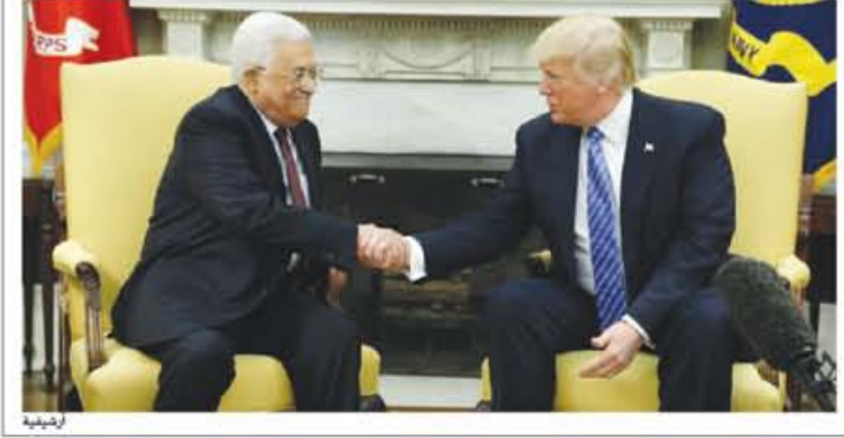
التفاصيل من ٢٣

تصريحات اسرائيلية تؤكد عنوان الصحيفة يوم الاحد الماضي وأوضحت جيللا جملليل، (الموجودة في مصر للمشاركة في مؤتمر نسائي تابع للأمم المتحدة) في حوار مجلة «السيادة» الأسبوع الماضي، أنه لا يمكن إقامة دولة فلسطينية إلا في سيناء، وبحسب القناة العبرية فإن الخارجية المصرية طلبت بشكل رسمي من نظيرتها الإسرائيلية توضح تلك التصريحات، مشيرة إلى أن مصر عبرت عن طريق سفيرها في تل أبيب حازم خيرت، عن غضبها الشديد إزاء