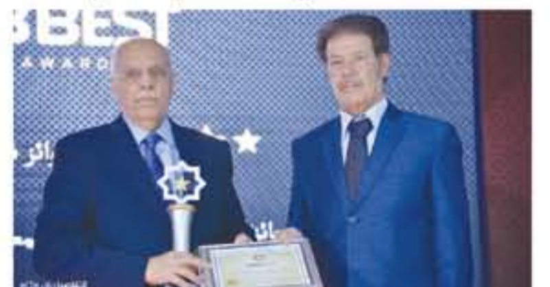
التفاصيل من ٦