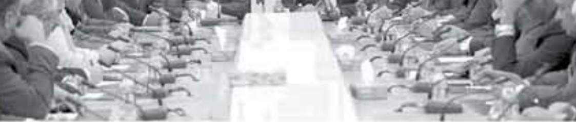
الصفدي يجري اتصالات مكثفة بشأن القدس

بجلسات الحوار برئاسة رئيس المجلس الأعلى، عاقل الطرفاء بحضور رئيس الوزراء، الذي يلقى دعم صريح ومومن. وأعلن الرئيس بحضور وزير الشؤون الاقتصادية مستنداً ما يلي: إننا لنقوم بالجنة المالية في مجلس النواب بوضع القوانين والمعايير لتوزيع الدعم بشكله والبالغ ١٠٠ مليون دينار المرسدة ضمن شبكة الامن الاجتماعي في مشروع قانون الموازنة. كما، الاستمرار في تقديم الدعم لمرضى السرطان، والبالغ ١٠٠ مليون دينار المرسدة ضمن شبكة الامن الاجتماعي في مشروع قانون الموازنة. كما، الاستمرار في تقديم الدعم لمرضى السرطان، والبالغ ١٠٠ مليون دينار المرسدة ضمن شبكة الامن الاجتماعي في مشروع قانون الموازنة.