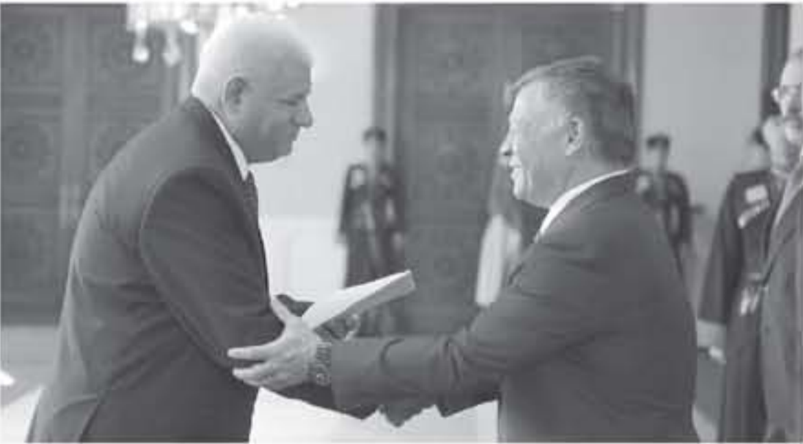
جلالته يقبل أوراق اعتماد عدد من المصراه