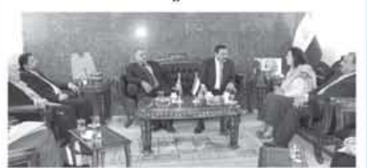
السفيرة لدى قائلها لجنة الأخوة البرلمانية الأردنية العراقية