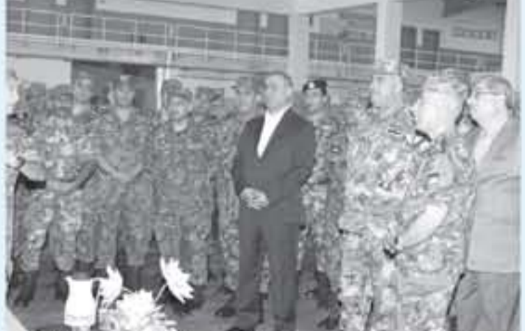
الفريق فريجات يفتتح عدد من المشاريع

رئيس هيئة الأركان المشتركة الفريق الركن محمود عبدالرحيم فريجات، أمسن الأثنين، عدداً من سفارة القوة البحرية والتعليمية في قاعدة القوة البحرية والتعليمية فواكجة في التطوير في القوات المسلحة الأردنية - الجيش العربي.