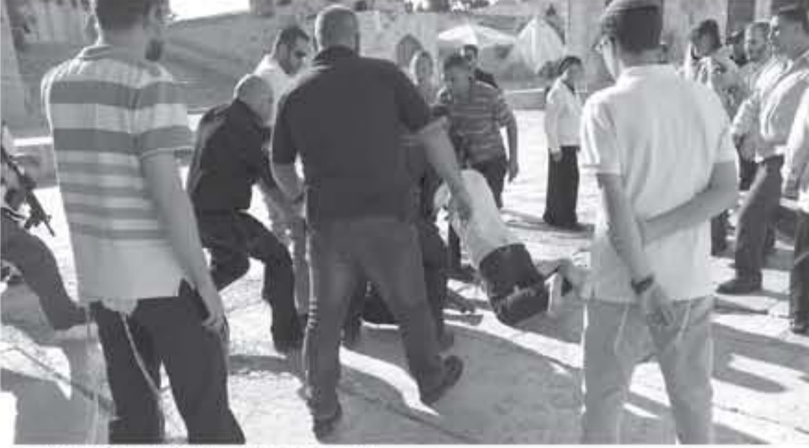
أرضية، من اعتقالات إسرائيلية لموظفي لجنة إعمار الأقصى

أجل الكف عن ممارساتها المرفوضة في القدس وخاصة في المسجد الأقصى المبارك ومحيطه. وفي سياق متصل استنكرت لجنة فلسطين النيابية اعتقال قوات الاحتلال الإسرائيلي أربعة من موظفي لجنة إعمار المسجد الأقصى المبارك داخل مسجد قبة الصخرة.