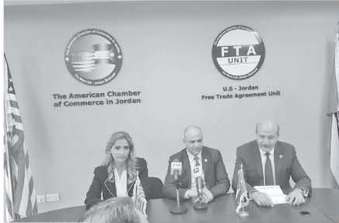
في وقائع المؤتمر الصحفي