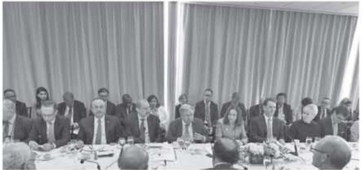
القدس المحتلة - وكالات

للتراجع الحاد في تمويل الخدمات المطلوبة لا يتوجب شل عمل «أونروا» في قطاع مكتوب ومعالجة مئات آلاف اللاجئين ولا يتوجب معالجة ٧٠ ألف طالب وطالبة غير إسرائيليون تعلق مدارسهم ولا بإطلاق عيادات صحية لتستقبل عشرات الآلاف من المراجعين يومياً ولا للمتفهمين من خدمات أونروا الإنسانية الأخرى. وشدد الناطق الرسمي أن الوكالة وقت عدم مسؤوليتها وقررت التصرف بالموارد المالية المحدودة بحصافة وحرس شديدين وقررت أن تكون أولويتها استمرار دعماتها الحيوية مهما كلف الثمن وتطبيق احتياجات مليوني لاجئ فلسطيني في القطاع يعتمدون على توزيع الوكالة لهم مواد غذائية وعينية أساسية لبناء وتلقيهم على مسير بعض من العاملين مدركاً بأن قرار عدم التجديد لجموعه محددة