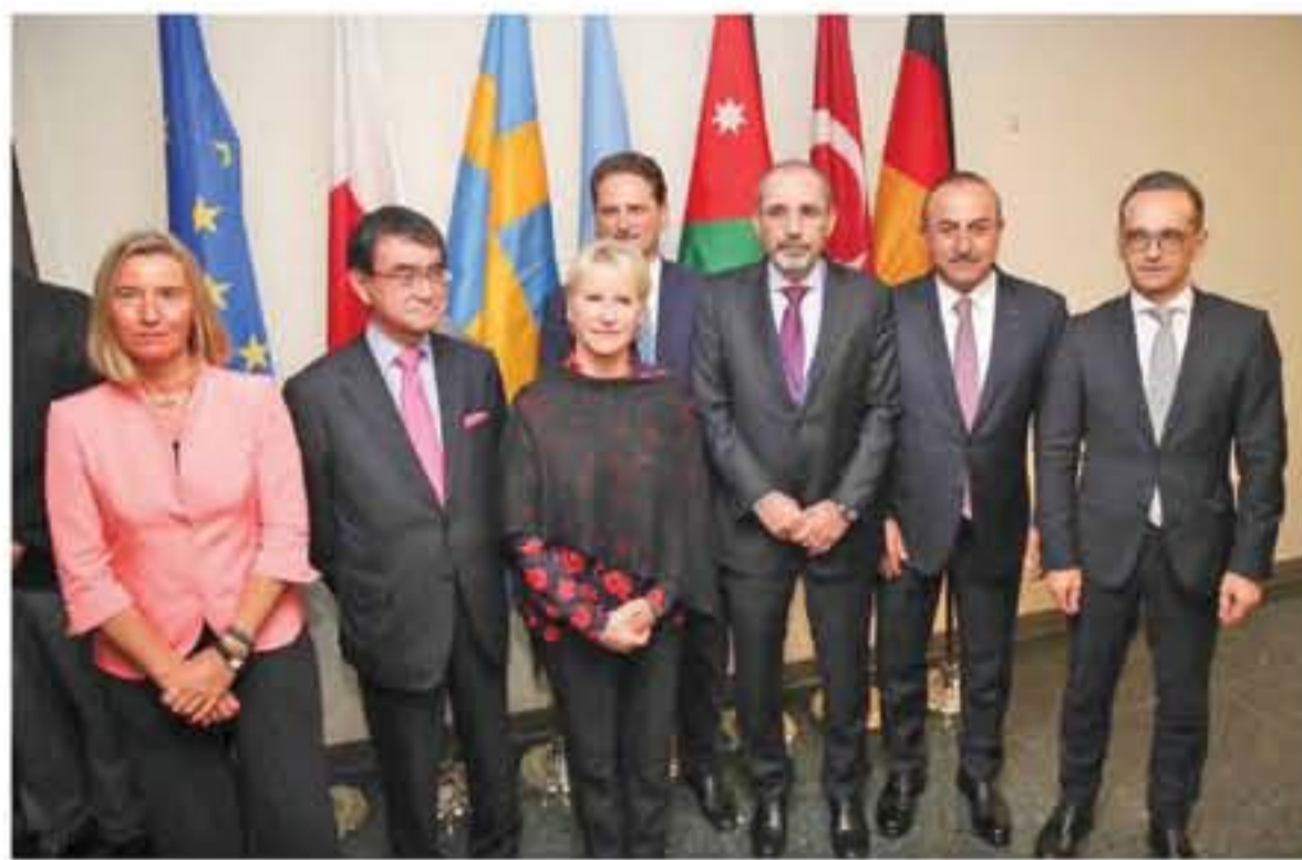
الحفاظ على وكالة الفوت حفاظ على حق خمسة ملايين لاجئ فلسطيني