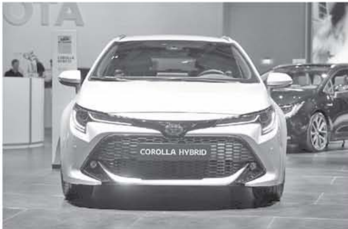
كما تتوفر السيارات بـ خيار محرك بنزين تقليدي سعة ١.٢ لتر يولد قوة ١١١ حصان. تعتمد هذه النسخ الجديدة من تويوتا كورولا ٢٠١٩ على قاعدة محركات TNGA، وحصلت على هيكل أهيون GAC.

ضمن مشاركة شركة تويوتا اليابانية ضمن فعاليات معرض باريس للسيارات ٢٠١٨، قامت بإطلاق نسختين جديدتين من طراز تويوتا كورولا ٢٠١٩، كورولا هاتشباك مع ٥ أبواب، و كورولا واجن. ميكانيكياً توأمت بنسخة الهاتشباك والتواجن من طراز تويوتا كورولا ٢٠١٩ المستقبلة وتعتمدان على نظام هجين وتكن ضمن حقل جديد يوفر خيارين من الأنظمة الهجينة. محركات تويوتا كورولا ٢٠١٩ بالنسخة الهاتشباك والتواجن كالتالي: محرك ١.٨ لتر يولد قوة ١٢٠ حصان و ١٤٢ نيوتن متر، مع محرك كهربائي يولد قوة ٧١ حصان و ١٦٣ نيوتن متر من عزم الدوران. محرك سعة لترين يولد قوة ١٧٧ حصان و ١٩٢ نيوتن متر من عزم الدوران، مع محرك كهربائي مصنوع من التيتانيوم يعمل الخيارين من المحركات على تحسين نسبة استهلاك الوقود وخفض الانبعاثات ثاني أكسيد الكربون، وتستطيع السيارة المزودة بهذه المحركات السير بالاعتماد على الطاقة الكهربائية بمعدل ٦٥٠