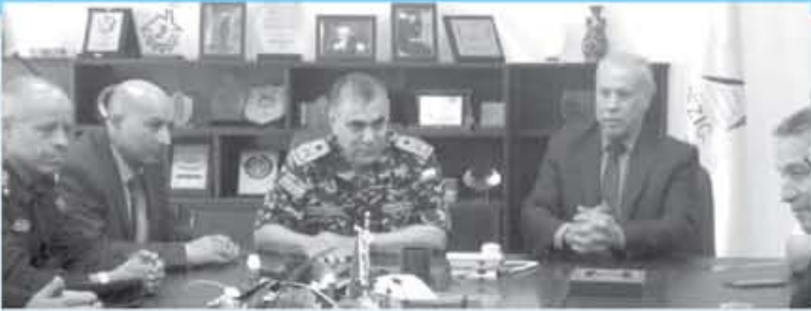
الجمركي، وأوعز إليهم ضرورة تقديم كافة التسهيلات الجمركية الكاملة وبما لا يتعارض مع الأهداف الأخرى لتجارتك.

وأضافت "تم اختياركم بمعناية فائقة لتكونوا موضع الثقة في القطاع المشروع الذي يهدف الى زيادة الاعتماد على الطاقة المتجددة مصدرا مستداما للكهرباء، بخلاف من كلف الكهرباء والدعم الحكومي خاصة لتوليد المدعومة.