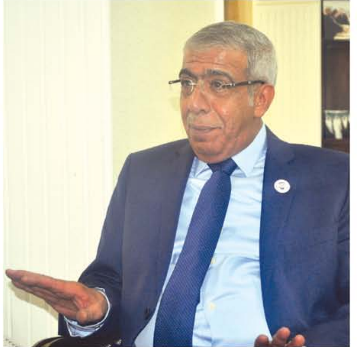
الأنباط - عمان - نعتت الخورة