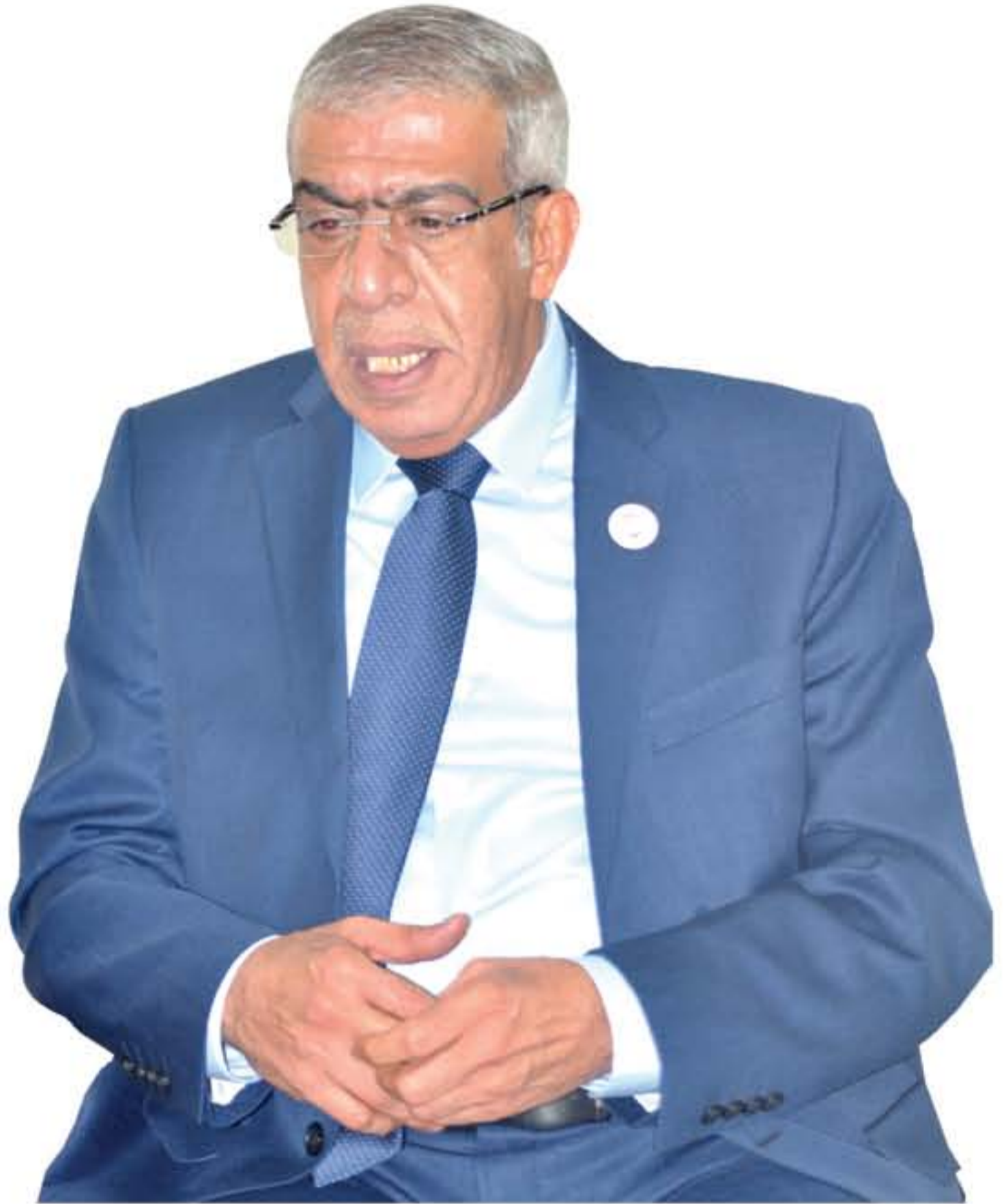
الأنباط - عمان - نعتت الخورة

• دعم إماراتي لإنشاء مصنع لتغليف التمور ومشاتل لزيادة الإنتاج