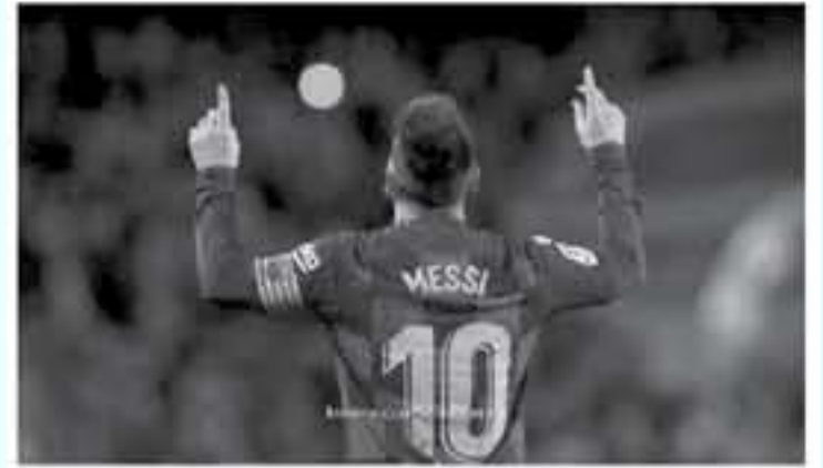
برشلونة - وكالات

غادر برشلونة صباح للفر إلى مايوركا مقر تجمع معن رافني التاجو قبل السفر إلى السعودية. وأضافت أن ميسي سيصل إلى المعسكر، فيما سيتم أيضاً كل من سيرجيو أجويرو ونيكولاس أوتامبدي ثنائي مانشستر سيتي. بجانب باولو دييالا نجم يوفنتوس ولقت الصحيفة إلى أن رافني التاجو سيترى في الجزيرة الإسبانية حتى الأربعاء المقبل، على أن تغادر البعثة إلى السعودية يوم الخميس.