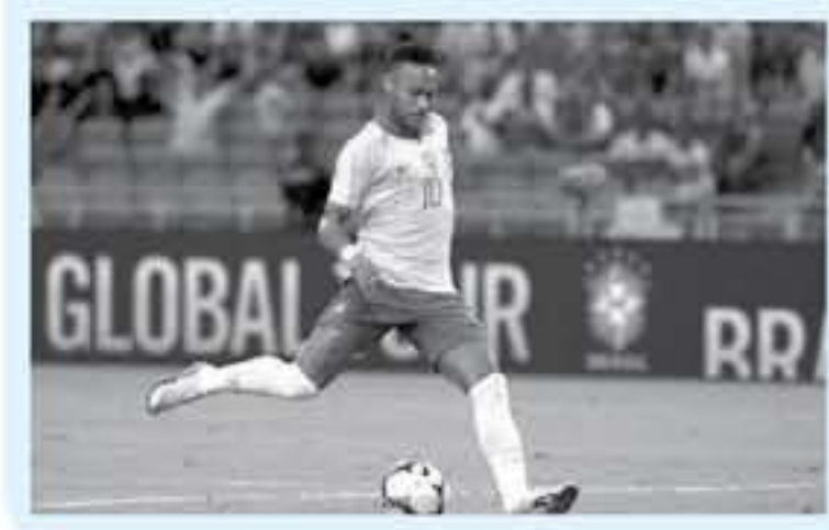
البرازيل - وكالات

كتشف والد البرازيلي نيومان دا سيلفا نجم باريس سان جيرمان الفرنسي، عن موقفه من المفاوضات مع برشلونة. حول عودة نجله مجدداً لصقوف الحريق الكاتالوني، وكان نيماز يعط الرواية في فترة الانتقالات الصيفية الماضية، بعدما صبر عن رغبته في الرحيل عن صفوف باريس سان جيرمان والعودة لبرشلونة، قبل أن يقرر رحيله للبارسا نظراً لخلافة النادي الفرنسي.