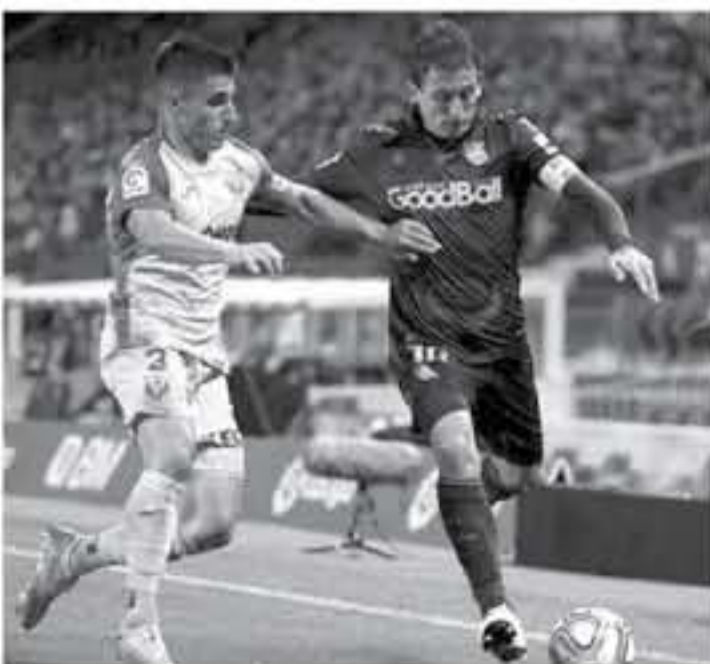
مدريد - وكالات

وأضاف "هو لاعب يمتلك الكثير من الطلاقة، يظهر أنه لا يشارك كثيراً في اللعب، لكن عندما يفعل يكون حاسماً للغاية... لا يمكنك مطلقاً أن تغضب الطرف عنه، حتى لو كان خارج اللعبة". وحول مدرب الفريق الجديد، المكسيكي خافيير أجيري، المدير الفني السابق لمنتخب مصر، والذي تولى مسؤولية ليجانيس لإبعاده عن منطقة القاع، حيث يحتل المركز الأخير بست نقاط، قال بوسيتزا "كل مدرب يمتلك طريقة عمل مختلفة.. ونابع "لاحتقنا في أجيري أنه ميسر للغاية مع كل اللاعبين، وهذا يجعل اللاعب يشعر بالطمأنينة، ويجعل طريقة العمل معه سهلة..