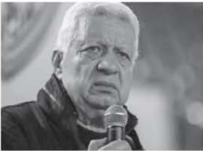
القاهرة

دوري الأبطال في العاصمة القطرية الدوحة ١١ فبراير / شباط المقبل. وقال مرئض منصور في تصريحات خاصة، "سيتم عقد اجتماع عاجل لمجلس إدارة الزمالك لمناقشة قرار المكتب التنفيذي بالانحياز الإفريقي كإجراء رسمياً من مواجهة الترجي بقطر". وكان مرئض منصور، قد أعلن في وقت سابق رفضه فكرة مواجهة الترجي بقطر، مؤكداً حفاظه على خياره السوبر الإفريقي حال إقامتها هناك.