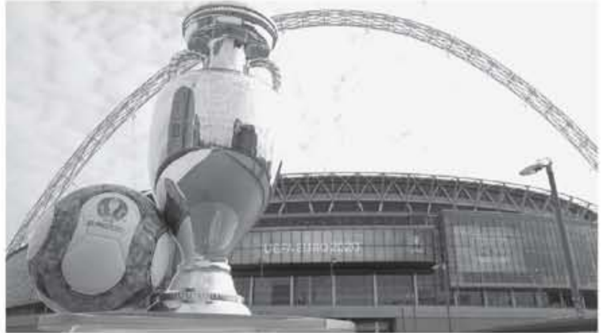
عواصم - وكالات

وكان الدور الفاصل تم تحديده من الناحية النظرية من دور المجموعات بدوري أمم أوروبا ٢٠١٨، وفي المسار الرابع نجح الأمر مع كل الفائزين بمجموعات المستوى الرابع، في دوري الأمم، ليحصلوا على فرصة فريدة من نوعها في التصفيات وتمكنت منتخبات إسكتلندا والنرويج وصربيا من تصدر مجموعاتها في المستوى الثالث بدوري أمم أوروبا ليشاركوا في الدور الفاصل. وكان منتخب البوسنة هو الوحيد الذي تصدر مجموعته في المستوى الثاني بدوري الأمم وفشل في التأهل لليورو من التصفيات، ونفس الحال يطبق على المنتخب الأيسلندي الذي كان يلعب في المستوى الأول في دوري أمم أوروبا وفشل في التأهل لليورو من التصفيات، ليشاركوا في الدور الفاصل وكانت كل الفرق التي شاركت في أعلى مستويين بدوري أمم أوروبا تأهلت بالفعل لليورو ليتبقوا الفرص لفريق التي لديها وأيا كانت الفرق الفائزة بالدور الفاصل ستلعب للعثورين فريفا التي تأهلت بالفعل لليورو، وسيتم تقسيمها في المجموعات خلال قرعة البطولة التي ستعقد يوم ٣ تشرين ثان/نوفمبر الجاري بيوخارست.