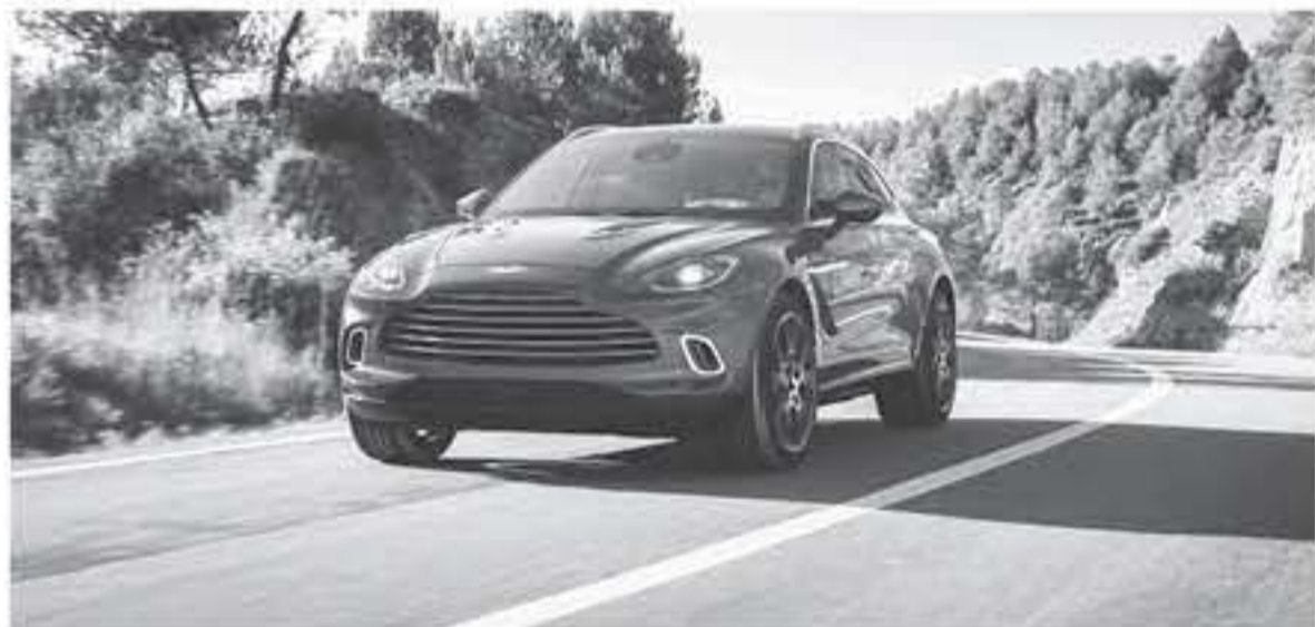
دبي - عرب جي تي

وأخيراً وبعد طول تشويق والانتظار ظهرت سيارة استون مارتن DBX 2021 الجديدة كلياً وبشكل رسمي ضمن فعاليات معرض لوس أنجلوس للسيارات 2019 . ويعتبر هذا الطراز أول سيارة استون مارتن SUV سيتم إنتاجها في تاريخ الشركة البريطانية التي تبذل من العشر 10 سنوات ، وكما نذكرون تم تقديم نسخة الاختيارية من هذه السيارة الجديدة بشكل مفاجئ ضمن فعاليات معرض جينيف للسيارات في عام 2018 ، لتعلن أنها ستنتج هذه السيارة نظراً لزيادة الطلب العالمي نحو شراء سيارات SUV . التصميم الخارجي لهذه السيارة المرتفعة عن الأرض مستمد من نسخها الاختيارية مع وجود اختلاف في تصميم عمدان التروس المستخدمة في الشبك الأمامية كما زودت سيارة الإنتاج التجاري بمصايح أمامية أكبر حجماً مع أضواء LED بالناكويد ، وهناك مصايح ضباب مختلفة ، ومن الجوانب زودت أحدث سيارات استون مارتن 2021 بمرايا جانبية بدلاً من الكاسيرت التي كانت متوفرة في السيارة الاختيارية ، ويبدو تصميم وميلاز سقف السيارة مختلف . وصولاً إلى الخلف نلاحظ الأضواء