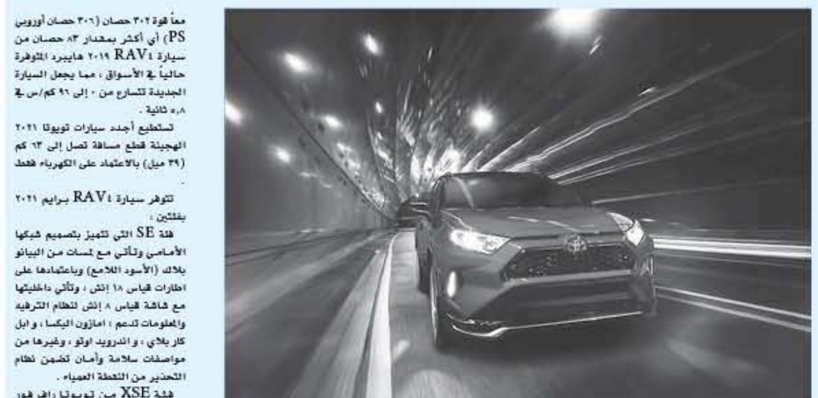
دبي - عرب جي تي

معاً قوة 202 حصان (306 حصان أوروبي PS) أي أكثر بمقدار 83 حصان من سيارة RAV4 2019 هايبرد المتوفرة حالياً في الأسواق ، مما يجعل السيارة الجديدة تتسارع من 0 إلى 96 كم/س في 7.8 ثانية . تستطيع أحدث سيارات تويوتا 2021 الهجينة قطع مسافة تصل إلى 33 كم (39 ميل) بالاعتماد على الكهرباء فقط