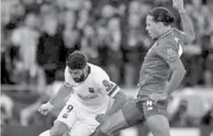
برشلونة - وكالات

كشف لويس سواريز مهاجم برشلونة، عن بعض الأمور التي حدثت أثناء مواجهة ليفربول في أغسطس خلال إصاب نصف نهائي دوري أبطال أوروبا بالموسم الماضي. وخرج برشلونة من دوري أبطال أوروبا الموسم الماضي بشكل كارثي من المربع الذهبي، حيث خسر إياباً أمام ليفربول في ألبين، رغم فوز البارسا ذهاباً بثلاثية دون رد وقال سواريز في تصريحات لصحيفة سبورت في الموسم الحالي تعرضت للإصابة مرتين، وكان الأمر مبالغاً فيه خلال المباراة الثانية.