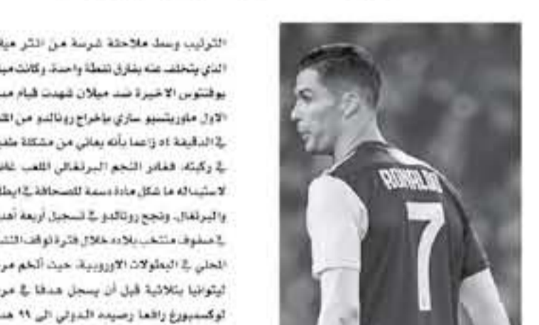
روما - وكالات

التدريب وسط ملاحظة مرسة من النثر ميلان الذي يتخلف عنه بفارق نقطة واحدة، وكانت مباراة يوفنتوس الأخيرة ضد ميلان شهدت قيام مدرب الأول موريثيو ساري بإخراج رونالدو من اللعب في الدقيقة 46 زاعماً بأنه يعاني من مشكلة طبية في ركبته، فقام النجم البرتغالي اللعب غائباً لاسيما أنه ما شكك مادة سعة للصحافة في إيطاليا والبرغال، وتجع رونالدو في تسجيل أربعة أهداف في صفوف منتخب بلاده خلال فترة توقف النشاط الحالي في البطولات الأوروبية، حيث ألقم مرمي ليتوانيا بثلاثة قبل أن يسجل هدفاً في مرمى لوكسمبورغ رافعا برصيده الدوري إلى 41 هدفاً. واعترف رونالدو (31 عاماً) بعد المباراة بأنه ينادر لتتبع الاحتقان مع مدربه ساري قبل التحاقه بتدريبات فريقه منتصف الأسبوع الحالي بمعاقلته من إصابة متقدمة بطله في الأسابيع الثلاثة الماضية لم اللعب بكامل أكانيا، بطبيعة الحال لا أحب عندما يتم استبدالي لأحد حين هذا الأمر وأنا أحاول مساعدة يوفنتوس حتى عندما أكون مصاباً. من جهة أخرى كشف موريثيو ساري المدير الفني ليوفنتوس، عن موقف كريستيان رونالدو نجم الفريق من المشاركة أمام اتلانتا، اليوم وقال ساري، في تصريحات أبرزها صحيفة «توتو سبورت» الإيطالية، أزمة تفسير كريستيانو الأمر ليس في حاجة للتوضيح. أنا في مجال التدريب منذ تسعينيات القرن الماضي، وحتى عندما كنت لاعباً