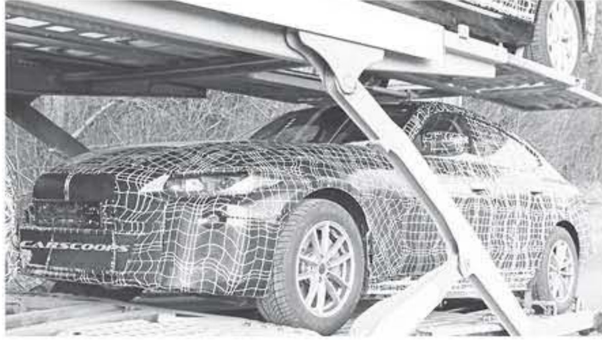
دبي - عرب جي تي

تعتمد على بطارية 75.7 كيلواط مع نظام دفع خلفي للعجلات يصدر منها قوة 282 حصان (281 حصان أوروبي PS) و 114 نيوتن-متر من عزم الدوران ، وتستطيع قطع مسافة 183 كم بالشحنة الواحدة. أو تعتمد على نص البطارية السابقة ولكنها تعمل بنظام دفع كلى للعجلات يصدر منها قى القوة ولكن عزم الدوران يبلغ 114 نيوتن-متر ، لتتسارع السيارة من 0 إلى 96 كم/س بحدود زمن 7.6 ثانية ، وتستطيع قطع مسافة 338 كم