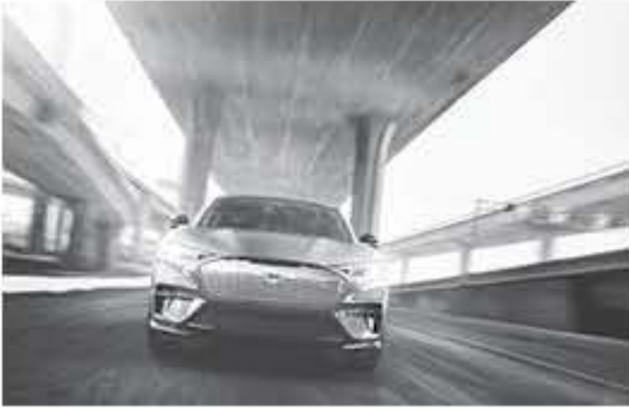
دبي - عرب جي تي