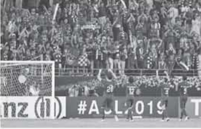
الرياض - وكالات

من المفاجئ في الملعب الذي يتسع لحضور نحو 63 ألف متفرج، ودكرت وسائل إعلام سعودية أن ولي العهد السعودي الأمير محمد بن سلمان، وجه بتخصيص 4 طائرات لنقل الجماهير إلى اليابان لدعم الهلال. من أجل إنهاء صياغته بالمسابقة الفارسية. ويسعى الهلال السعودي إلى بلوغ المجد الآسيوي للمرة الثالثة في تاريخه، بعد غياب 19 عاماً. ولعزز عودة الحارس الأساسي نوساكو نيشيكافا، حرص أصحاب الصياغة بعد غيابه عن لقاء الذهاب للإيفاء