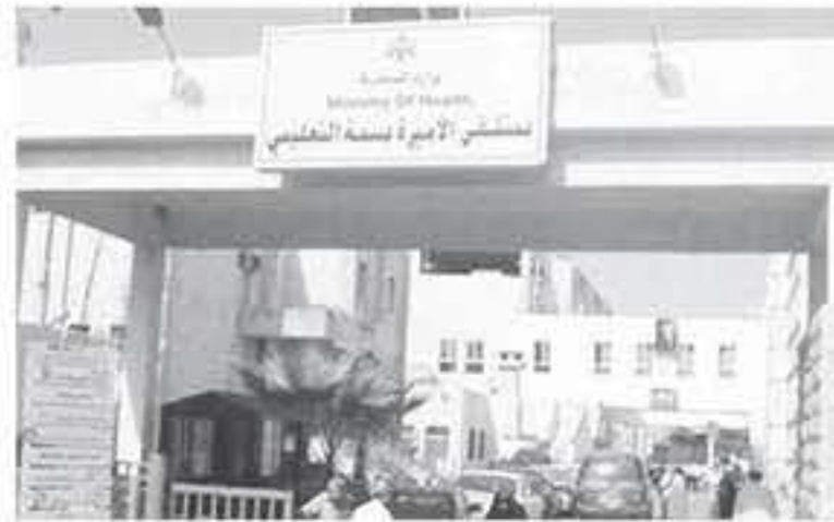
إربد - بتر

إبرة مبيعة للجلطة الدماغية عن طريق طبي وتدريبه وفني متخصص في التعامل مع الحالات المشابهة بإصابتها بسكتة دماغية بحيث يتم عمل الصور الطبيعية القوية لها وتجهيزها لإجراء