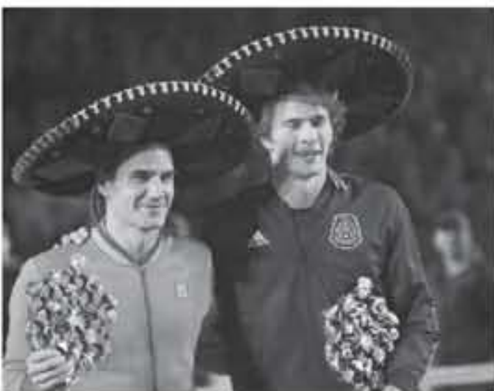
مكسيكو - وكالات

حفلت مسابقة روجر فيدرر الاستعراضية في مكسيكو سيتي التي هزم فيها الأثلي الكندي زهيريف ٣-٦ و٦-١ و٦-٢ في النقلة قبل الاخيرة، ولما قياسي في الحضور الجماهيري عندما يواحه رافائيل نادال في لقاء استعراضية يتجوب إفريقيا في فبراير / شباط، وستقام الفواجهة بينه وبين تاون الذي بلغ سبعة ٥٥ الف متفرج.