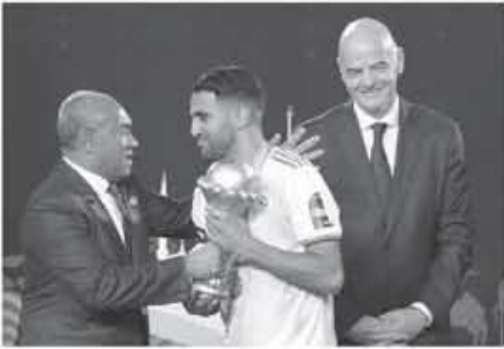
القاهرة - وكالات

اعلن الاتحاد الأفريقي لكرة القدم "كاف"، أمس الأحد، قائمة تضم ٣٠ لاعباً مرشحين للتمناسة على لقب أفضل لاعب في القارة السمراء عن عام ٢٠١٩. وضمت القائمة ١٠ لاعبين عرب من بينهم رياضي الجزائر ونشائي مصري ونشائي تونسي ونشائي مغربي، وتضم القائمة الرياضيين الجزائري إسماعيل بن ناصر لاعب وسط ميلان الإيطالي، رياض محرز نجم مانشستر سيتي الإنجليزي، يوسف البلايلي جناح الأهلي السعودي وبعثاء بونجاح مهاجم السد القطري. وشملت القائمة النشائي المغربي أشرف حكيمي لاعب يوروسيا تورسونوف والألماني حكيم زياتش صانع ألعاب أياكس الهولندي والنشائي المصري محمد صلاح نجم ليفربول الإنجليزي ومحمود حسن فريزجييه لاعب أستون فيلا الإنجليزي والنشائي التونسي طه ياسين الخليسي مهاجم الترجي التونسي وقرجاني ساسي لاعب وسط الزمالك المصري. وضمت أيضا النجم