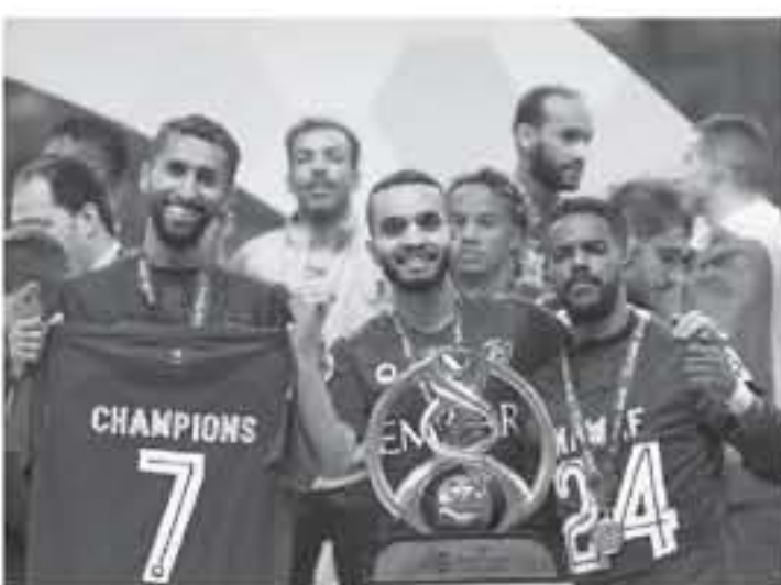
الرياض - وكالات

أسدى الأمير الوليد بن طلال، عضو شرف نادي الهلال السعودي، سعاده الكبيرة بفوز الزعيم ببطولة دوري أبطال آسيا على حساب مضيفه أوروا ريد دايونونز بطل اليابان، وقال الأمير الوليد بن طلال، عبر حسابه الشخصي على موقع "تويتتر"، عقب الفوز بالبطولة الآسيوية، "الهلال يمثل الوطن لكأس العالم للأندية،