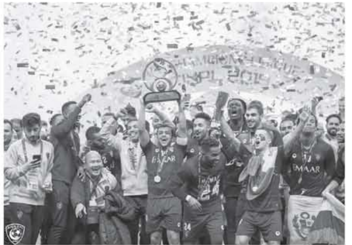
الرياض - وكالات

جوزيم في الدقيقتين (٧٤ و ٣٩٠). واستحق الهلال الفوز ذهبياً وإياباً وهي مناسبة لشهرة الأوتو خلال المباريات النهائية بدوري الأبطال، حيث بسط هيمنته على بطل اليابان الذي لم يجرؤ على تهديد مرصم الزعيم سوى بمحاولات بالسة. في المقابل، كان رفاق جوزيم "الهداف" وأفضل لاعب بالبطولة" الأخطبوط والأفضل على مدار اللقاء وأضاعوا فرصاً بالجملة، كانت كفيلة بمضاعفة النتيجة لولا حسن حظه بطل اليابان.