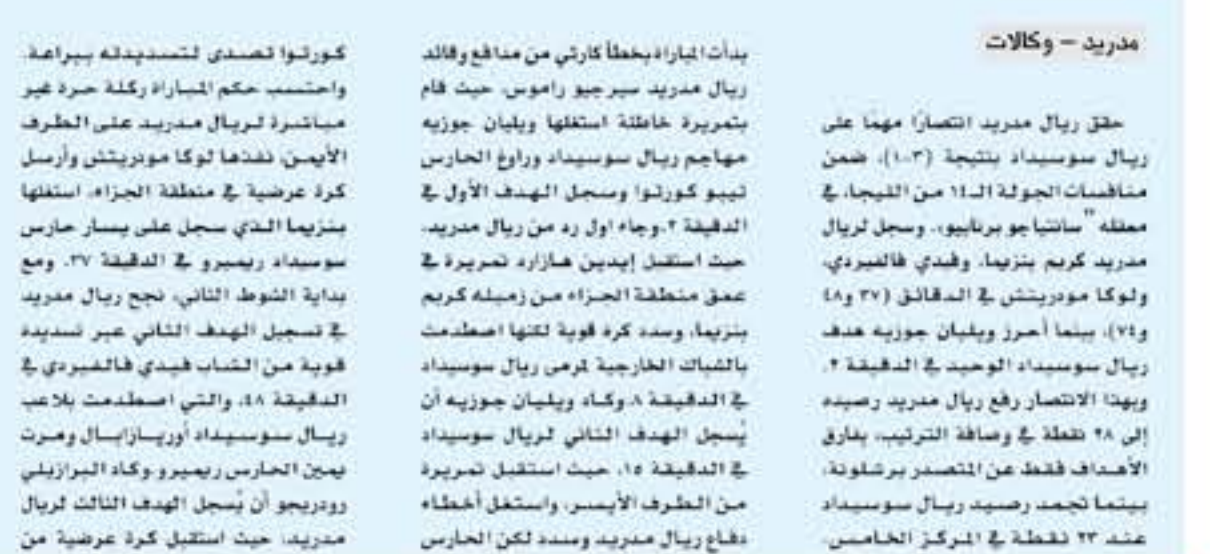
مدريد - وكالات

حلق ريال مدريد الانتصار مهما على ريال سوسيداد بنتيجة (٣-١)، ضمن منافسات الجولة الـ ١١ من الليجا، في ملعبه "سانتياجو برنابيو"، وسجل لريال مدريد كريم بنزيميا، وفدي فالفييري، ولوكا مودريتش في الدقائق (٣٧ و ٤٨ و ٧٤)، بينما أحرز ويليام جوزيه هدف ريال سوسيداد الوحيد في الدقيقة ٢. وهذا الانتصار رفع ريال مدريد رصيده إلى ٢٨ نقطة في وصافة الترتيب، بفارق الأهداف فقط عن المتصدر برشلونة، بينما تجدد رصيده ريال سوسيداد عند ٢٣ نقطة في المركز الخامس.