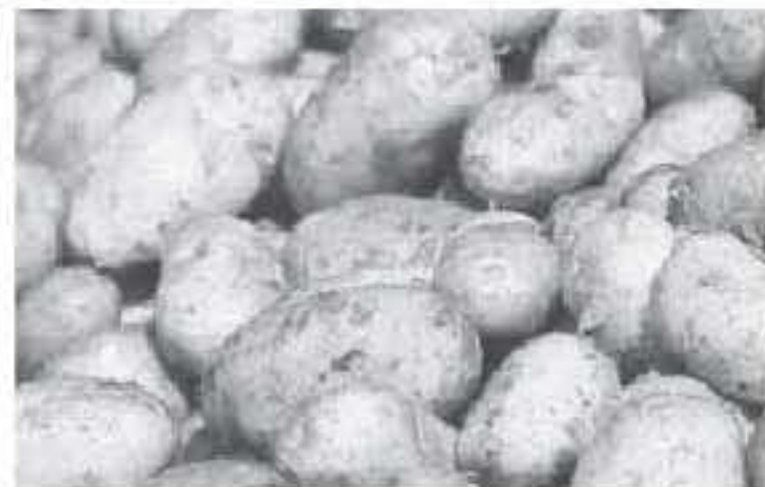
الأنباط - اربد

عوامل التلف لا تقتصر على مادة البطاطا لكن لأنها من المواد الغذائية الأكثر استهلاكاً برزت شكوى متعددة على ظهور آثار هساد عليها.