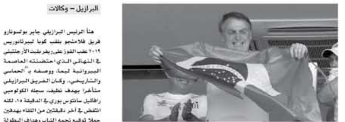
البرازيل - وكالات

هنأ الرئيس البرازيلي جابر بولسونارو فريق فلامنجو بلفب كوبا ليبرتادورس ٢٠١٩ عقب الفوز على ريفر بليت الأرجنتيني النهائي الذي احتضنته العاصمة البريبرولية ليماء، ووصفه ب"الحماس والشاريخي، وكان الفريق البرازيلي متأخراً بهدف نظيف، سجله الكولومبي رافائيل سانتوس بوري في الدقيقة ١٥، لكنه انقضى في آخر دقيقتين من اللقاء بهدفين حمل توقيع نجمه الشاب وهداف البطولة