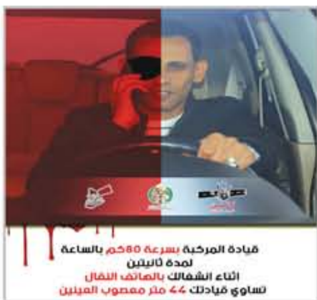
قيادة المركبة بسرعة 80 كم بالساعة لمدة ثلثين أثناء الشفالك بالماناف النفال تساوي فبادلك 44 متر معصوب المليون