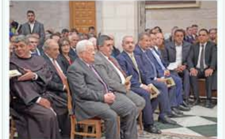
التفاصيل من ٢