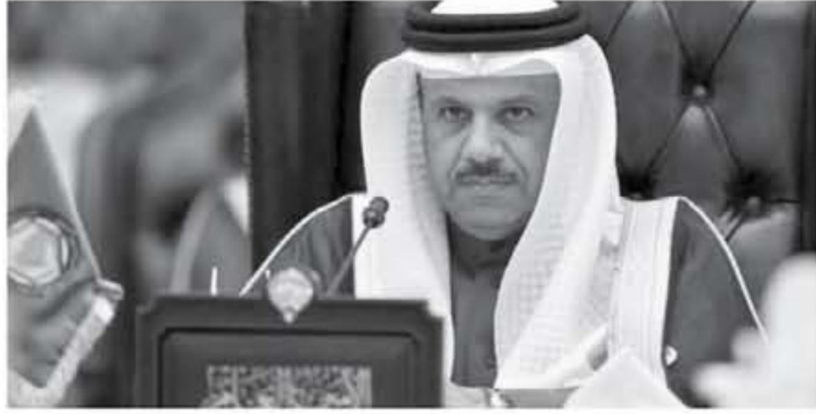
هذه الجريمة البشعة محاكمة شفافة تطبيقاً للقانون وإرساءاً للعدالة..