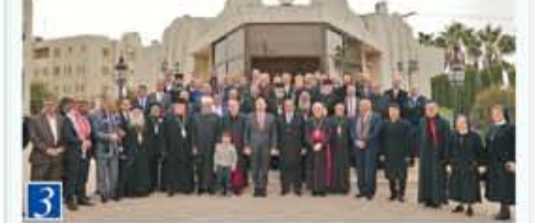
التفاصيل من ٣