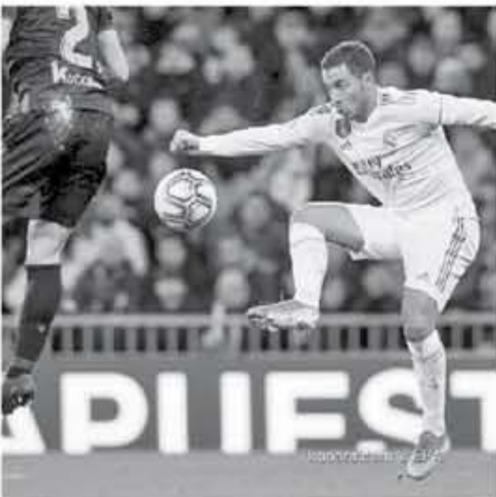
K. Ouedraoui.com © EPA