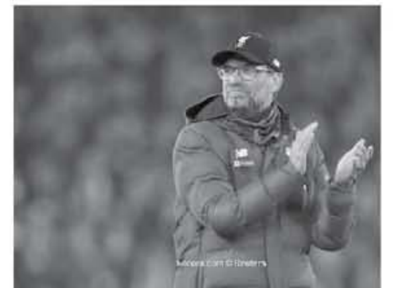
K. Ouedraoui.com © Reuters