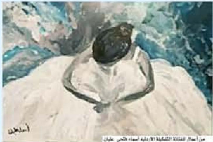
من أعمال الفنانة التشكيلية الأردنية أسماء حنجر سليمان

تغيرات في الشبهة والنوزن، إما زيادة أو نقصان، الحزن، والتحسن المزاج، وسرعة البكاء، عدم الاهتمام بالنفس وبالطرف الآخر، عدم التركيز والانحزال، فقدان الرغبة الجنسية، التفكير بأمور سلبية، تصل في حالات شديدة إلى الانتحار، الشعور السلبى تجاه الطرف الآخر، وعائلته، ومحتممه، التشكيك في صحة العلاقة الزوجية، وبأن التريك هو الخيار المناسب أم لا، التصالح والحلول التي يمكن إتباعها لتقوية من اكتئاب ما بعد الزواج وعلاجه