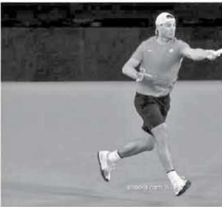
K. Ouedraoui.com © EPA