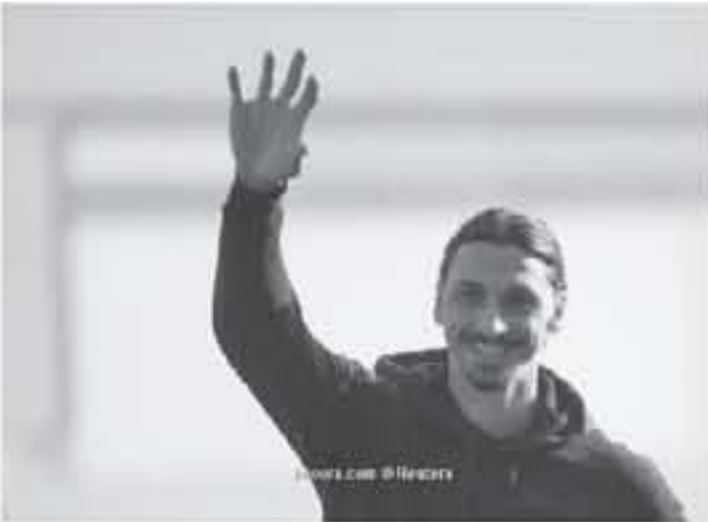
K. Ouedraoui.com © Reuters