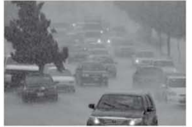
الانباط - عمان تتأثر المملكة اليوم، بكتلة هوائية باردة ورعشة مصاحبة لتخفيض جوي يتمركز فوق جزيرة قبرص، لذا يطرأ انخفاض على درجات الحرارة، وتسود أجواء باردة وغائمة جزئياً إلى غائمة مع عطول أمطار خفيفة في شمال ووسط المملكة، وتتعمق الكتلة الهوائية الباردة تدريجياً مع ساعات المساء والليل، وتعمل الأمطار في

شمال ووسط المملكة تمتد تدريجياً إلى أجزاء من جنوب وشرق المملكة، كما يتوقع أثناء الليل أن تكون الأمطار غزيرة على فترات، كما يؤدي إلى تشكل السيول في الأودية والناطق المنخفضة، ويصحها الرعد وشلالات البرد أحياناً، وهناك احتمال هطول زخات من الثلج فوق المرتفعات المحلية العالية، الرياح جنوبية غربية معتدلة إلى نشطة السرعة متيرة للغياب خاصة في مناطق البادية، ونسب الرطوبة يوم الأحد، تحت تأثير الكتلة الهوائية الباردة والرطوبة المرتفعة المنخفض الجوي، وتكون الأجواء باردة وغائمة ومعترة بين الحين والآخر في شمال ووسط المملكة وأجزاء من المناطق الشرقية، ويتوقع أن تكون الهطولات غزيرة أحياناً، مما يؤدي إلى تشكل السيول في الأودية والناطق المنخفضة، وتدرجياً مع ساعات الليل تضعف شدة الهطول، الرياح الغربية نشطة السرعة مع هبات قوية أحياناً، وتكون مثيرة للغياب خاصة في مناطق البادية، وتتراوح درجات الحرارة الكبرى والصغرى