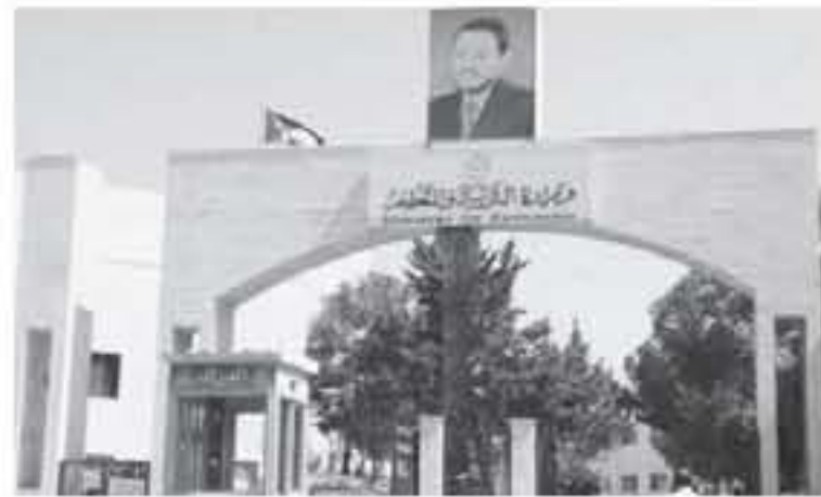
الانباط - معان

الحالي 2020/2019، فيما يتعلق بالواد المشتركة والحزم للفرعين العلمي والأدبي، مؤكداً أن خطة الامتحان كما هي ولا تعديل عليها. وأكد أن نظام 1400 المعتمد لجميع العلامات ما زال قائماً، بحيث يتم احتساب 7 مباحث في المعدل العام من أصل 8، ويواقع 200 علامة لكل مبحث، مبيناً أن 40 بالمئة من المعدل العام تخص مواد اللغات المشتركة، و 60 بالمئة للمواد الاختيارية كما هو معمول به الآن. من جهة اخرى، يشارك الأردن في الاحتفال باليوم العربي نحو الامية الذي يصادف في الثامن من شهر كانون الثاني من كل عام، وقالت وزارة التربية والتعليم، ان الأردن ارتك منذ عقود خلت خطوة مشكلة الامية، حيث عملت الوزارة فتح مراكز لتعليم الكبار ومحو الامية وتوسعت فيها حتى شملت جميع ارجاء المملكة، بهدف توفير الفرص التعليمية