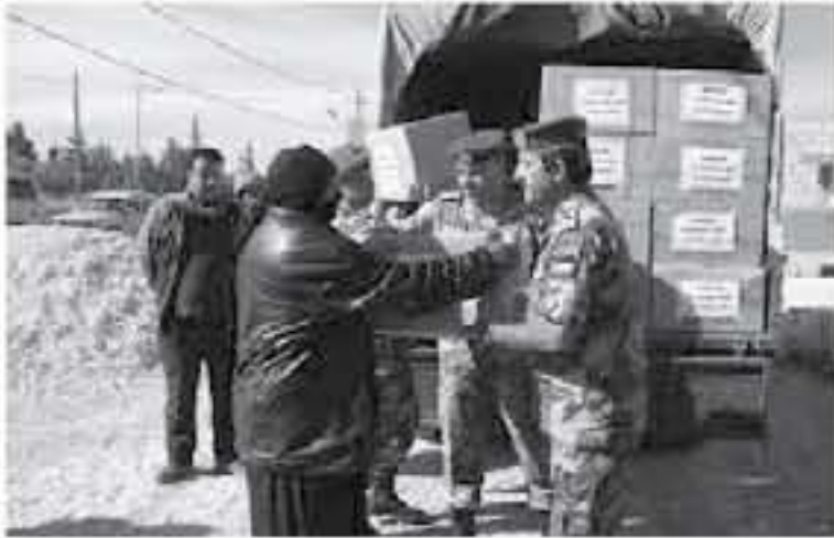
الانباط - معان

المجتمع وتلقه وتلمس حاجات المواطنين. واشتملت المساعدات على توزيع حرامات ومصوبات تدفئة للمواطنين في المناطق النائية والأكثر تضرباً جراء الظروف الجوية السائدة حالياً. من جهته، تشن أساليب المنطقة مواقف جلالة القائد الأعلى السامرة، مؤكداً التفاهم حول الرابطة الهاشمية، مبررين عن شكرهم واعتزازهم بالقوات المسلحة الأردنية - الجيش العربي.