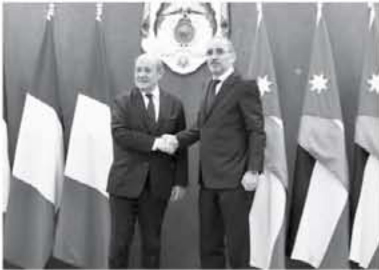
الانباط - معان

وتوديان على أهمية دعم استقرار العراق وأمنه وحماية مسيرة إعادة البناء التي بدأها. وأكد الوزيران أيضاً ضرورة الحفاظ على تماسك التحالف الدولي ضد داعش والجهود المستهدفة منه من إعادة بناء قدراته، والتفكير في إعادة الانتشار والتنسيق في جهودهما المستهدفة تجاوزاً لآزمات المنطقة وتحسين الأمن والاستقرار. وشدد الصفدي وتودريان على مركزية اشتراك الأردن الفرنسية وحرس البلدين لتطوير التعاون بينهما في مختلف المجالات.