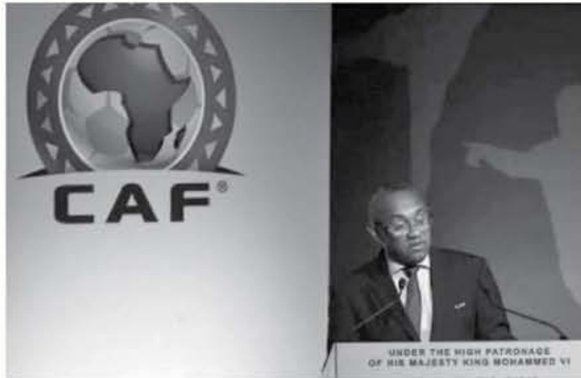
أمم أفريقيا التي ستقام عام 2021 في الكاميرون إلى الجزائر أو الغابون. وقال الكاميرون لا تواجه أزمة ملاعب، ولكنها تواجه مشكلة في

قال رئيس الاتحاد الأفريقي لكرة القدم (كاف) إن نادي الزمالك المصري مهدد بعقوبة قاسية إن لم يثمنه بمعاملة كأس السوبر الأفريقي المقررة في العاصمة القطرية الدوحة خلال الشهر المقبل. وكرر رئيس النادي مرتضى منصور الحديث عن معاملة مباراة السوبر الأفريقي ضد الترجي التونسي المقررة في 11 فبراير/شباط المقبل بسبب الخلاف السياسي بين الدوحة والقاهرة. غير أن رئيس الكاف أحمد أحمد أكد عدم تلقي أي إخطار من نادي الزمالك بشأن عدم المشاركة في مباراة السوبر. وقال أحمد - في تصريحات صحفية أمس الثلاثاء على هامش حفل جوائز الكاف في الغردقة بمصر - إن الفريق الذي يتسحب سيتم تطبيق اللائحة ضد بجرماته من البطولات القارية لمدة ثلاثة أعوام. من جانب آخر، نفى أحمد الأنباء التي ترددت حول نقل بطولته كأس