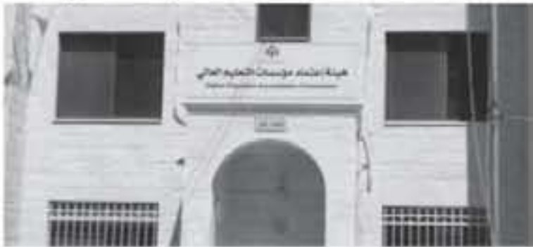
الانباط - معان

المجلس، على رفع الطاقة الاستيعابية العامة في جامعة معان الأهلية لتصبح عشرة آلاف طالب. كما قرر المجلس منح مهلة للكلية الأردنية للمؤهل والتكنولوجيا/كلية جامعية متوسطة لغاية الأول من شهر أيار المقبل، لاستكمال نواصص الاعتماد العام والحاضر، ومتابعة طلب برامج مؤسسات التعليم والتدريب على الإطار الوطني للمؤهلات.