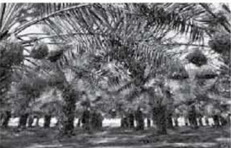
الانباط - معان

سيواصل إلى الفريق من استراتيجيات وبرامج وروية ومشاريع مستقبلية لتطوير هذه الزراعة، مشيراً أن الوزارة تعمل وفق رؤية واضحة متوائمة مع الأمن الغذائي والنهوض بالقطاع من خلال الحاصلات ذات القيمة المضافة والتصديرية وأهمها المحوول. وأكد أيضاً على رؤية 2030 والتي تشمل نقل وتأهيل الموارد البشرية والاستفادة من الموارد الطبيعية من مياه وأرض وبينة وساخ، وصولاً إلى مليون شجرة نخيل مدعومة بالبنية التحتية مثل التعبئة والتبريد والتخزين والحماية من الأفات والأمراض.