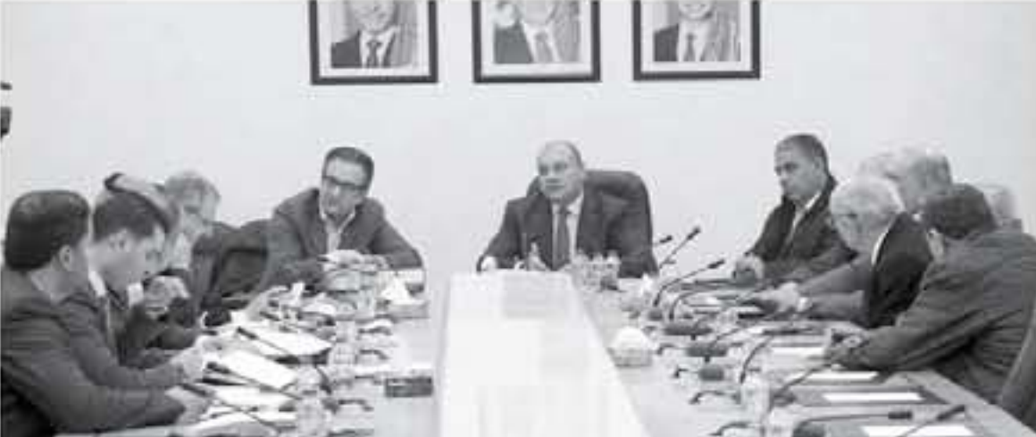
الانباط - معان