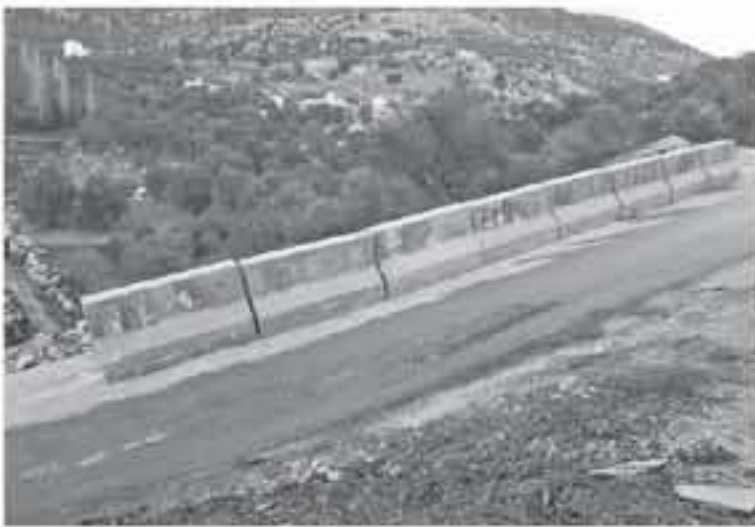
الانباط - عجلون

وضع الحواجز الاسهنتية حفاظا على سلامة مرافق الطريق من المواطنين وسائحي المركبات خصوصا بعد الشكاوى والاشكاكات التي وردت بعدى خطورة هذه الانهيارات. وأشار إلى أنه يتم متابعة مطالب المواطنين أولا بأول واتخاذ الإجراءات الفورية والسريعة وبخصوصا أثناء التخلفات الجوية لتسيير أودهم.