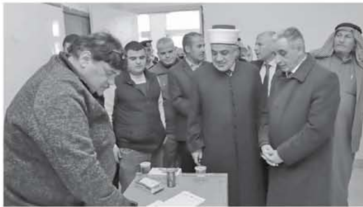
الانباط - الطفيلة

العلاجات اللازمة للمرضى بمختلف محافظات المملكة.