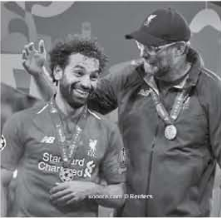
look.com | D Reuters