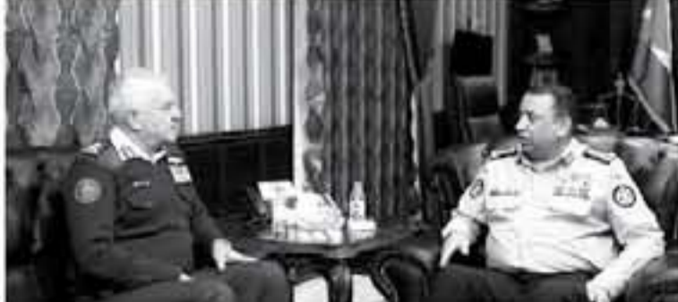
الإنباط - عمان

استقبل مدير الأمن العام اللواء الركن حسين الحوامنة في مكتبه أمس رئيس هيئة الأركان المشتركة اللواء الركن الطيار يوسف الحنيطي، حيث بحثا سبل وأوجه تعزيز التعاون المشترك في كافة المجالات الأمنية والعسكرية، وقال الحنيطي أن القوات المسلحة الأردنية والأجهزة الأمنية هم درع الوطن وعنوان أمنه واستقراره، وأن التوجهات الملكية السامية الرامية لرفع مستوى التعاون والتنسيق بينها هي التبراس الذي يوجهنا للتلاقح بمستوى الخدمة المقدمة للمواطنين ويحقق المصلحة العامة،