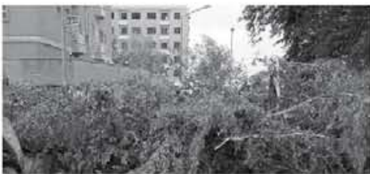
الانباط - الطفيلة

الرياح الشديدة والتهبات التربة الرخوة على طريق اربوب وذلك بالتعاون مع الدفاع المدني ومديرية الزراعة.