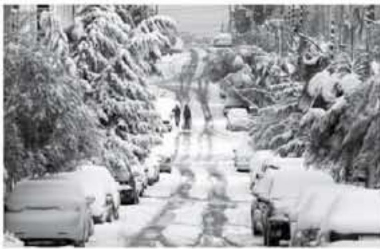
الإنباط - عمان

بين الحين والآخر عند ساعات الصباح الباكر فوق المرتفعات الجبلية التي ترتفع 1000 ألف متر عن سطح البحر، لافتاً إلى أن الثلوج ستكون متراكمة فوق المرتفعات الجنوبية على وجه الخصوص، فيما تسجل درجات الحرارة المنخفضة في العاصمة عمان 5 درجات مئوية لتتخلف أرباباً إلى حوالي الصفر المئوي، محذراً من تشكل الانجماد في ساعات الليل، وأشرف على إنقاذ الحالة الجوية سيرتاج مع ساعات أول الثلوج الكثيفة، فرسة الهطول وتكون الرياح شمالية شرقية لشدة نهاراً محذراً من مخاطر ذلتي هذه الرؤية الأفقية نتيجة الضباب، وترتكب الثلوج فوق المرتفعات الجنوبية، والارتفاع على الطرقات