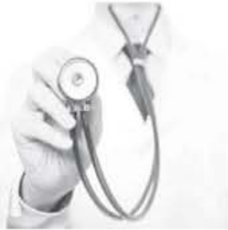
الانباط - إربد

يخصص يوم الثلاثاء للجدية والمعلم، ويوم الخميس للاعصاب والقلب العام، وتبدأ الضمانات يومياً من الساعة العاشرة صباحاً وحتى الساعة الثالثة بعد الظهر وتستمر حتى يوم الخميس المقبل إضافة إلى تقديم العديد من الاستشارات الطبية والأوبئة المجانية لطلابنا والسوريين من داخل المحافظة.