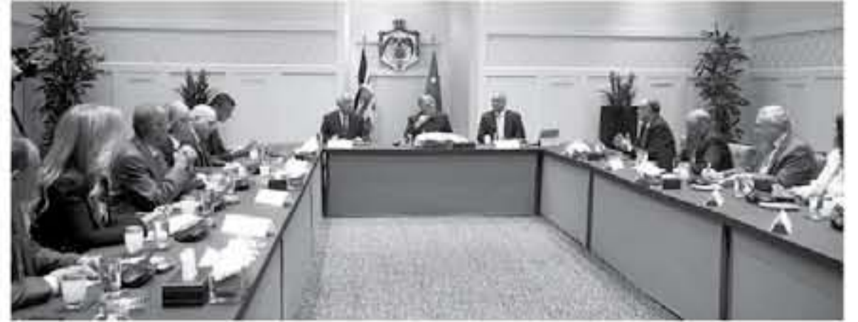
الإنباط - عمان

أكد جلالة الملك عبدالله الثاني أهمية الشراكة بين الحكومة والقطاع الخاص وأصحاب الخبرة، لتحسين الوضع الاقتصادي، وأصدر جلالته الملك خلال لقائه بشخصيات سياسية واقتصادية وأكاديمية وإعلامية في قصر الحسينية أمس الأحد، إلى البرنامج الاقتصادي الذي تشرفه الحكومة، لتحسين الوضع الاقتصادي وتوسيع الاستثمار، وأن الحكومة أعلنت