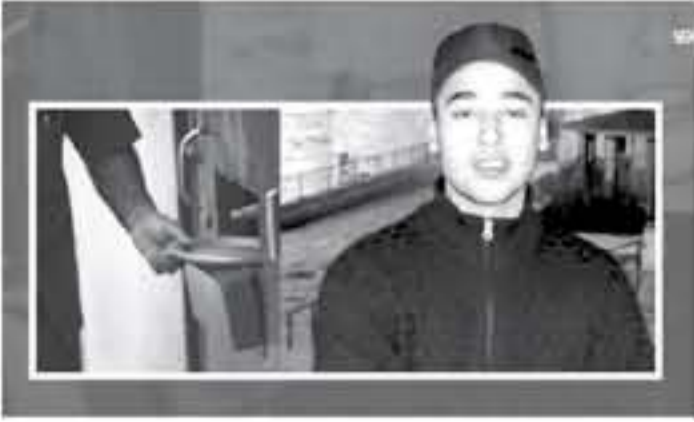
الانباط - القدس المحتلة

على خلفيات قضائية جنائية كتعاطي المخدرات والاغتصاب