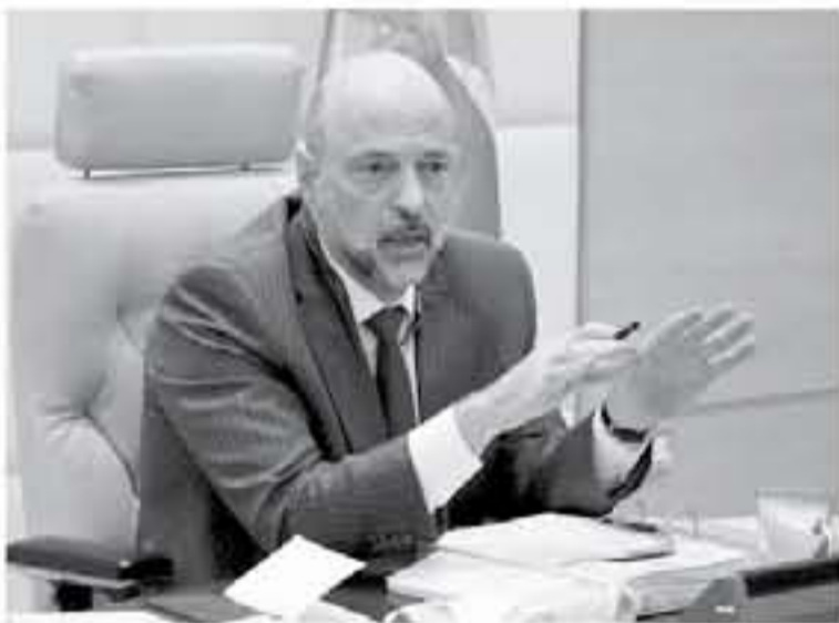
الإنباط - عمان

وافق مجلس الوزراء في جلسته، التي عقدها أمس الأحد، برئاسة رئيس الوزراء الدكتور عمر الرزاز، على السير بإجراءات ترخيص ثلاث جامعات طبية خاصة، ضمن ضوابط محددة مع التأكد من استيفائها الشروط اللازمة، وقال وزير التعليم العالي والبحث العلمي، الدكتور محي الدين توفيق، في تصريحات صحفية عقب جلسة مجلس الوزراء، إن المجلس ناقش من حيث المبدأ إنشاء ثلاث جامعات طبية خاصة، والسير بإجراءات الترخيص لها، شريطة الالتزام بمجموعة من الشروط والمعايير، وأوضح توفيق أن مجلس الوزراء اشترط في قراره أن تقدم الجامعة شراكة كاملة مع إحدى الجامعات العالمية المرموقة، التي تقع ضمن تصنيف أفضل 500 جامعة في العالم، إضافة إلى تزويد الجامعة المحلية الخاصة بأعضاء هيئة تدريسيين في مجال العلوم الطبية الأساسية في السنوات الخمس الأولى، حتى تتمكن الجامعات الخاصة من إعداد كوادرها البشرية، وأضاف "من بين الشروط الأساسية أيضاً أن يكون عدد الطلبة المقبولين في هذه الجامعات 1000 بالمتلة من غير الأردنيين كحد أدنى"، مؤكداً أن هذا الشرط سيساعد