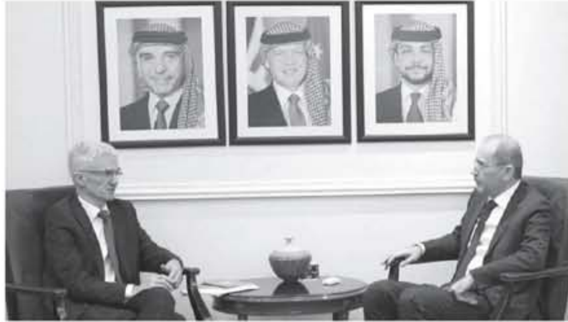
الأمم المتحدة وعملها، وقال إن الأردن يقدم نموذجاً في إنسانية تعامله مع اللاجئين، مؤكداً استناد المنظمة الدولية له في ما يقوم به من جهود لتوفير العيش الكريم لهم.

ان الاهتمام بالصحة الفكرية السليمة والتوازنة هي الثقافة الجديدة نحو مستقبل آمن مستقر، وترتقي بالانسان وصناعة المستقبل واعادة تشكيل العقول وسقوط اطماع المتطرفين اصحاب الاجندات المفضية.