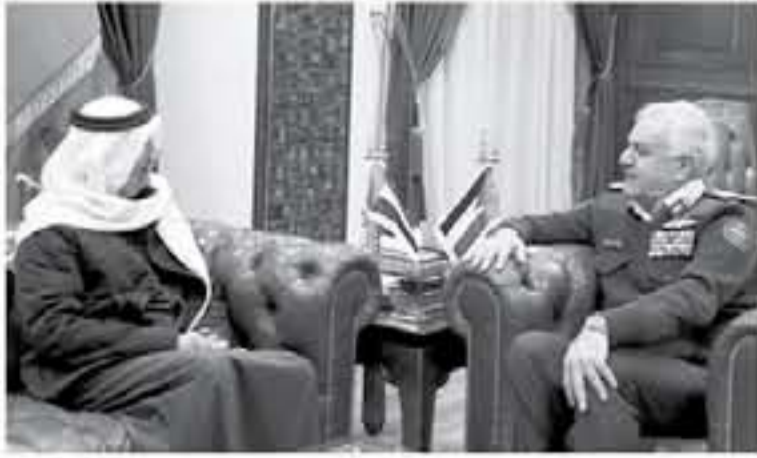
الإنباط - عمان

استقبل رئيس هيئة الأركان المشتركة اللواء الركن يوسف أحمد الحنيطي، في مكتبه بالقيادة العامة، أمس الأحد، السفير الإماراتي أحمد علي الفيولسي والوفد