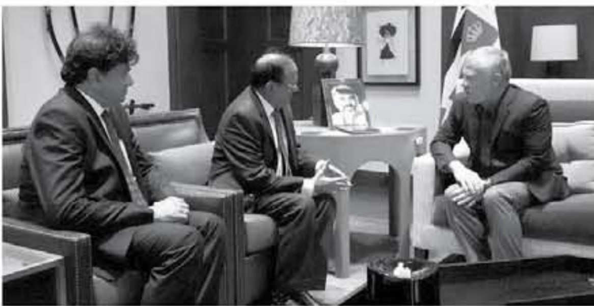
الإنباط - عمان

التقى جلالته الملك عبدالله الثاني، في قصر الحسينية أمس الأحد، مستشار الأمن القومي الهندي، أبيت موغال، في اجتماع تناول العلاقات الثنائية والتطورات الإقليمية والدولية، وتم التأكيد، خلال اللقاء، الذي حضره سمو الأمير فيصل بن الحسين، على أهمية مواصلة التنسيق والتشاور بين الأردن والهند حيال مختلف القضايا ذات الاهتمام المشترك، ولطرق اللقاء إلى الجهود المبذولة في الحرب على الإرهاب، وفق نهج شمولي، وحضر اللقاء مستشار جلالته الملك للاتصال والتسويق، ومدير المخابرات العامة، والسفير الهندي في عمان