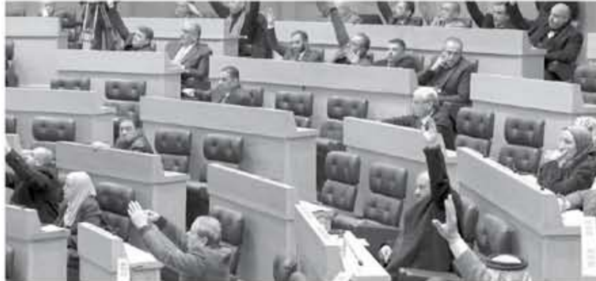
تم تقديمها لرئيس المجلس وتم تحويلها للجنة القانونية الثابتة، واصف انه بحسب قرار اللجنة القانونية الدورية فإنه يحظر على الحكومة بوزارتها وشركائها ومؤسساتها استيراد عاده الغاز من اسرائيل، وتم إحالة القرار للحكومة لوضع صيغة مشروع قانون بما يتوافق مع أحكام الدستور وقدمه لمجلس النواب، لإقراره