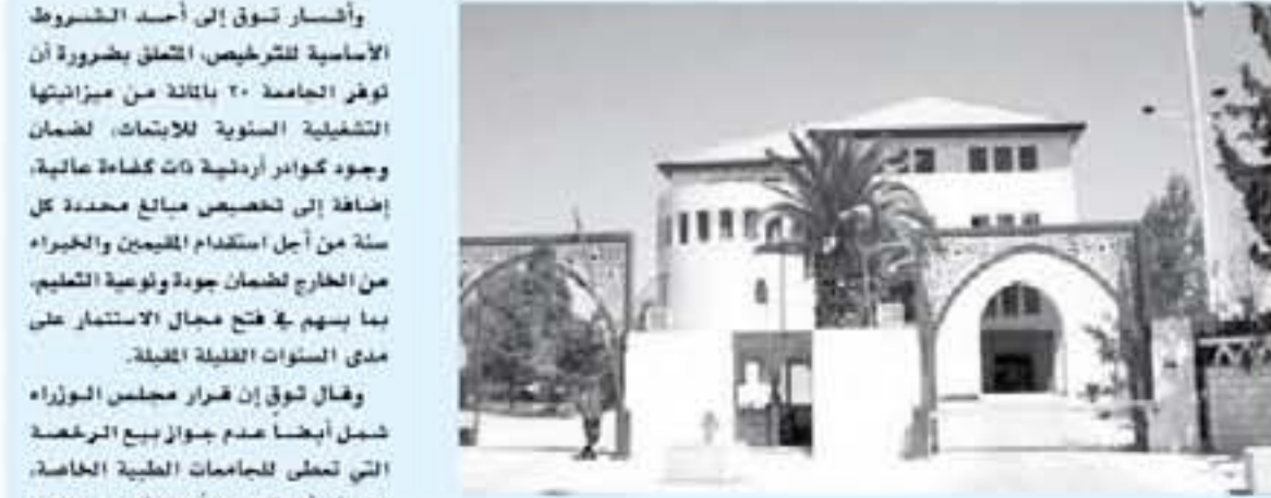
الإنباط - عمان

هيئة تدريسيين في مجال العلوم الطبية الأساسية في السنوات الخمس الأولى، حتى تتمكن الجامعات الخاصة من إعداد كوادرها البشرية، وأضاف "من بين الشروط الأساسية أيضاً أن يكون عدد الطلبة المقبولين في هذه الجامعات 1000 بالمتلة من غير الأردنيين كحد أدنى"، مؤكداً أن هذا الشرط سيساعد على استقطاب عدد كبير من الطلبة العرب والأجانب للدراسة في الأردن، وتابع "أن المجلس اشترط في موافقته على ترخيص الجامعة الطبية الخاصة، أن تعتمد على مصادرها الخاصة في الهيئات التعليمية، بما لا يلحق الضرر بالجامعات الرسمية القائمة حالياً،