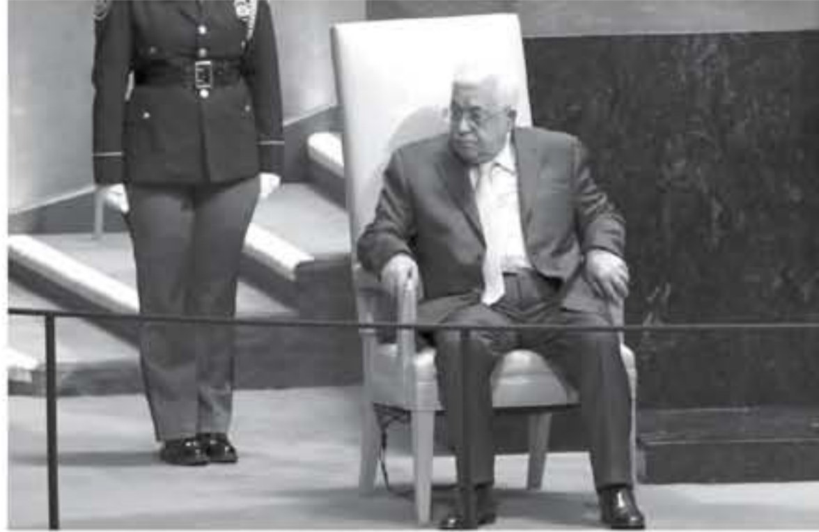
الجبهات التي يتألف منها الجيش