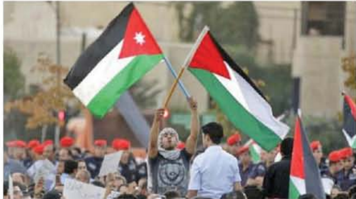
الابتباط - عمان قال مصدر رسمي أمس الجمعة، عن أن موقف الأردن ثابت تجاه القضية الفلسطينية. وأضاف أن الأردن متمسك بهوقفه تجاه القضية الفلسطينية، مشيرا إلى أن القضية تعتبر مصلحة عليا للدولة الأردنية. وأكد، أن القضية الفلسطينية تعتبر الأخرى الأسمى للأردن، منوها إلى أن بنود الصفقة لم يطبق عليها الأرض لعابة الخطة. وجدد المصدر التأكيد على الوقت، الأردني بشأن القاعة الدولية الفلسطينية على حدود الرابع من حزيران عام ١٩٤٧ وعاصمتها القدس المحتلة.

فضلا عن تلبية النداء الفلسطيني للشروع لتعبق الفلسطينيين وفق الشرعية الدولية والبيان العربي للسلام. وكان الرئيس الأمريكي، دونالد ترامب، قد أعلن مساء الخميس أنه يعتزم الكشف عن خطة سلام الشرق الأوسط في وقت ما قبل زيارة رئيس الوزراء الإسرائيلي بنيامين نتانياهو في ٢٨ كانون الثاني الجاري، وأوضح ترامب أن إدارته تحدثت ويحازع الفلسطينيين وستحدث اليهم مجددا، مضيفا "خطة البيت الأبيض للسلام في الشرق الأوسط خطة عظيمة، وقال ترامب للصحفيين، "في مرحلة ما قبل الاجتماع مع نتانياهو) ربما سألنا (عن خطة السلام) قبل ذلك بوقت قصير.. وأضاف ترامب، "خطة واشنطن للسلام في الشرق الأوسط خطة عظيمة، وأشار ترامب إلى أن رد فعل الفلسطينيين على الخطة قد يكون مليحا في البداية، لكنها إيجابية بالنسبة لهم ولديهم العديد من المزايا للقيام بها. وفي وقت سابق يوم الخميس، أعلن ماكينتنس نائب الرئيس الأمريكي، أن ترامب وجه دعوة إلى بنيامين نتانياهو وبينين غانتس لزيارة البيت الأبيض ناقضا ما يعرف بـ "صفقة القرن". وبمجرد قال نتانياهو، إنه قبل دعوة الرئيس الأمريكي لزيارة واشنطن.