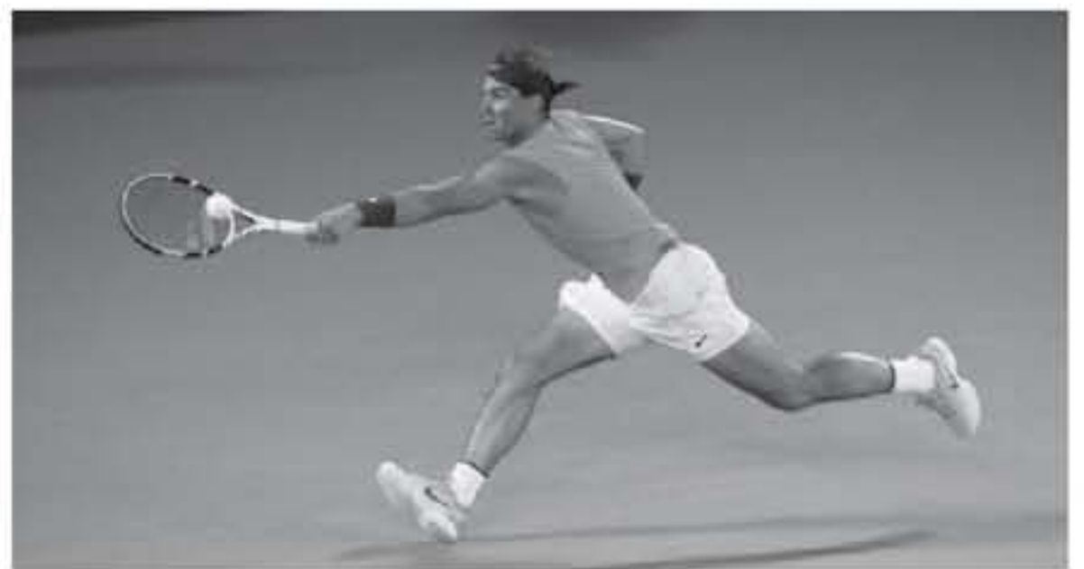
سيدني - وكالات

دقيقة، بدأ نادال السبارة بقوة، من خلال الحصول على الترقوق المبكر في المجموعة الأولى والتقدم 1-0، بتغطية اللعب بصورة جيدة من الخط الخلفي مع فشل كيريبوس في تصفير التبادلات وارتكاب الأخطاء المتكررة، وسيطر نادال تماماً على التبادلات من