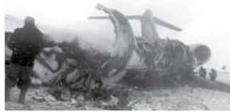
أمريكيين. وقال: الحادث أدى إلى مقتل الكثير من عناصر الجيش الأمريكي، دون مزيد من التفاصيل. وأشارت "أوسبيتشيد برس" إلى وجود