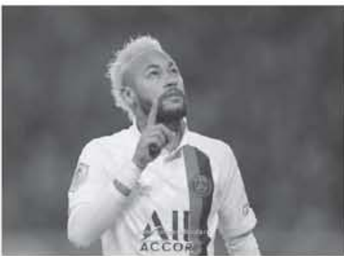
باريس - وكالات

ليل بهذه الطريقة تكريماً له، وواصل "وفاة كورس براينت خسارة كبيرة لعالم الرياضة، وعن تألقه أمام ليل، قال نجم من إس جي "أنا سعيد للغاية لمساعدة الفريق على الفوز، أعرف جيداً ما يجب علي فعله في الملعب، وأكون في حالة تركيز 100، أتمنى أن نحقق إنجازاً كبيراً هذا الموسم، أشعر أنني في أفضل حالاتي، وسجل ثمانية أهداف في شباك ليل ساهمت في فوز الفريق الباريسي بنتيجة 2-0 مساء الأحد في مباراة الناديين بالدوري الفرنسي،