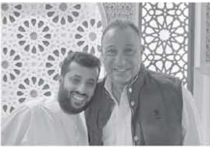
القاهرة - وكالات

التقى الرئيس التنفيذي للشركة كينادي بعد الجراحة التي أجراها الأخير في أمريكا، وقابحاً، أعرب الخطيب عن خالص تهنئته بالشفاء العاجل للمستشار تركي آل الشيخ وأن يتجاوز الوعكة الصحية التي آلت به خصوصاً أنه سوف يخضع لجراحة أخرى خلال أيام. وأن يعود بموهور الصحة والعافية إلى وطنه وأنه ومحببه، وكان الأهلي قد كشف قبل أيام استمرار آل الشيخ رئيساً شرفياً للشركة الحمراء وضم قبول استقالته التي تقدم بها قبل عام ونصف العام.