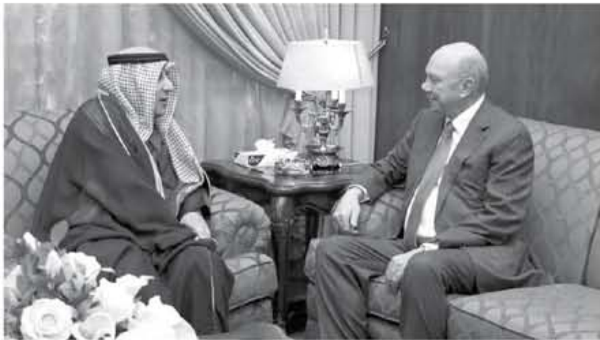
وثوابتنا الراسخة، ومن هذه الرؤية، دولة في شؤنها، مشيرة الى اهمية تعزيز التنسيق المشترك بين البلدين الشقيقين في برهض الاردن، تحت أي تربة، تدخل أي

خاصة اننا متقدمون ومتطورون بهذا المجال ولتيم تصدير خبراتنا ذات الكفاءة المشهود لها بذلك لتلك الدول وفق برامج ، فالتطوير للبرامج الاجتماعية والانسانية متوفر من الدول والمنظمات العاصرة لثل هذه البرامج .