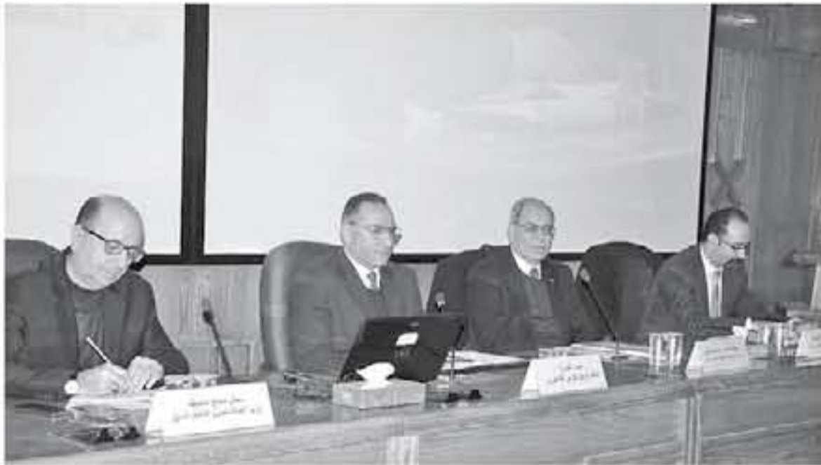
والمؤسسات الأهلية انطلاقاً من التوجيهات الملكية السامية المستمرة في تقديم كافة أشكال الدعم اللازم في فلسطين. وأشار مدير مكتب تنسيق المفاوضات