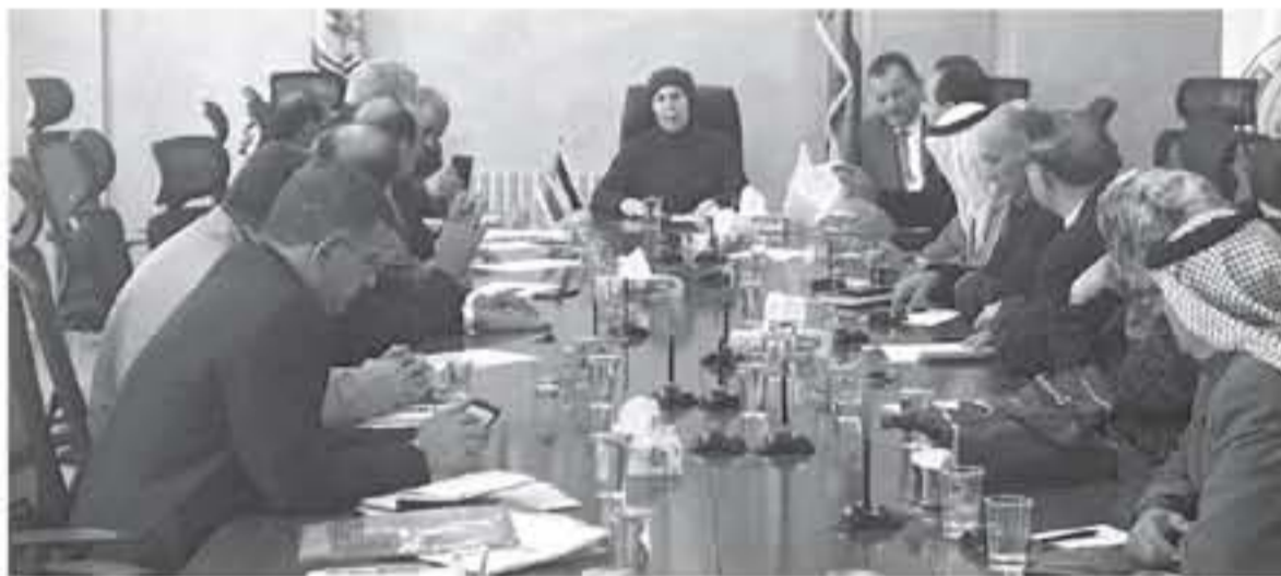
ان الوزارة ستدعو الهيئة العامة للانتخابات العام للجمعيات الخيرية لعقد انتخاباتها، من جهة اخرى، اوضحت اسباقات، والتمتها.