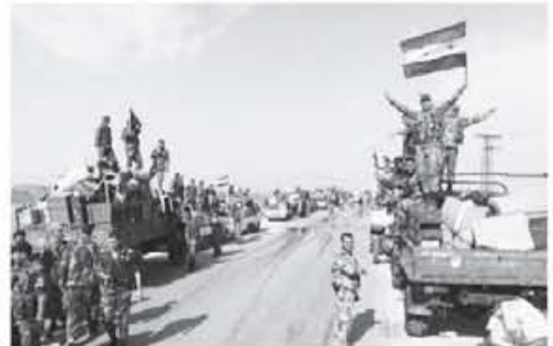
الانطباق - وكالات

سيطر الجيش السوري على مدينة معرة النعمان كبرى مدن ريف حلب الجنوبي، بعد محاصرتها ثانياً وقطع المعبر من طرقات الامداد للمسلحين. وقال مراسلون صحفيون أن الجيش يقوم حالياً بتشبيك المدينة الاستراتيجية بعد تحريرها من المسلحين، وترافق ذلك مع ورود الأباء عن إخلاء جبهة النصرة الارهابية مواقعها في "حي الراشدين" جنوب غرب حلب. مصدر عسكري محلي أكد ذلك بقوله، بأن الجيش تمكن بشكل كامل من إحكام السيطرة على معرة النعمان، المحل الأكبر للمسلحين جنوب، منطقة إدلب، وأوضح أن القوات السورية أحزرت لتداعياً ميدانياً كبيراً جنوب منطقة إدلب خلفت التصعيد، حيث فرضت سيطرتها بالكامل على كل من معرة النعمان وادي الشرف. ويأتي هذا التحول بعد أن سيطر الجيش على قرية كبروما، في ريف إدلب الجنوبي.