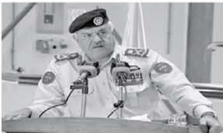
الإنباط - عمان

وجهه رئيس هيئة الأركان المشتركة الكونادر الطبية إلى الاستعداد ورفع الجاهزية لاستقبال أي حالة مشتبها بها من مرضى كورونا، والتأكد من إجراءات التماسية في حال ظهور أي حالة، وأجراء كافة الضوابط الحجرية والتباعدية، وتخصيص أقسام عزل للتعامل مع هذا المرض، مؤكداً أن الخدمات الطبية هي مؤسسة طبية وطنية تقدم خدماتها لجميع المواطنين العسكريين والمدنيين، وبه نهاية الزيارة، التحديت والتطوير بما يتناسب مع الزيادة في أعداد المراجعين والمرضى وأوقات التقدم في الحالات العظيمة.