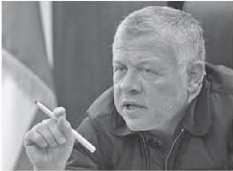
الإنباط - وادي عربة

أكد جلالته الملك عبدالله الثاني أهمية أن يكون هذا العام عاماً مع أبناء وادي عربة أولاً، وأن يفتح الاستثمارات التي ستساهم في المنطقة وتعود بالفائدة عليهم بشكل مباشر، جاء ذلك خلال اجتماع جلالته مع رؤساء وأعضاء شركة تطوير وادي عربة، وممثلين عن المجتمع المحلي في المنطقة، من أجل التطلع إلى تطوير جولة جلالته في الجنوب، وشدد جلالته الملك خلال اللقاء على أهمية وضع خطة شمولية للجنوب، بالتنسيق مع القطاع الخاص، وفق خارطة طريق واضحة، وأشار جلالته إلى أهمية تطوير قدرات شباب التكنولوجيا الحديثة، لتكونوا جاهزين وقادرين على الاستفادة من الاستثمارات التي ستقام في المنطقة.