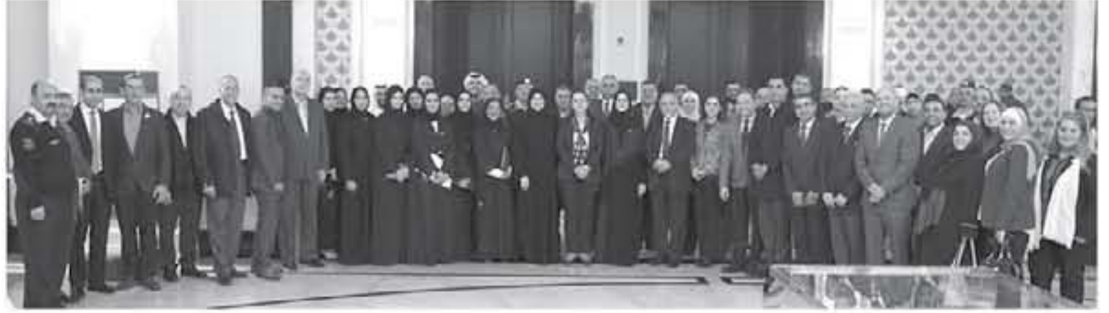
دبي - الأنباط

عقدت فرق العمل المشتركة من حكومتى دولة الإمارات العربية المتحدة والمملكة الأردنية الهاشمية ورش عمل متخصصة حول التجربة الإماراتية الرائدة في مجال تطوير التسرعات الحكومية لتلك هذه التجربة الرائدة في العمل الحكومي تطبقها في الأردن.