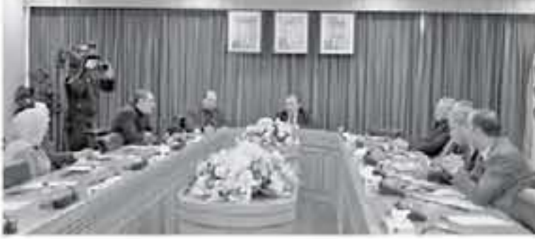
الإنباط - عمان

استمعت اللجنة الإدارية في مجلس الأعيان برئاسة العبد من الماسكات امس الثلاثاء لعرض قدمه طلب، كاتبة أصحاب شركات التوظيف، الأردنية الدكتور طرود الجليلي من واقع اللجنة وبرامجها ومبادراتها والتحديات التي تواجهها، وتضمن المسكات خلال الاجتماع الذي جرى بدار مجلس الأعيان الدور المهم للتفاهة من خلال ما أبدته من جهود في التخفيف من أعباء البطالة وتدوير الكفاءات ورفع المردود سواء داخل الأردن وخارجه في ظل الظروف الصعبة التي يمر بها المملكة العامة والشراكة الحقيقية والتنمية الفاعل بين الجهات المعنية، والقامات ضرورة لتقديم التفاتية لالقرارات