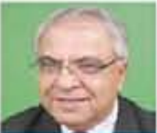
جلالة الملك في الهيدان (I)