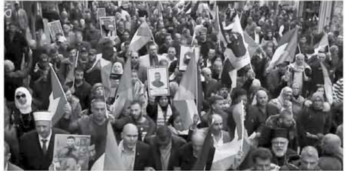
الانطباق - وكالات

والفصائل الوطنية الفلسطينية، وراسية خسارات مواجهة العدوان الأمريكي والإسرائيلي على شعبنا. وأوضح أن "شعبنا بمقاومته وصموده قاسم على أحياء جميع المقامات الرامية لتصفية القضية، ويجب أن يشتبك شعبنا مع العدو في جميع نقاط النضال، لنطمح للاحتلال بأن شعبنا لن يهرع للصفقة، ولن نستطيع أي قوة على الأرض تسريبها. وأكد إن "إخوانكم الأسرى محكم وخلفكم، في هذه الحركة، معركة الدفاع عن حقوقنا ولوائبتنا". وهاتف هنية عباس، وأكد على موقف حماس برفض صفقة القرن، مشدداً "أننا جميعاً في خندق مشترك للحفاظ على قضيتنا الفلسطينية وحقوقنا الكاملة في القدس والأقصى والدولة". وأكد أهمية الوحدة الوطنية وجهزية الحركة للشعب الفلسطيني سياسياً وحيادياً في إطار نضالنا الشعبي لقطع الطريق على هذه التوجهات الأمريكية الإسرائيلية.