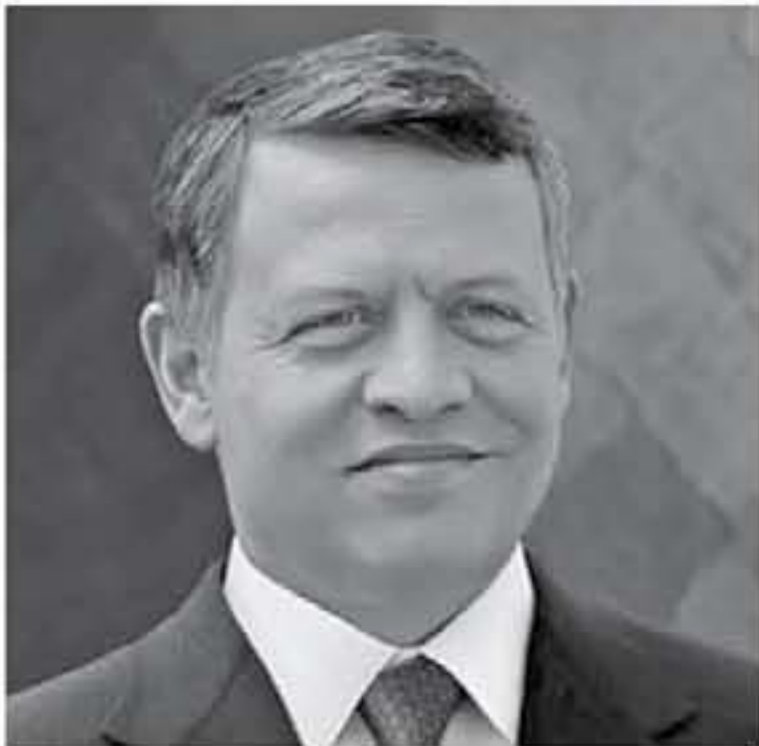
الإنباط - عمان

أعرب جلالة الملك عبدالله الثاني وأسرته، جلالتهم في البرقية، باسمه ودائم شعبنا المملكة الأردنية الهاشمية وحكومته عن تهنئته سمو أمير دولة الكويت بدوام الصحة والعافية، وللشعب الكويتي الشقيق تحقيق المزيد من التقدم والازدهار في ظل قيادته الحكيمه.