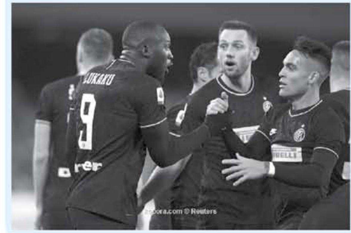
روما - وكالات

أعلن القاضي الرياضي الإيطالي، المعنوية الموقعة على نجم إنتر ميلان، عقب واقعة طرده خلال لقاء فريقه أمام كالياري، بالجولة 21 من الدوري الإيطالي، وشهدت الدقيقة 94 من مباراة إنتر وكالياري، حالة طرد للاثوار مارتينيز، عقب حصوله على بطاقة صفراء ثم حمراء بعد حالة الغضب العنيفة التي ظهر عليها اللاعب، وذكرت صحيفة "لاجازيتا ديللو سبورت"، أن القاضي الرياضي أصدر قراره بمعاقبة لاثوار مارتينيز، بالإيقاف مدة مباراتين، بسبب الاحتجاجات العنيفة ضد حكم اللقاء من قبل اللاعب، وبإتتالي، لتأكد غياب لاثوار عن مواجهتي أودينزي وميلان، واختتم بأن توماسو بيري، حارس المرعى الثالث، حصل على عقوبة مماثلة بالإيقاف مدة مباراتين، فيما تم فرض غرامة مالية عليه قدرها 20 ألف يورو.