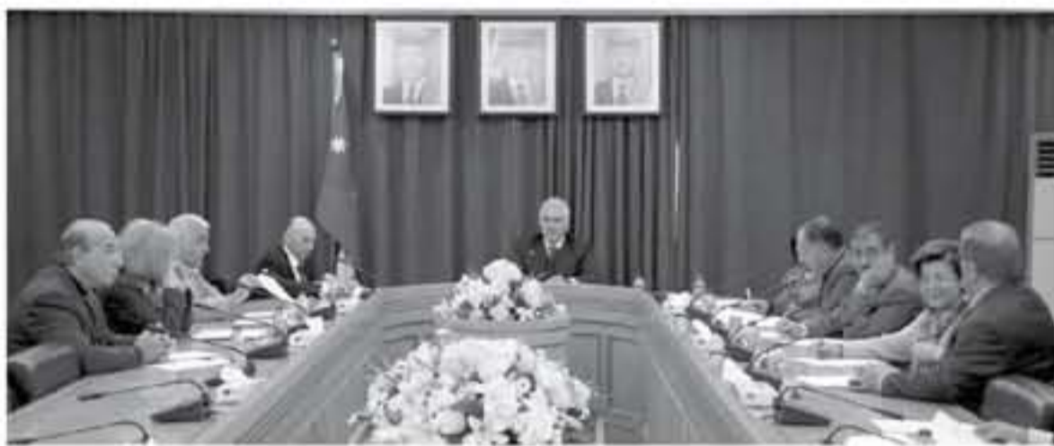
جودة التعليم الطبي الأساسي، وقال العين نويس إن اللجنة قررت في اجتماعها، رفع مجموعة من التوصيات حيال قضايا وصفها بـ "الفصلية" في قطاع