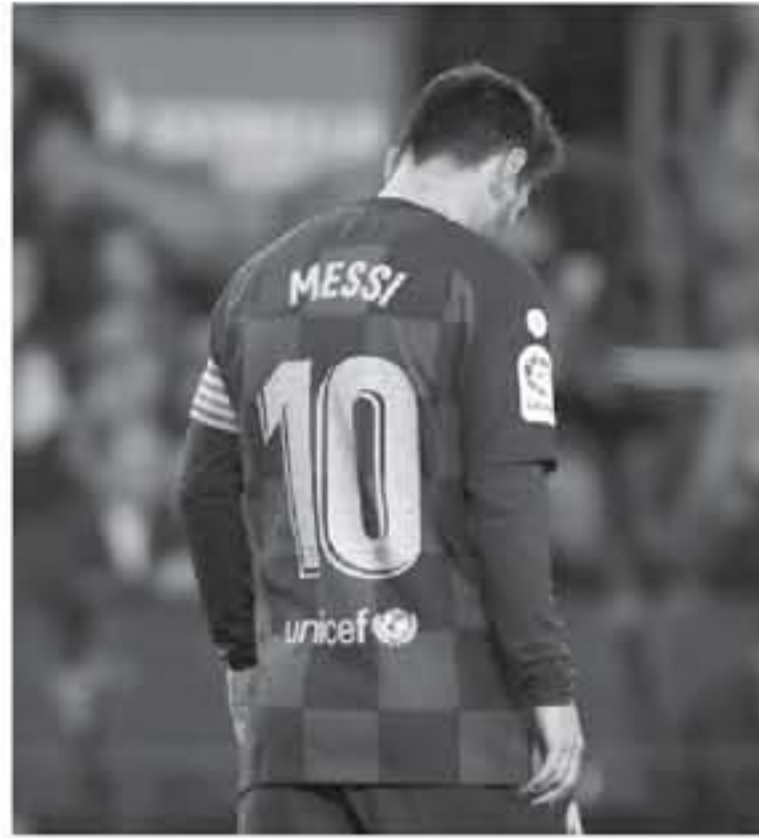
مديرين - وكالات

من طيبة ليجانيس صاحب المركز الأخير في الدوري مشاركة مع النادي الكتالوني الثاني إسبانيول، خصوصا وأنه تغلب عليه في عمر داه 1-2، فكان مباريات الكأس تحفل عادة بالمفاجآت أمام الفرق الكبرى التي تفضل اللعب بالسلامة لإراحة الأساسيين ترفيها للاستحقاقات المهمة أبرزها دوري أبطال أوروبا. كما أن ليجانيس ترحب في إرقام مضيفة ألتيكو مدريد على التعادل المبني الأحد في ختام المرحلة الحادية والعشرين، ويحل ريال مدريد المتصدر الجديد ليفيا ضيفا على ريال سرقسطة رابع الدرجة الثانية لتأكيه، انتصاراته المتتالية في الأونة الأخيرة في مختلف المسابقات والتي رفعا إلى ستة بتغلبه على مضيفة بلد الوليد 1- صفر الأحد في ختام المرحلة الحادية والعشرين من الدوري، والتقى الفريقان للمرة الأخيرة في المرحلة التاسعة والعشرين من الدوري وكانت على ملعب لا روجاريدا وانتهت بالتعادل بهدف لثيكتور رودريغيز (6) مقابل هدف للفرفاني كريستيانو رونالدو (28)، وسقط وقتها سرقسطة إلى الدرجة الثانية ولم يتنجح في العودة إلى الأولى حتى الآن.