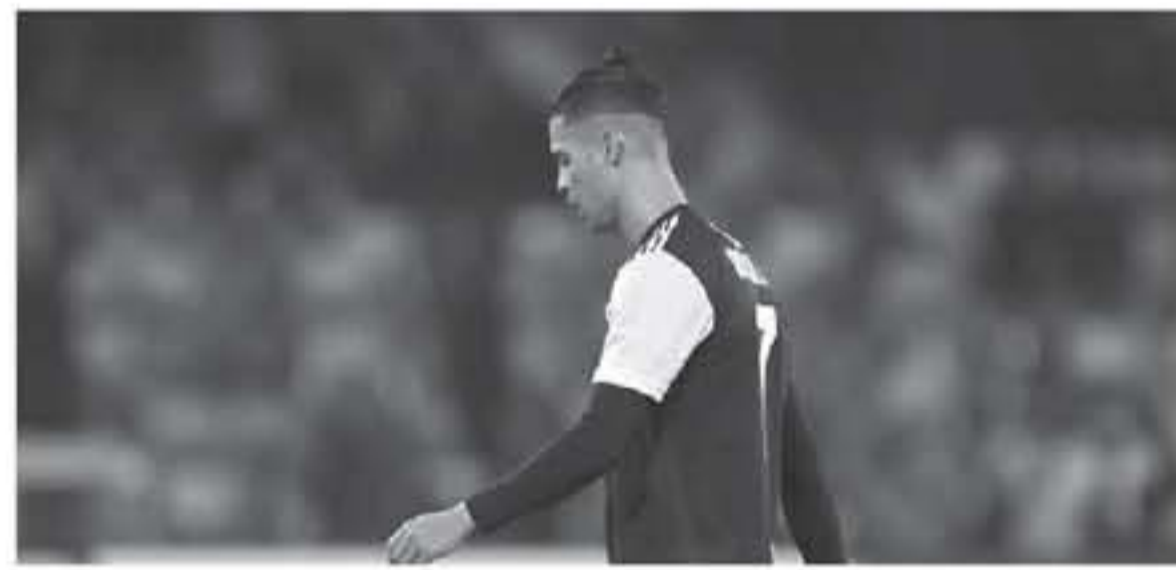
روما - وكالات

فيورنتينا، على ملعب أليانز ستاديوم في تورينو، الأحد، في الجولة 22 من الكالتشيو.