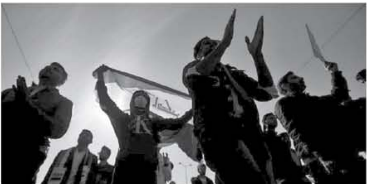
السياسية الشيعية على فوضخ شخصية غير جدلية ولم يعلن عن اسمها حتى الآن. مرتحا بدميلا، بينما أهدأ الفادي في تحالف الفتح نسيم عيالله، بوجود التناق بين القوى

من جهته، دعا رجل الدين الشيعي مقتدى الصدر على "أوبتر" إلى معاهدة شعبية حاشدة في العاصمة للضغط على الساسة لتشكيل الحكومة وفق تعطلات المرجعية والنسب، كما دعا لاصفاصات سلمية حاشدة قرب المنطقة الخضراء بالتنسيق مع القوات الأمنية. وقال الصدر: "لنا خطوط شعبية تصعيدية أخرى، من جانبها، دالت كتنا و٦٦ دولة استخدام القوات الأمنية العراقية وميليشيات المدعومة العنف المفرط ضد المحتجين، مطالبين الحكومة بإجراء تحقيق مفوق في قضية قتل المتظاهرين. وفي سياق آخر، أهدأ مراد "العربية" و"الحدث" بتراجع خطوط محمد توفيق علاوي للتنكف بتشكيل الحكومة التبدل، بسبب خلافات بين الأحزاب السياسية، فيما يجري البحث عن أسماء جديدة للترشح لرئاسة الوزراء، وأهدت مصادر مطلعة