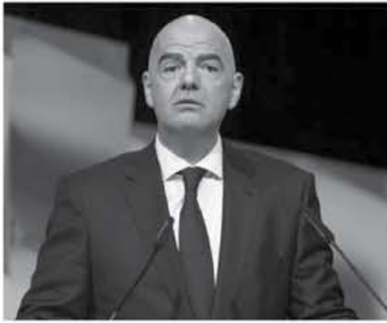
وقال فيليب بيت رئيس اتحاد اللاعبين المحترفين إن اللاعبين "يغامسون في أربابها، واسترسل، "العديد من الأندية عندما تعلق أنديتهم

تعلق أربابها لتجنب دفع أجور متأخرة وتجنباً مرة أخرى باعتزامها أندية جديدة، وأصفا هذه الممارسات بأنها لا أخلاقية، وأبلغ روي فرمير رئيس الإدارة القانونية في اتحاد اللاعبين المحترفين روبرتس بأن هؤلاء اللاعبين، وأغلبهم من أفريقيا وأمريكا الجنوبية، يواجهون صعوبات في العثور على أندية جديدة ويضطرون للعودة مرة أخرى إلى بلادهم، وقال: "أترك اللاعبين من دون أي شيء ويتبعون ما يظنون على أنه جيد، وهذا ليس سهلاً لأن في هذه الحالات لا يكون لاعبين من الطراز الأول، وأكد الفيغا أنه بدأ منذ العام الماضي التصدي لممارسات إنشاء أندية جديدة "هدفها الأساسي تجنب دفع أجور متأخرة للاعبين". وقال جيانج إيفانتيو رئيس الفيغا: "نحن هنا أيضاً من أجل الوصول إلى المحتاجين، خاصة في مجتمع كرة القدم، وهذا يبدأ باللاعبين وهم المعنصر الأساسي في لعبتنا".