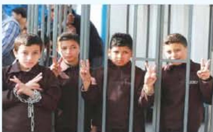
الانباط - رام الله

مرور شهر على نقل الأطفال لـ "الدامون"، أبرز الإجراءات التي نفذتها إدارة السجون بعقوبتهم وظروف احتجازهم. حيث تعرضوا لعقوبات قمع واعتداءات بالخشرب ورش بالمغاز والمزل فور نقلهم، كما واجهوا على مدار الشهر هذه الإجراءات، بحقوقهم، منها إرجاع وجبات الطعام، والإضراب عن الطعام لأيام، ووصف الأسرى الأطفال للشمب بأذنه أشبه بالقبو تحت الأرض لا تدخله أشعة الشمس والمغرب لا تتوفر فيها نوافذ التهوية.