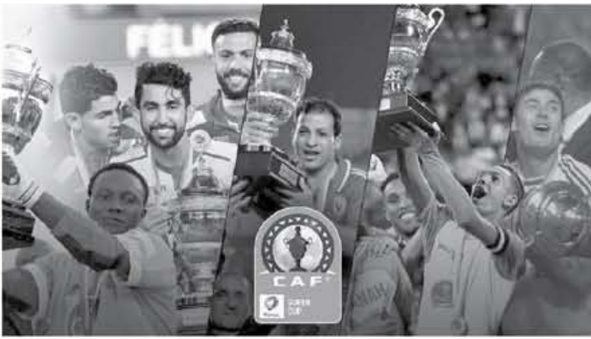
الدوحة - وكالات

تتسبب جماهير الزمالك نفسها بالترويج بكأس السوبر الإفريقي، عندما يلتقي الترجي الرياضي التونسي، لإكمال موسم نجاح لفريق الأبيض. إفريقيا، مع الزمالك بطل الكونفيدرالية، مساء اليوم الجمعة بالعاصمة القطرية الدوحة، في صراع عربي إفريقي شرس على لقب السوبر.