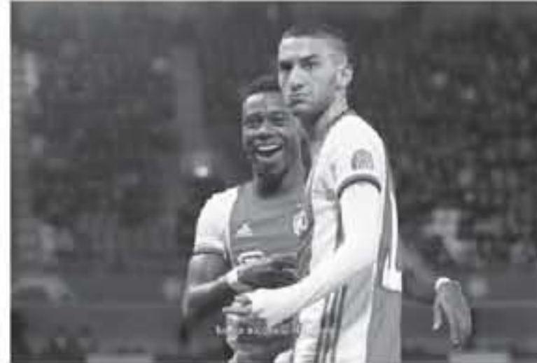
جولندا - وكالات

تعليماته بإجراء الصفقة قبل الصيف، ويمنح الفاتون للأندية إمكانية إجراء الصفقات خارج فترة فتح باب الانتقالات الشتوية في الدوري الإنجليزي، ونوقهها، لكن لا يتم تسجيل اللاعبين في أنديةهم الجديدة حتى فتحها مرة أخرى في فصل الصيف. ويعتبر فريق أياكس واحداً من أكثر الفرق التي تقوم بتطوير المواهب المحلية قبل أن ينتقل اللاعبين في كثير من الأحيان إلى أندية أوروبية أكبر، مثل مانيس دي ليخت الذي انتقل إلى يوفنتوس الإيطالي وفراانكي دي يونغ إلى برشلونة الإسباني.