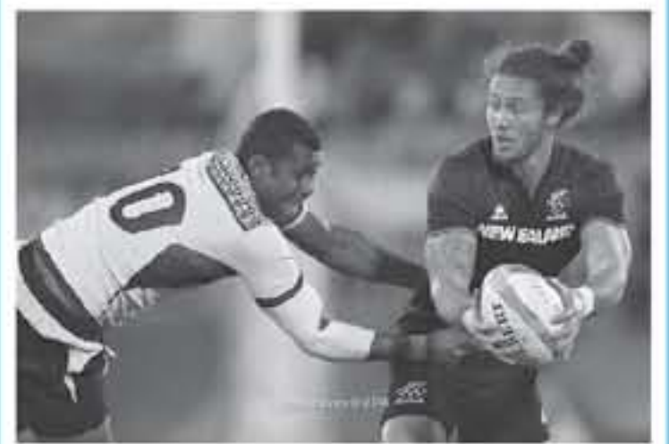
هونج كونج - وكالات

التابعة للمنظمة، وتعد جولة هونج كونج وسنغافور، من نيسان/أبريل المقبل إلى تشرين أول/أكتوبر، بسبب تفشي فيروس كورونا، وذكر الاتحاد الدولي للرجبي في بيان أن "القرار الحكيم اتخذ من أجل المساعدة في حماية مجتمع الرجبي العالمي، والجمهور العام، وتم اعتماد بناء على إرشادات منظمة الصحة العالمية، وإرشادات المنقري، والصحة العامة