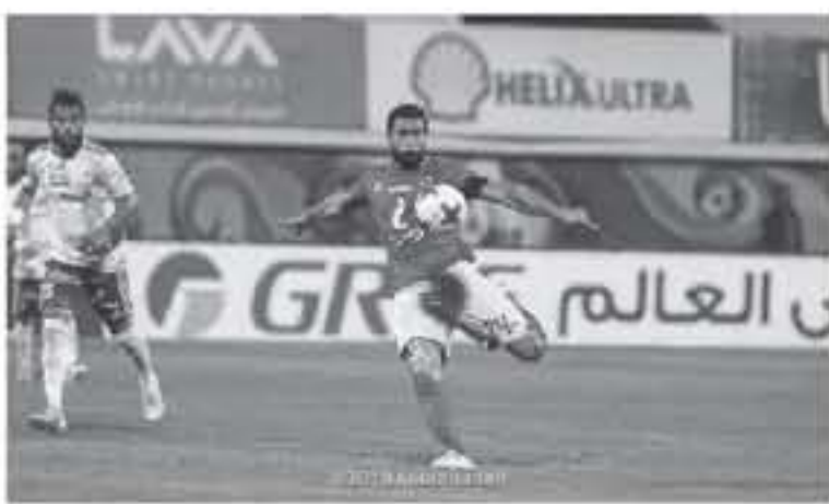
القاهرة - وكالات

يبدل الأهلي موقعه حديداً، في مسيرته بمباريات الدوري الممتاز، عندما يلتقي ضيفه المصري بورسعيد، مساء اليوم الجمعة، في مباراة مؤجلة من الجولة السادسة، على ملعب ستاد حرس الحدود، في المكس بالإسكندرية. ويسمى المارد الأحمر لهواصلة سلسلة انتصاراته الثمانية، مع مسيرة السويسري رينيه فايفر على المستوى المحلي، حيث يحتل صدارة ترتيب الدوري برصيد ٤٢ نقطة خلفها في ١٤ مباراة (العلامة الكاملة).