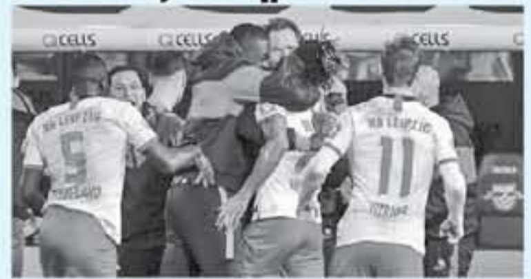
برلين - وكالات

في موقف جيد للغاية في معركة صدارة الترتيب، فدعا أداء محسنا مقارنة بالسيريات الأخيرة. فريد أن تقدم أداء بشكل متعلم في الأسابيع المقبلة. الفوز قد يفلح بلايبزيغ مرة أخرى للعودة للترتيب على الأقل للبقاء واحدة لأن بايرن سيب هزائمه في هذه الجولة أمام كولون يوم غد الأحد. ولم يلم كولون مباراته في الجولة الماضية أمام بوروسيا مونشخلايخ بعد تم إغفالها بسبب حاصفة. ويتساوى كولون في هذه التفاض مع هيرتا برلين ولدى كل منهما 22 نقطة، وذلك بعد أن حققه الانتصارات من آخر 6 مباريات، وأصبح ميونخ مستعدا في تحديه للنافسة على اللقب حيث قال المدرب هازر هيلاند، "لقد كنا هناك 13 جولة متتالية، ملال الطريق طويلا للتلوي للقب الدوري، ولكن هذا ما نريده الجميع سأل مدير الترويج والترويج بنية هيرتا في اليوم السبت بالتالي هوفنهايم مع فولفسبورج وأوجسبورج مع فرايبورج وفورتونا دوسلدورف مع بوروسيا مونشخلايخ ولتتضمن منافسات هذه الجولة يوم غد الأحد بمواجهة ماينز مع كلنا