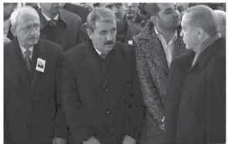
والقضية في 11 فبراير الجاري، بشأن القضية في 11 فبراير الجاري، بحسب محامي أردوغان، عندما قدم زعيم المعارضة التركية "ادعاءات غير

رفع الرئيس التركي، رجب طيب أردوغان، دعوى قضائية على زعيم حزب الشعب الجمهوري المعارض، كمال كليجدار أوغلو، بعد أن تحدث الأخير عن صلة أردوغان بجماعة فتح الله غولن. وأسفدت صحيفة "حرييت" التركية، مساء الخميس، بأن محامي أردوغان حسين أمين مطالب في الدعوى التي رفعها إلى المحكمة المدنية بأنقرة كليجدار أوغلو بتعويض قدره نصف مليون ليرة تركية (82 ألف دولار). وبسبب محامي أردوغان، عندما قدم زعيم المعارضة التركية "ادعاءات غير