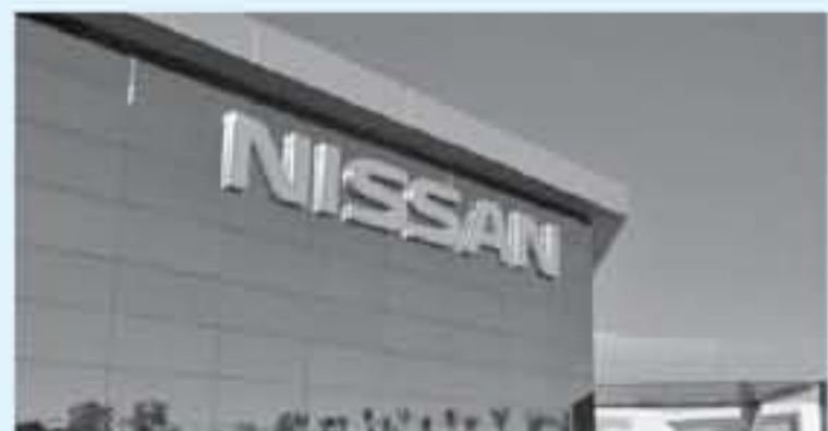
طوكيو - رويترز

وقالت وكالة الطاقة الدولية، إن المراحل الأولى من أزمة نقدي فيروس كورونا أدت إلى انخفاض نسبتته ٧٠ في حركة السفر الجوي العالمية في الصين بينما تراجعت حركة السفر المحلية ٧٥. وقلصت هنا توقعات الوكالة لطلب الصين على وقود الطائرات في الربع الأول بنسبة ١٤ أو ما يعادل ١٢٥ ألف برميل يوميا وتوقعاتها للربع الثاني بنسبة ١٥ أو ما يعادل ١٤٠ ألف برميل يوميا.