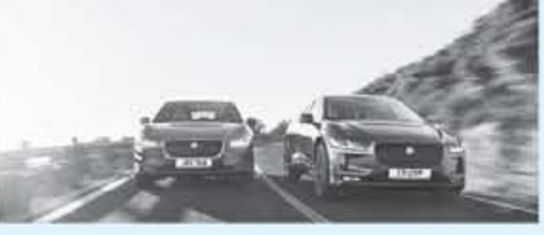
ديي - عرب جي تي

شاحن 50 كيلوات يوفر 280 من الطاقة لتطارية في 85 دقيقة، شاحن 100 كيلوات يوفر 280 من الطاقة لتطارية في 15 دقيقة. تمتلك سيارة جاكوار I-Pace تصميم خارجي أنيق وعمير وليس قائم من عالم الفضاء الذي تشهده سيارات الكهرباء، وهي تعمل لسات مستندة من شفتيتها جاكوار I-Pace و جاكوار E-Pace، ويشكل الألومنيوم نسبة 19% من هيكل السيارة. الأبعاد الخارجية لأول سيارة كهربائية من جاكوار، طول السيارة 4,762 ملم، عرض السيارة 2,119 ملم، ارتفاع السيارة 1,656 ملم. وزن السيارة بدون احتساب التوائل 2,123 كيلوغرام. كانت هذه معلومات رسمية لكشف عن سعر سيارة I-Pace موديل 2020 لدى وكيل سيارات جاكوار في الأردن، مع العلم أن هذه السيارة الكهربائية صدرت على عدة كبر من الجوائز العالمية، وهي لنا من التأكيد كل من 1 سلط موديل اكنس، و مرسيدس EQC، و اودي اي ترون.