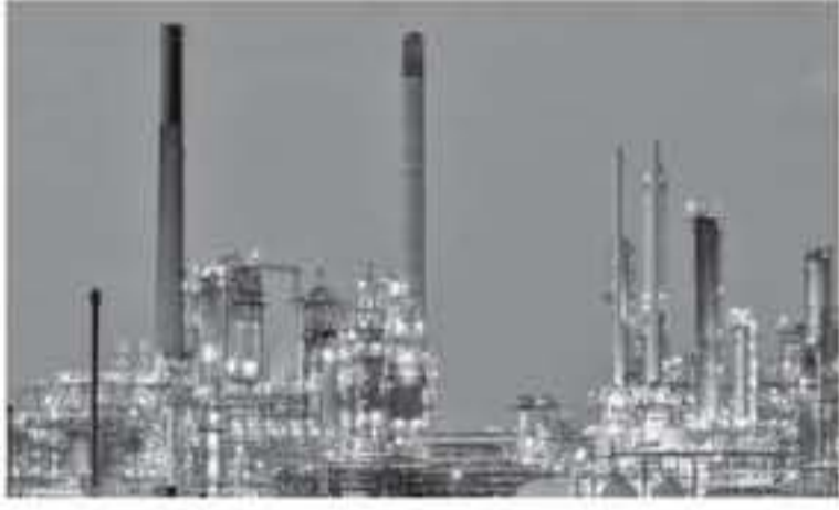
سنغافورة - رويترز

هذا الأسبوع بفضل تلالل بأن أوبك- ستعمل كل ما يلزم محمداً لتقليص الإنتاج وبفضل الأمل في أن دولة فيروس كورونا لتتورب. وهوت أسعار الخام نحو ٢٠ من ذرى سجلتها في ٢٠٢٠ في الثامن من يناير مع انضمام الخوف بشأن فائض العرض إلى الترقب بشأن التخفيضات الكبيرة في طلب الوقود في الصين في الوقت الذي تسببت فيه إجراءات الحجر الصحي في البلاد بتأخيرات انتشار فيروس كورونا في مرحلة النشاط الاقتصادي. وردا على تراجع الطلب، تدرس منظمة البلدان المصدرة للبترول (أوبك) ومنتجون حلفاء، فيما يعرف باسم مجموعة أوبك، خفض الإنتاج بما يصل إلى ٢,٣ مليون برميل يوميا.