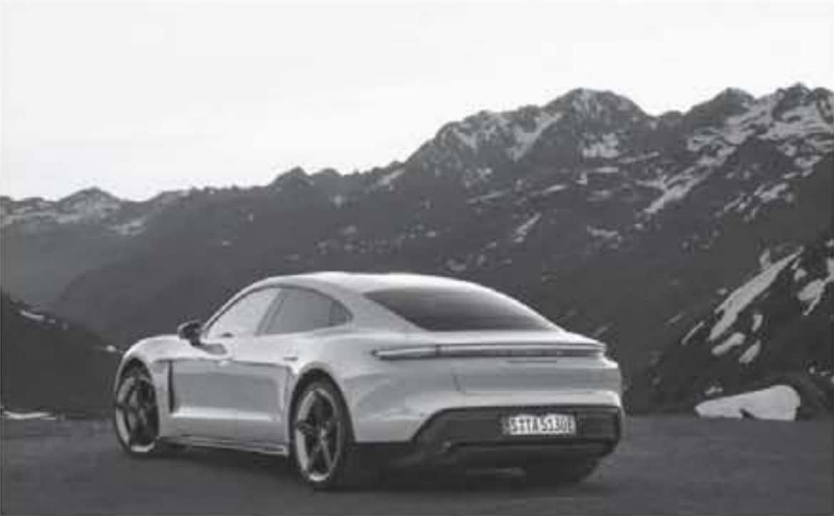
ديي - عرب جي تي

تتارت مع أربعة شواحن توريبتية يولد قوة 1,001 حصان، يتصل مع قير 7 سرعات، لتتسارع السيارة التي يبلغ وزنها 1,888 كيلوغرام وتعمل بنظام دفع كلي للمحركات من 0 إلى 100 كم/س في 2,5 ثانية. يبدأ سعر تايبان 2020 بنسختها القياسية في الأسواق العالمية من 150,900 دولار أمريكي أي ما يعادل 525,850 ريال سعودي، أما سعر بوغاتي فيرون بنسختها القياسية فكان يبدأ من 1,700,000 دولار أمريكي أي ما يعادل 6,275,000 ريال سعودي عندما كانت متوفرة للبيع لدى الشركة الفرنسية.