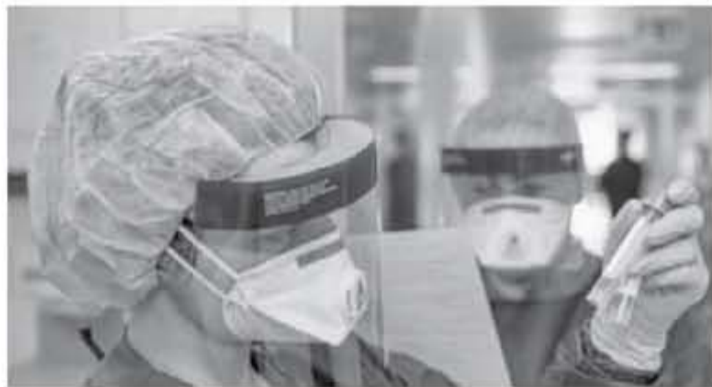
باتت السلطات الصينية تحسب الحالات "المتخصصة" سورييا، وبمعنى آخر، فإن صورة شعاعية لتركتين باتت تعتبر كافية لتشخيص الفيروس، في حين كان لا بد حتى الآن من إجراء فحص الحمض النووي. وقال