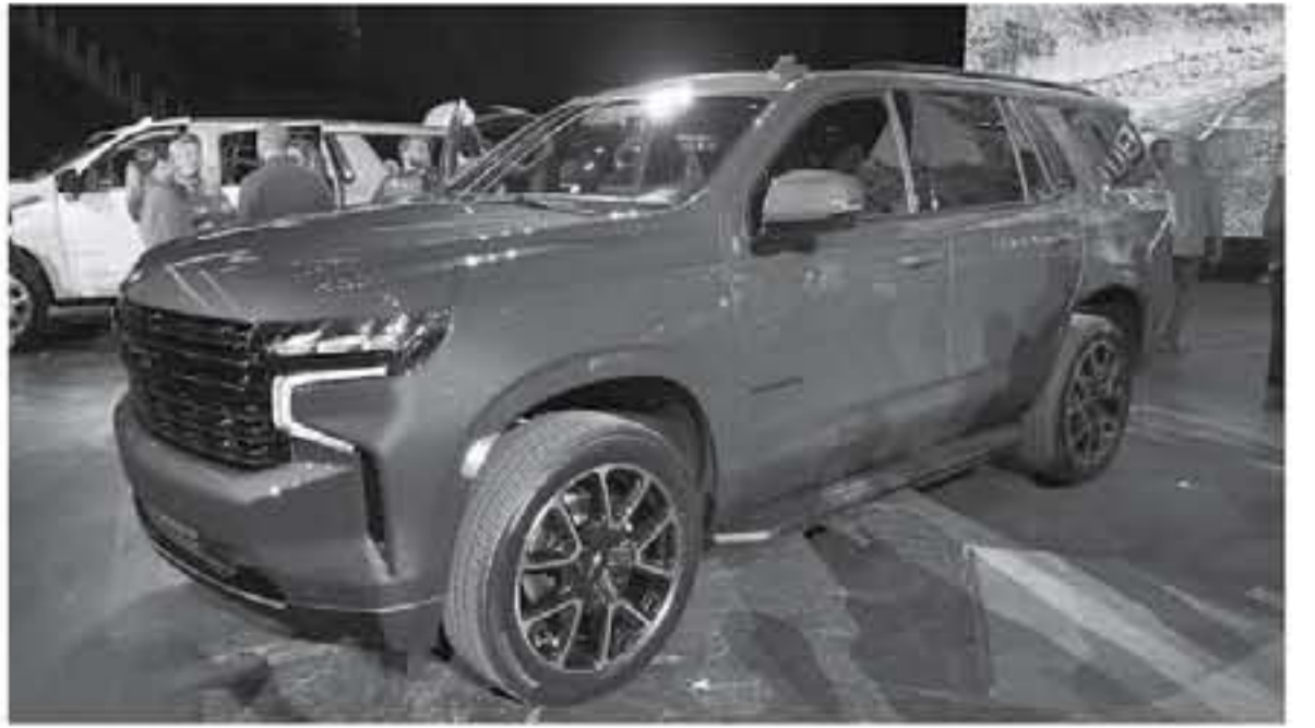
ديي - عرب جي تي

أما سعر سوبران 2021 الجديدة بالكامل، النسخة القوية من طراز شيفروليه تاهو، فسيجرب أن يزيد بمقدار 2,700 دولار أمريكي أي ما يعادل 10,125 ريال سعودي عن سعر تاهو 2021 بنسختها القياسية، ولكن لا توجد تفاصيل رسمية عن ضمن شيفروليه سوبران الجديدة. ومن باب المعرفة سنتوفر سيارة شيفروليه تاهو موديل 2021 الجديدة كلياً بثلاثة خيارات من المحركات، محرك V8 سعة 6.3 لتر بقوة 355 حصان، محرك V8 سعة 6.2 لتر يصد منه قوة 320 حصان، محرك دوراماكس يعمل على الديزل مكون من 6 أسطوانات على شكل خطي سعة 3 لتر يصد منه قوة 277 حصان و 623 نيوتن متر من عزم الدوران.