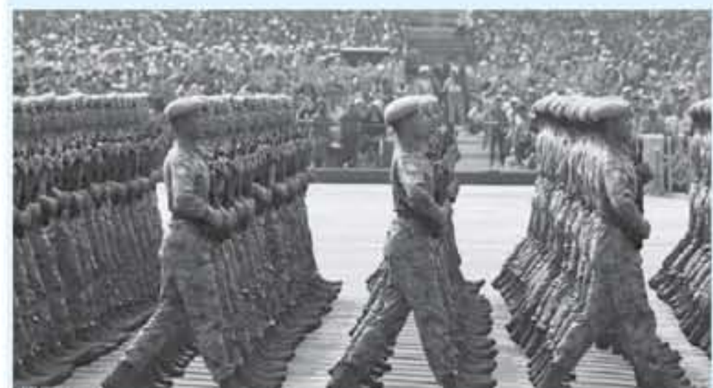
مأمونة - وتوصف بأنها "منبهة" السباق إلى التسليح. وفي هذه الأجواء، تواصل أكبر ميزانيتين صكورتين في العالم معارفاهما التصاعد، وهما الولايات المتحدة (186 مليار دولار) والصين (181 مليار دولار). وقد سجلنا في 2019 ارتفاعا بنسبة 3.6 بالمئة في البلدين عما كانت عليه في 2018.

كشفت التقرير السنوي للمعهد الدولي للدراسات الاستراتيجية أمس أن النفقات العسكرية العالمية ارتفعت بنسبة 4 بالمئة في 2019 في أكبر زيادة تسجل منذ نحو عشر سنوات، وسط تناحر متزايد بين القوى الكبرى والسباق على التكنولوجيات الجديدة. وقال مدير المعهد جون شيبمان عند تقديمه التقرير على هامش مؤتمر الأمن في ميونيخ إن "هذه النفقات ارتفعت مع خروج الاقتصادات من الأزمة المالية (في 2008) وأدراك متزايد للتهديدات". وأوضح التقرير أن موت معاهدة الأسلحة النووية المتوسطة المدى (بين 500 و5000 كلم) في 2019، وامتدنية انتهاء معاهدة ستارت الجديدة حول الأسلحة النووية العابرة للقارات في 2021، يقفان النظام الدولي الذي ساد بعد انتهاء الحرب الباردة. ويشير التقرير كذلك إلى عوامل أخرى تزعزع هذا النظام من صعود الصين وسلسلة من الأزمات الإقليمية من أوكرانيا إلى ليبيا. وكذلك تقدي الأسلحة الجديدة التي طورها الصين وروسيا - صواريخ أسرع من الصوت واليات غواصة غير