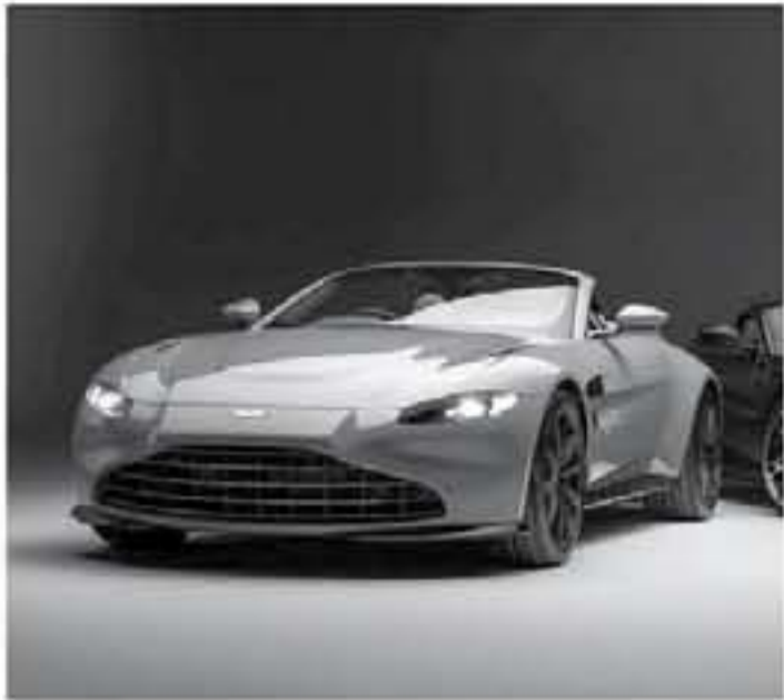
ديي - عرب جي تي

وعلى النحو المتوقع من أي سيارة رياضية متميزة تأتي سيارة استون مارتن 2021 الكشف الجديدة مع وخصيات القيادة "رياضي" و"رياضي بلس" و"حلبة السباق" ليحصل المسائق على تحكم كامل بسلوكيات سيرته وهائلها الديناميكي، وانسجاماً مع هذه الموضوعيات، توفر أنماط ألية توتيد ونقل الحركة، التي تمت الاستعانة بها من تصاميم الكوبه، مزيداً من الاستجابة والتشويق بشكل تدريجي، مما يمكن القدرات الهائلة التي تتمتع بها استون مارتن فانتاج رودستر 2021 من حيث الاستجابة والتشويق سواء في المنزل، على الطريق أو حتى حلبات السباق.