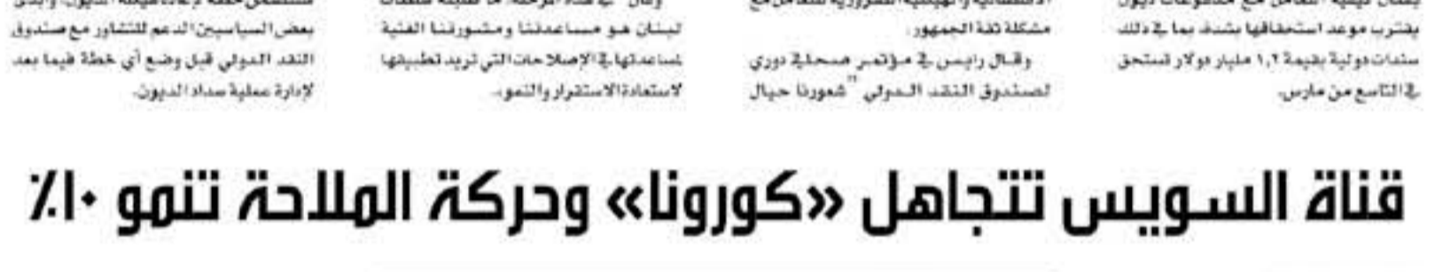
القاهرة - الأنباط

الاتجاهين، مقارنة بنحو ١٤١٦ سفينة خلال نفس الشهر من العام الماضي ٢٠١٩. وكررت أن حجم الحمولات الصافية للسفن القارة ارتفع بنسبة ٤,٨ في المئة لتصل إلى نحو ١٠٥,٧ مليون طن في يناير ٢٠٢٠، مقابل نحو ٩٦,٦ مليون طن خلال الشهر نفسه من العام الماضي، بفارق بلغ نحو ٩,١ مليون طن.