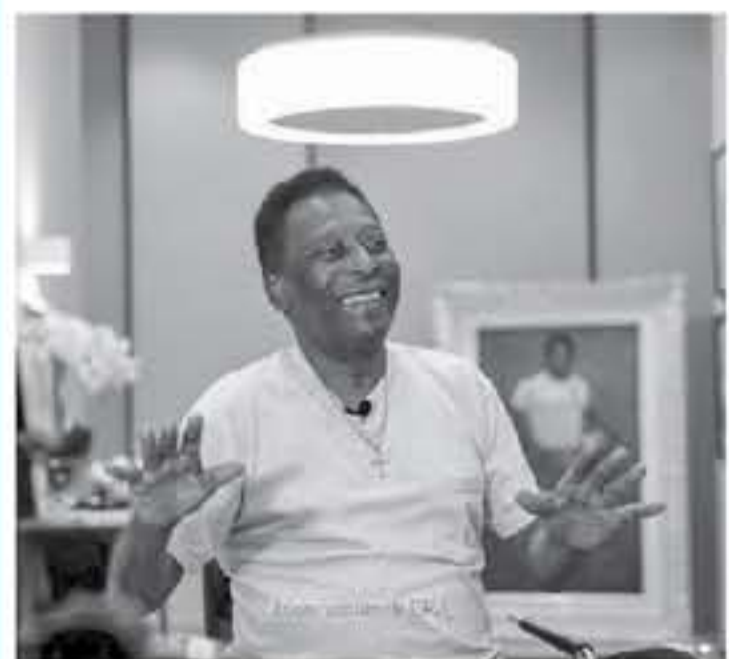
البرازيل - وكالات

مواصلة العمل". وتابع "سنت أرياما جيدة وأخرى سيئة. هذا طبيعي لأن هم في عمري. كنت خائفا، أنا عازم وواقف فيما أعله". وعانى بيايه من مشكلة أعلن الفخذ كمنشوات ولا يستطيع المشي بدون مساعده، وبه الكثير من الفترات التي ظهر فيها مؤخرا في مناسبات ناعمة كان يجلس على كرسي مشررك، وخضع بيايه في وقت سابق لجلسات تصوير وقام بعمل مع رعاة ويتعاون مع مخرج بريطاني لإنتاج فيلم وثائقي عن مسيرته، وقال بيايه في بيان "لا أتجنب الالتزام بمسؤولي المزدحم دائما".