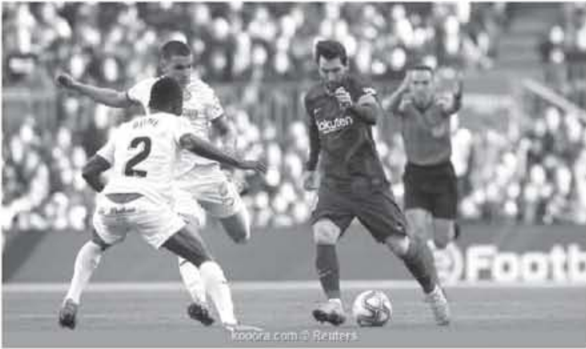
برشلونة - وكالات

تم يسجل النجم الأرجنتيني ليونيل ميسي هدفاً وحيداً في الحصة مباريات بالليجا، تحت قيادة المدرب الجديد لبرشلونة، كيكي ستيين، وكان في شباك غرناطة خلال أول مباراة رسمية للمدرب.