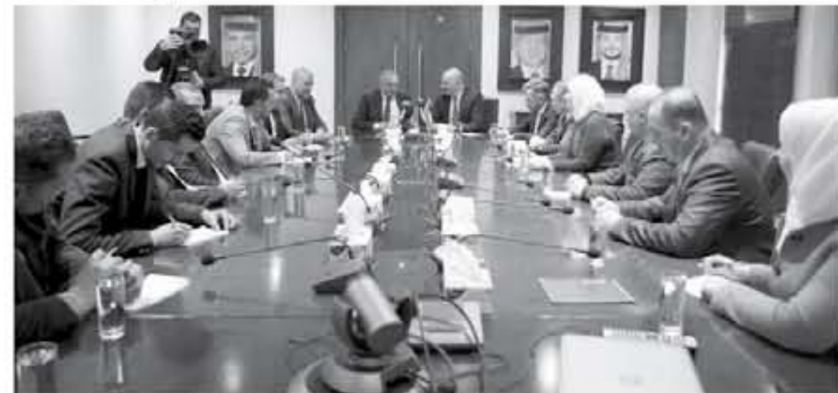
الاتصالات وتكنولوجيا المعلومات الفلسطينية بالخبرات وغيرها من الأمور اللوجستية التي من شأنها أن

ترفع سوية الخدمات المتلفة بالجمارك والبريد وغيرها من اختصاصات الوزارة. كما أكد على أن مذكرة التفاهم هذه تأتي في سياق التحرك الفلسطيني السامي للائتكاف الاقتصادي عن دولة الاحتلال الإسرائيلي في تطل الممارسات الاحتلالية التي كدمت أطنائاً من الطرود البريدية في الجمارك قبل وصولها إلى الأراضي الفلسطينية.