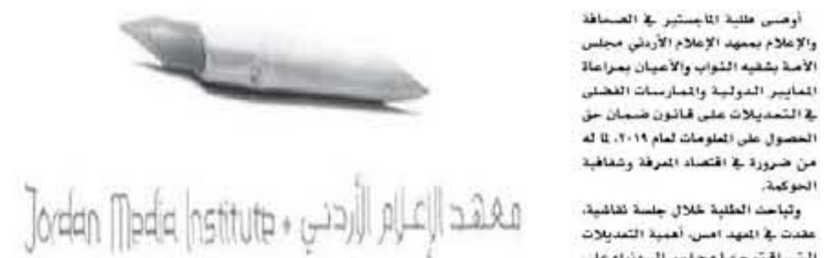
معهد الإعلام الأردني • Jordan Media Institute

إضافة عضوية نشيطي الصحفيين والناشرين وممثلين من مؤسسات المجتمع المدني المختصة، إلا أن المسودة مازالت لتترك المجال للمسؤول بالامتناع عن الرد باعتباره رفضاً، دون أن تعهد ببيان السبب أو الملة لرفض طلب حق الحصول