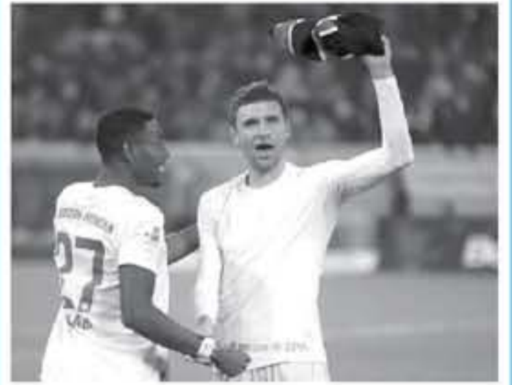
برلين - وكالات

ظهر بايرن لمحدث من ظهوره الأول مع الفريق البافاري تحت قيادة المدرب الهولندي الحظرم اوبس فان جال عام ٢٠١٠. وعن ذلك قال، "لقد أفسد بي فان جال في الله الiard في وقت مبكر للغاية، لكنني ممان اليوم كما فعله، فهو مدرب كان يتحلى بشجاعة بالغة في ذلك الوقت، وفي ختام تصريحاته، أعرب أبا عن أمه في مواصلة حصد الألقاب بقميص بايرن ميونخ، مؤكداً رغبته في أن يتحول حلم التتويج بلقب دوري أبطال أوروبا إلى حقيقة. وسبق للفريق النمساوي الفوز باللقب الأوروبي مع الباييرن في موسم ٢٠١٢-١٣ تحت قيادة المدرب الألماني يوب هاينكس.