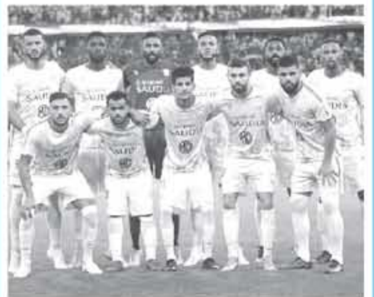
الكويت