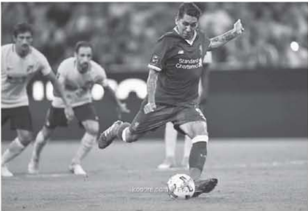
عواصم - وكالات

تستأنف منافسات دوري أبطال أوروبا بعد عودة ليفربول إلى ملعب واندا متروبوليتانو، الذي شهد تنويجه باللقب موسم الماضي، من أجل مواجهة أتليكو مدريد، ضمن منافسات مرحلة الذهاب دور ثمن النهائي، ويحل ليفربول مساء اليوم الثلاثاء ضيفاً على أتليكو مدريد، بينما يستضيف بوروسيا دورتموند، في نفس اليوم باريس سان جيرمان، وساهمت فترة العطلة الشتوية في وجود فاصل جيد بين دور المجموعات والأدوار النهائية في البطولة القارية.