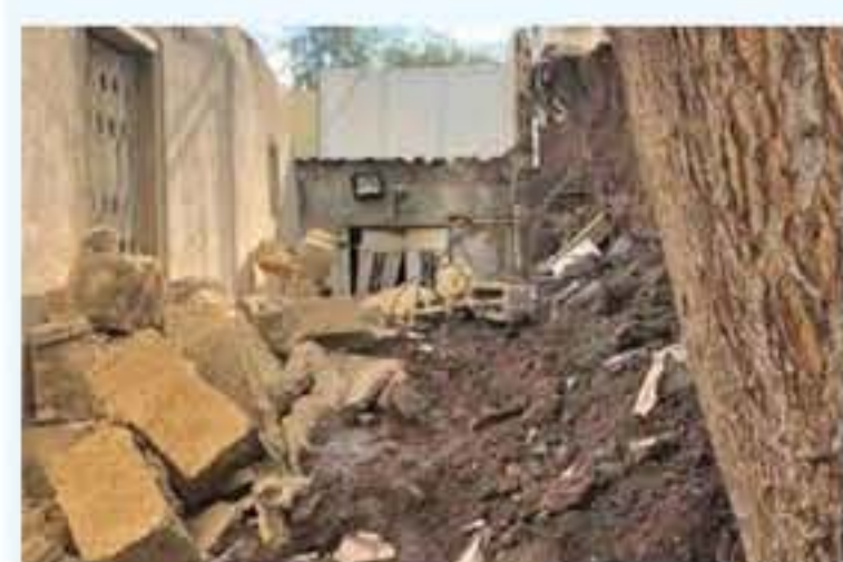
التفاصيل من ٩٠