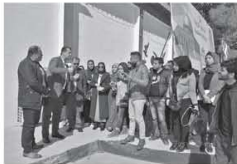
حشد رئيس بلدية المفرق الكبرى عامر تاتيل الدغمي الشباب على تحمل المسؤوليات الجسام المنص على عاتقهم وعلى الرغم من يواجهه الأردن من التحديات...