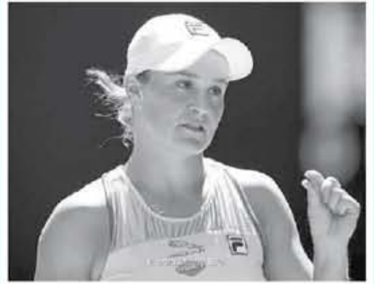
روسيا - وكالات

مباراة أندريسكو إيلينا سفيولينا صوفيا كينج كيني بيرنزل - سيرينا ويليامز نمومي أوساكا، وحافظت الأسترالية أثلني بارتي، على صدارة التصنيف العالمي الصادر صباح أمس الإثنين، والذي شهد العديد من التغييرات في المراكز العشر الأولى، وتراصعت الأوكرانية إيلينا سفيولينا مركزين لتتواجد في التصنيف السادس عالميًا، وفيما يلي المراكز العشر الأولى في التصنيف العالمي، أثلني بارتي سيمونا هاليب كارولينا بايسكوفا إيلينا بيتشيتش