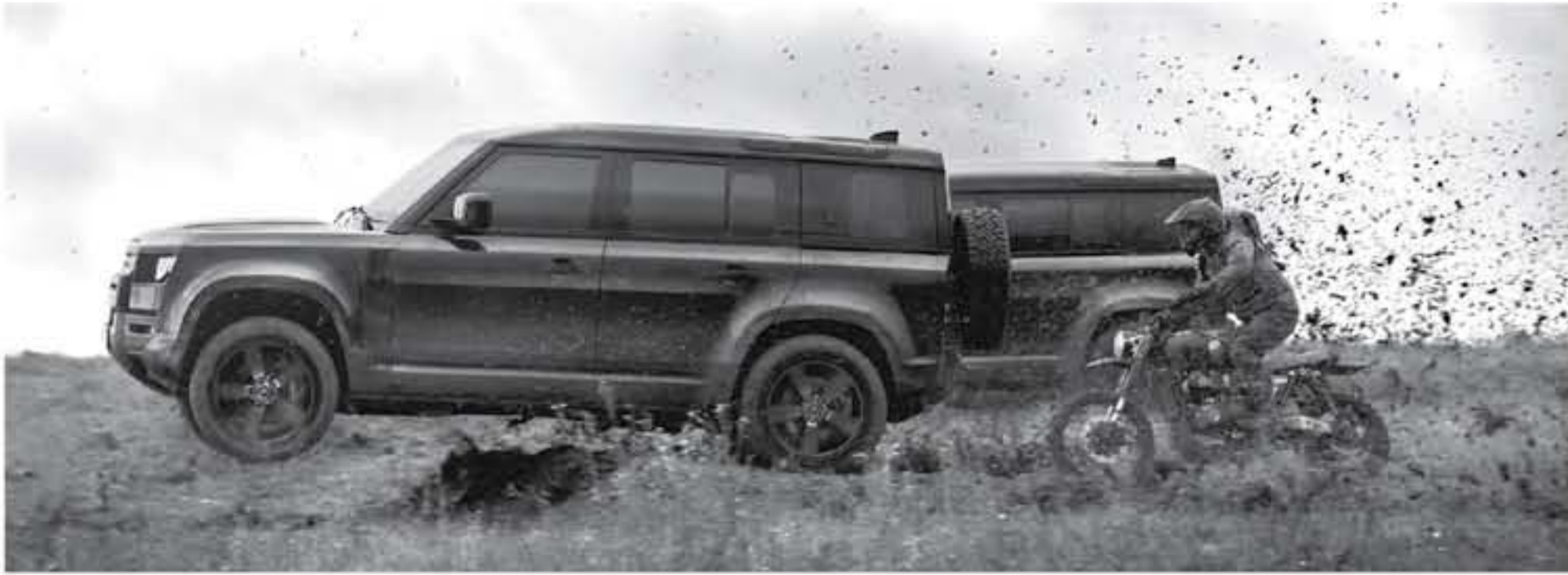
دي - الأنباط

يظهر إعلان لاند روفر التافهوني لسيارة ديفندر الجديدة قدراتها الفائقة على التضاريس القاسية. ويتضمن الإعلان مشهداً حصرياً خلف الكواليس تظهر ما ينتظر المشاهدين من ديفندر الجديدة في فيلم "لا وقت للموت". وتُظهر مشهداً التدرّيبات المستخدمة في الإعلان ديفندر الجديدة وفي تطير في الهواء. وقد خصصت ديفندر للمريد من الاختبارات الصعبة كذلك، حيث سارت بمرغبات قصوى في المستنقعات والأنهار. وقد لي موريسون، منتج المشاهد الخطرة، مشهد المطارات في "لا وقت للموت"، من خلال العمل عن قرب مع أخصائي المؤثرات الخاصة ومشرف سيارات المجازفة الفائز بجائزة الأوسكار كريس كوربول.