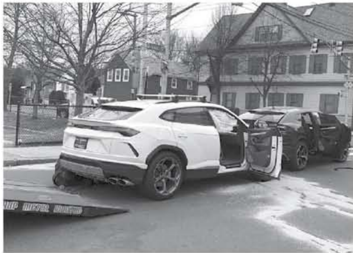
دي - عرب جي تي

ضمن حادثة غريبة من نوعها أقدم أطفال لا يملكون رخص قيادة على سرعة سيارتي لامبورغيني اوروس من الوكالة، قبل أن يحطموها مع بعض على الطريق العامة في أمريكا.