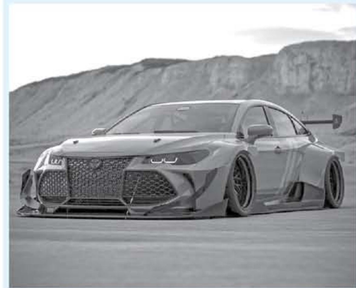
دي - عرب جي تي

تستعرض معكم في هذا الخبر نتيجة تعديل سيارة السيدان كاملة الحجم تويوتا افالون موديل 2020 بشكل رقمي ليصبح شكلها الخارجي مستمد من سيارات رياضية للسباقات 111 مع ارتفاع الطول العائلي على سيارات الكروس أوفر و الـ SUV أصبح عملاقة لتصنيع السيارات مثل هورود وجنرال موتورز يركزون على توفير طرازات جديدة من هذه الفئة على حساب تقليص توفير سيارات السيدان ، ولكن شركة تويوتا مازالت متمسكة بهذه الفئة من السيارات حتى مع توفيرها العديد من طرازات الكروس أوفر ، وهذا ما دفعنا لتقديم كل من ، افالون TRD ، و افالون دفع كلي للعلجات .