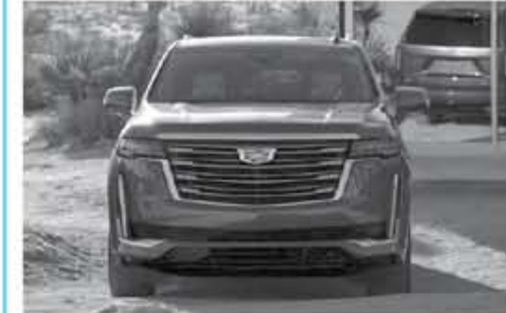
دي - عرب جي تي

سنعرفكم اليوم على أول سيارة كاديلاك اسكاليد كوبيه 2021 ، ويسون أي شك نحن نتحدث عن سيارة معدلة رقمياً لن تكون موجودة على أرض الواقع ، كلما تعلمون يمثل طراز اسكاليد هذه أكبر سيارة SUV تصنعها شركة كاديلاك وقيل الحديث عن هذه الصورة الخيالية