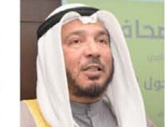
ذكر رئيس الهيئة الخيرية الإسلامية العالمية المستشار الدكتور الأمير الدكتور عبدالعزى العتيق ان مبادرة (إطعام مليار جالس حول العالم) التي نفذتها الهيئة حققت نجاحاً باهراً في توجيه جهود المنظمات الإنسانية الخيرية والإقليمية والعالمية إلى معالجة طائفة الجوع خلال عام ٢٠١٩.

وأضاف ان دولة الكويت استضافت العديد من المؤتمرات الدولية والإقليمية من أجل دعم الأوضاع الإنسانية وإعانة الإعمار في بعض الدول النشيطة والصاعدة مثل سوريا والعراق فيما ستستضيف قريباً