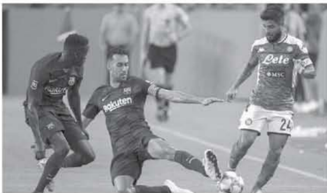
مدريند - وكالات

كشفت تقرير صحفي إسباني، أمس الأحد، عن مصير مباراة برشلونة ونابولي في ذات لثم هطلي دوري أبطال أوروبا، وأشهر لها الثلاثة الفيل وكان الاتحاد الإسباني أعلن تأجيل أكثر من مباراة في الكالتنيو، بسبب زيادة عدد الإصابات والوفيات بفيروس كورونا. ووفقا لصحيفة «موندو ديپورتيفو» الإسبانية، فإن المباراة غير معرشة لتأجيل، ولكن سيتم فرض ضوابط صارمة أثناء إقامةها. وأشارت إلى أن جميع أفراد هيئة برشلونة سيخضعون لبروتوكول صحي لتأكد من عدم ارتفاع درجة حرارة أي فرد عند الوصول إلى مطار نابولي. وأوضحت أن هذه الضوابط وضعتها وزارة الصحة الإيطالية لكل الزوار، لمكافحة فيروس كورونا، ولن يتم منح أي استثناء للاعبين برشلونة أو المديرين التقنيين أو الجماهير. وقالت «موندو ديپورتيفو» إن الهدوء سيطر على نادي برشلونة بشأن احتمالية التأجيل، حيث إن اليرسا لم تلحق أي أضرار من الاتحاد الأوروبي أو الإيطالي حول ذلك.