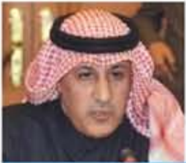
سمو الرؤية وجلالة المواقف

بقلم / عزيز الديحاني سفير دولة الكويت لدى المملكة الأردنية الهاشمية