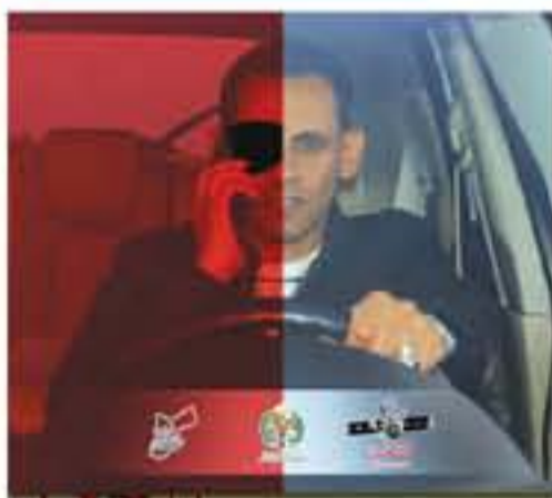
قيادة المركبة بسرعة 100كم بالساعة لمدة 10دقائق أثناء الفعاليات بالعالم النرويج لتسابق قيادة 44 من معسوب المينيل