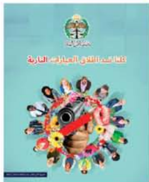
تفاقم الفلج الجراثيم النارية