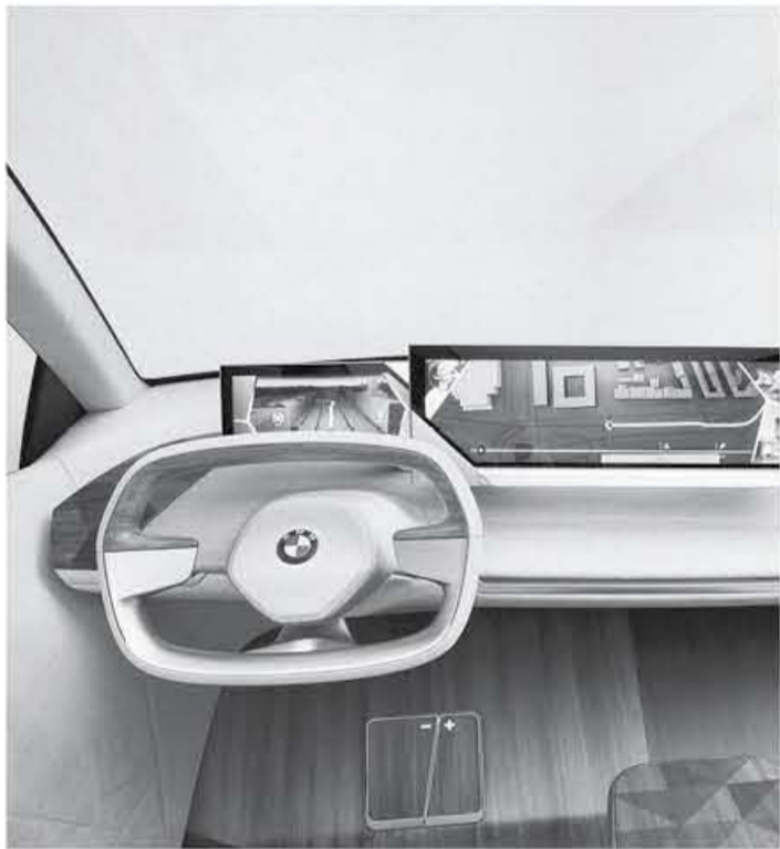
دبي - عرب جي تي

السيارة الإنتاجية سيكون شبيه للغاية من هذا الطراز الاختبارية.