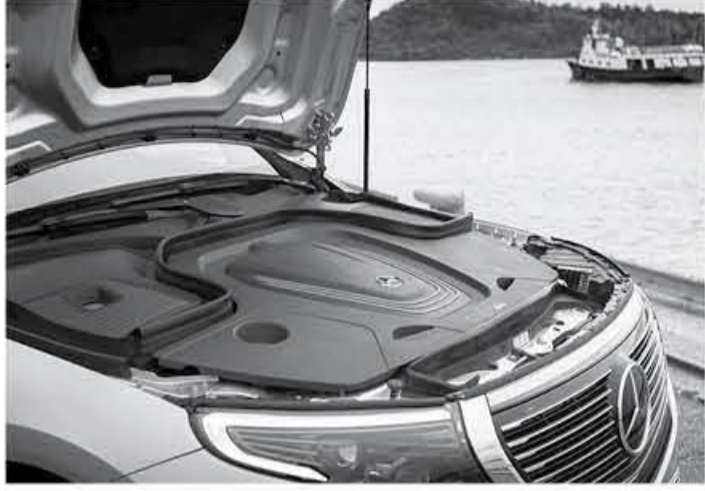
دبي - عرب جي تي

لا بأس به من وجهة سيارة EQA موديل 2021 الجديدة التي ستتمثل فئة سيارة كروس أوفر كهربائية أصغر حجماً من EQC الحالية، ومن المفترض أن تعتمد سيارة مرسيدس الكهربائية هذه على شاسي شاسي MFA II الذي ستمتد عليه أيضاً سيارة GLA موديل 2021، ونرجح أن تصميم هذه السيارة سيستمد الكثير من شكل مرسيدس EQC 2020، مع حصولها على لمسات مستمدة من نسختها الاختبارية التي ظهرت في معرض فراكفورت للسيارات عام 2017.