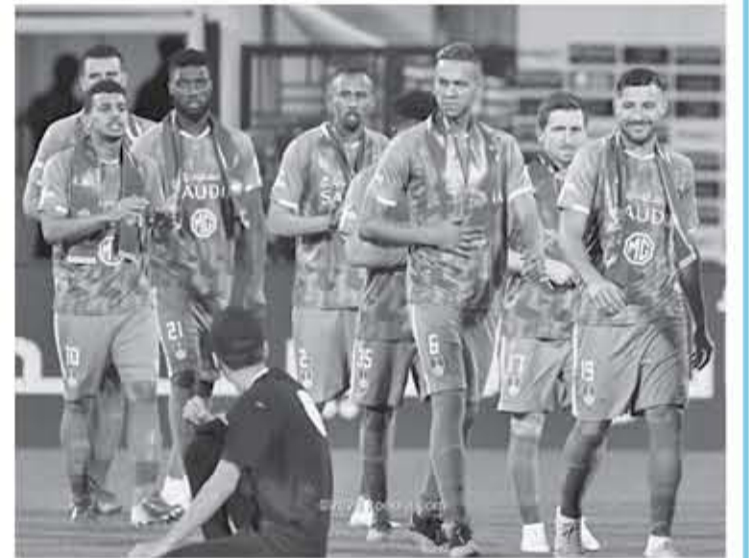
ماليزيا - وكالات

سلسلة إجراءاته الاحترازية، بسبب انتشار فيروس كورونا، في عدة دول من القارة على رأسها الصين وإيران. وتواجه البطولة القارية للأندية مستقبلًا غامضًا، حيث أعلن الاتحاد الآسيوي أنه بصدد عقد اجتماع طارئ الأسبوع المقبل في العاصمة الماليزية كوالالمبور، لبحث مصير المسابقة. كما سيتطرق الاجتماع إلى مناقشة ملف التصفيات الآسيوية المزدوجة المؤهلة لكأس العالم 2022 وكأس آسيا 2023، والمقرر أن تستأنف خلال شهر آذار/مارس المقبل.