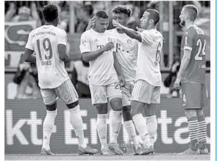
برلين - وكالات

ناحية، يتطلع لايبزغ لتحقيق فوزه الثالث على التوالي في المسابقة، حينما يستضيف باير ليفركوزن، صاحب المركز الخامس، الذي يمتلك سبعة انتصارات خارج ملعبه في البطولة هذا الموسم. ويواجه بوروسيا دورتموند، الذي يحتل المركز الثالث بفارق 4 نقاط خلف الصدارة، ضيفه فرايبورج غد، فيما يلتقي بوروسيا مونشنجلادباخ مع ضيفه بادربورن متذيل الترتيب، وكولن مع ضيفه شالكه غد أيضاً. ويطمح فيرير بريمن الذي يتواجد في المركز قبل الأخير، لوضع حد لمسلسلهزائمته الذي استمر في مبارياته الخمس الأخيرة بالبطولة، عندما يلتقي مع أينتراخت فرانكفورت.