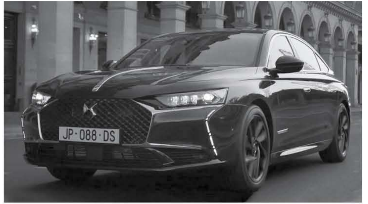
دبي - عرب جي تي

عندما نتحدث عن فخامة سيارات السيدان التي تباع في الأسواق يأتي ذكر قصور رولز رويس الانجليزية المتحركة في أعلى مراحل الترف، ولكننا اليوم سنمركم على DS9 الجديدة أفخم سيارة سيدان فرنسية الصنع.