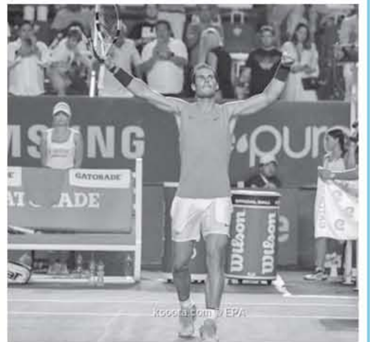
المكسيك - وكالات

ديميتروف، وصعد ديميتروف لنصف النهائي بعدما أطاح بالسويسري ستان فافرينكا بنتيجة 4-6 و 4-6. أما مباراة نصف النهائي الأخرى، ستجمع بين الأمريكيين تايلور فريتز وجون إيسنر. وحصل فريتز على بطاقة تأهله للمرعب الذهبي على حساب البريطاني كابل إدموند الذي سقط بنتيجة 4-6 و 6-3. أما إيسنر فقد لنصف النهائي بعدما تمكن من إقصاء مواطنه تومي بول بواقع 6-7 (3-7) و 6-3 و 2-6.