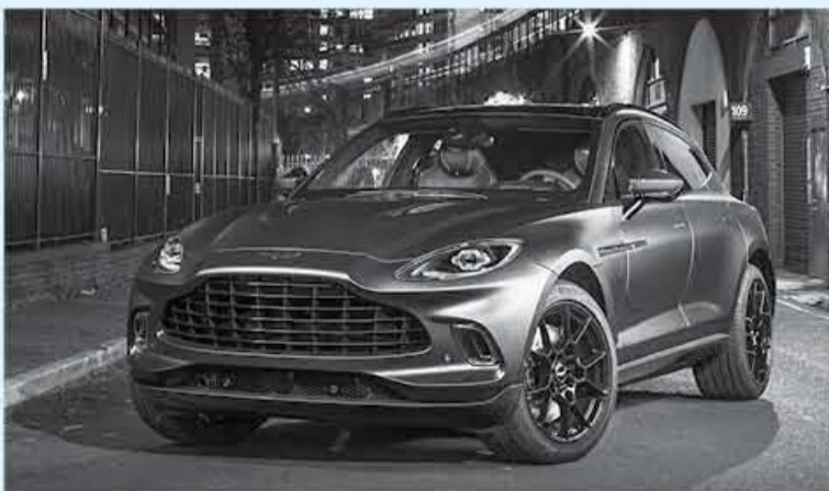
دبي - الأنباط