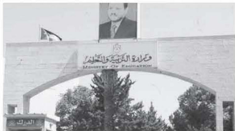
التربية والتعليم وسيبرها بالشكل اللائق.