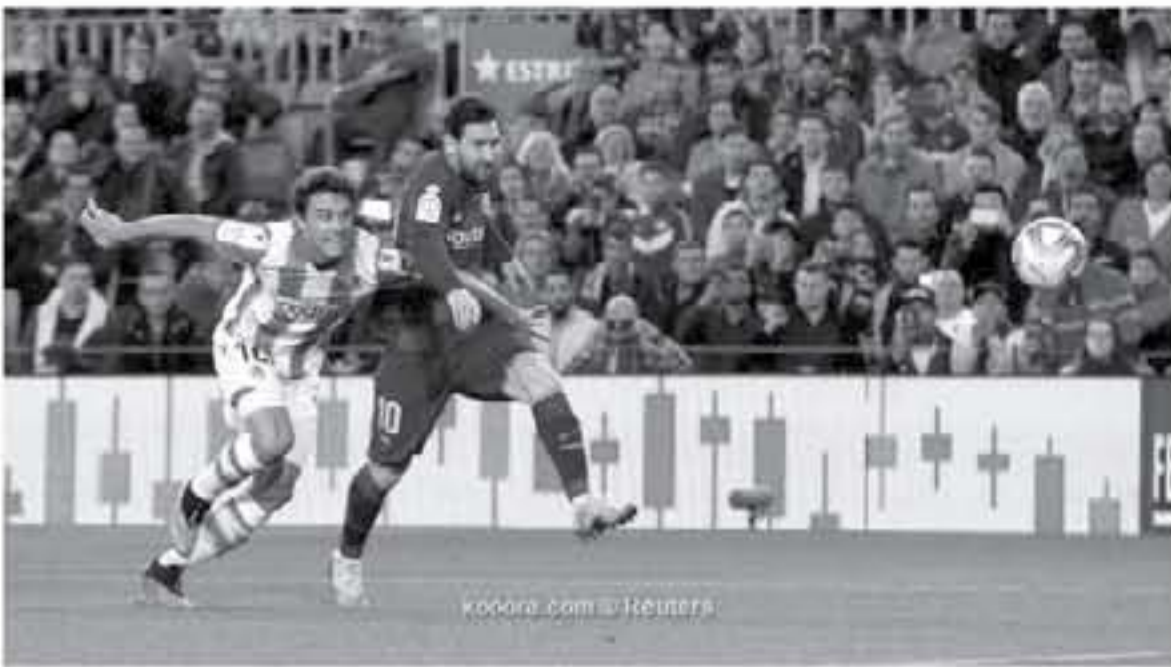
برشلونة - وكالات

لم يتمكن ريال سوسبيداد من طرد شذوته أمام برشلونة على ملعب "كامب نو" بعدما تعرض السبوت للهزيمة 2:1. ثانياً في معقل البرتلوجيرانا، في خسارة جاءت بتوقيع النجم الأرجنتيني ليونيل ميسي صاحب هدف اللقطة الوحيدة، وأسوأ كوابيس الفريق الإسباني الذي اهتزت شدائمه 16 مرة عبر "البرتلونا".