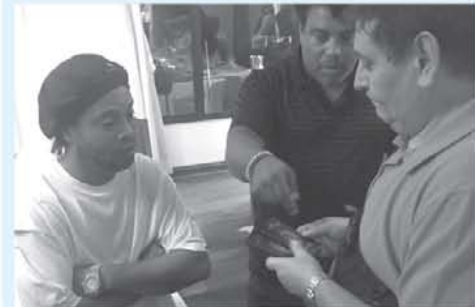
باراجواي - وكالات

كشف تقرير صحفي بريطاني، عن المدة المتوقعة لاحتجاز رونالدينيو، نجم برشلونة وميلان السابق، وانتقل رونالدينيو، يوم الجمعة الماضي، لمحاولة دخول باراجواي سفر مزيف، وقضى اللاعب يومين في المعتقل مع شقيقه ومدير أعماله روبرتو أسيس، ووفقاً لصحيفة "ديبورو"، البريقانية، فإن مدة احتجاز رونالدينيو قد تصل إلى 6 أشهر، بسبب استمرار التحقيق في استخدامه لجواز سفر مزيف، وأخبارت الصحيفة إلى أنه لا يوجد ضمان بأنه سيخرج من رونالدينيو بعدالة خلال الأيام المقبلة، حتى يتم التخلي قرار بشأن محاكمته، وأوضحت أنه حتى لو تم إطلاق سراح رونالدينيو، ستأمره السلطات بالبقاء في باراجواي حتى انتهاء التحقيقات، والتي التقيدت دعوة للفرار إلى باراجواي من مالديف، الكلاهي الثانية ووصلا يوم الأربعاء، للمشاركة في مشروع كروي للأبطال والاملاق كندا، والذي رونالدينيو (29 عاماً)، لاعب جرميو وفلامنجو وباريس سان جيرمان السابق، مسيرة الاحترافية في 2016، وكان أفضل لاعب في العالم في أوج مسيرته في بداية القرن الحالي،