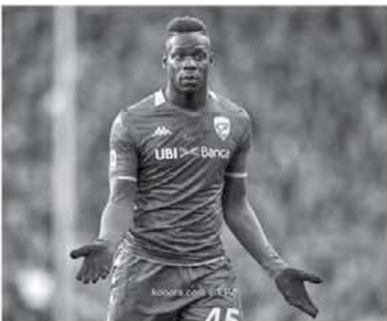
روما - وكالات

بسبب هذا الفيروس الملعون، لأنهم لا يعيشون في لومبارديا، وهذا يشير للفريق والحزن بالشئسة لي. وأكمل، "بالوتيلي لا أريد أبداً في نقل كوروننا إلى والنشي التي أراها كل يوم، وأتأمل معها الطعام، إنها أكبر متني سناً، ويقدّر ما أحب كرة القدم لا أريد اللعب ولا أريد المجازفة بها، وأتمنى، "بالوتيلي" للفرقة عن شخص آخر؟ أو لشخص من خسارة المال؟ لا تعجز، أحصل على المال بنفسك، لدينا ما يكفي الآن. لا مزاج مع المسجدة، يذكر أن كل المباريات في إيطاليا تقام بدون جمهور حتى يوم 3 أبريل/ نيسان المقبل، كما أن العديد من التنازير أكدت أن البطولة ستلغى مع ظهور أول حالة إصابة بين اللاعبين بفروس كورونا في فرق الدرجة الأولى.