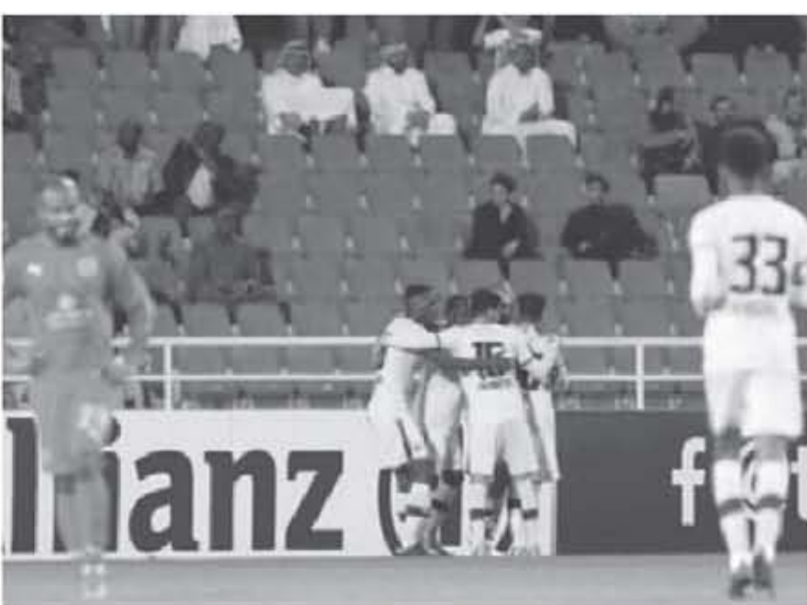
نبي - وكالات

قرر الاتحاد الآسيوي لكرة القدم، تأجيل جميع مباريات الجولة الثالثة من دور المجموعات في دوري أبطال آسيا كمنطقة غرب آسيا، وطالب الاتحاد الآسيوي من الاتحادات الوطنية التعاون من أجل إعداد خطة لاستكمال المباريات المتبقية من دور المجموعات قبل خوض هذه النهائيات، واجتمع الاتحاد الآسيوي لكرة القدم مع ممثلين عن الاتحادات غرب آسيا في العاصمة القطرية الدوحة، وفي مدينة دبي الإماراتية خلال عطلة نهاية الأسبوع، وتم تأجيل جميع مباريات الجولة الثالثة من دور المجموعات في دوري أبطال آسيا 2020 لمنطقة غرب آسيا، وقد طلب الاتحاد الآسيوي من الاتحادات الوطنية التعاون من أجل إعداد خطة لاستكمال المباريات المتبقية من دور المجموعات قبل خوض دور الـ16، وسيتم نقل مباريات ربع النهائيات إلى شهر سبتمبر/أيلول، ونقل قبل النهائيات إلى أيام 14 و15 أكتوبر/ تشرين الأول نهائياً، و28 و29 من ذات الشهر أيضاً، على أن يرضي موعد الدور النهائيات يومين 22 نوفمبر/تشرين الثاني للنهاية، في الشرق و28 من