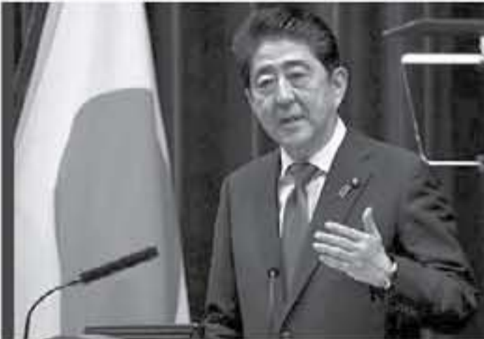
طوكيو - وكالات

أغسطس/ آب، وفي وقت سابق، تعهدت بوريكو كوكي حاكم طوكيو بتطبيق إجراءات وقائية فعالة للحد من انتشار فيروس كورونا خلال مسيرة الشعلة الأولمبية في بلاهان من المقرر أن تبدأ مسيرة الشعلة الأولمبية في اليابان في 26 مارس/أذار الجاري في مقاطعة فوكوشيما الشمالية. وكالات حكومة العاصمة البرانية، إنها قررت تأجيل حفل افتتاح مركز الرياضات الأولمبية الأوربي بسبب مخاوف من انتشار العدوى بفيروس كورونا، وأكدت حكومة طوكيو في بيان أن احتمالات افتتاح المركز كانت خطيرة في 22 مارس/أذار الجاري. وتؤكد طوكيو دوما أنها عاقدة العزم على إقامة أولمبياد 2020 الصيفي في موعده وحسب الخطط رغم مطالبات والقرارات بالتأجيل أو حتى الإلغاء.