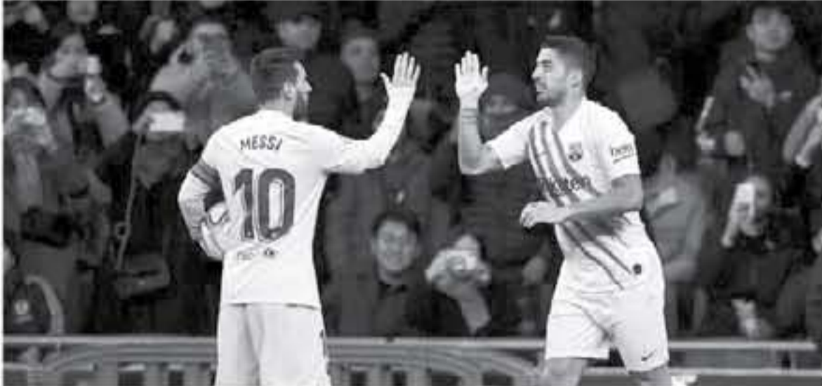
مديرد - وكالات

أكد تقرير صحفي إسباني، ضمن السيتي أن فيروس كورونا ربما يمنح برشلونة ملاحا موقيا، للمنافسة على البطولات خلال الموسم الحالي وكالات رابطة الدوري الإسباني قد أعلنت تأجيل كل مباريات المسابقة إلى أواخر يونيو على الأقل، بسبب مخاوف انتشار فيروس كورونا، كما تم تأجيل مباريات الأندلس الكري دوري أبطال أوروبا. وقالت صحيفة ماركا، إن فيروس كورونا خبر من الأندية الكري برشلونة خلال الموسم الحالي، وربما يجعل الفريق أكثر قوة للمنافسة على لقب الليجا دوري الأبطال وأشارت إلى أن المنافسات في الموسم الحالي قد تمتد لوقت أطول من المعتاد، بسبب فترات الإيقاف الجارية، وأوضحت أنه إذا تم تأجيل يورو 2020، فالتنافس قد تمتد حتى الصيف المقبل، وهنا سيحل الهامج لوس سواريز متحاً مع المدرب كيكي ستيغن خلال المباريات الحاسمة