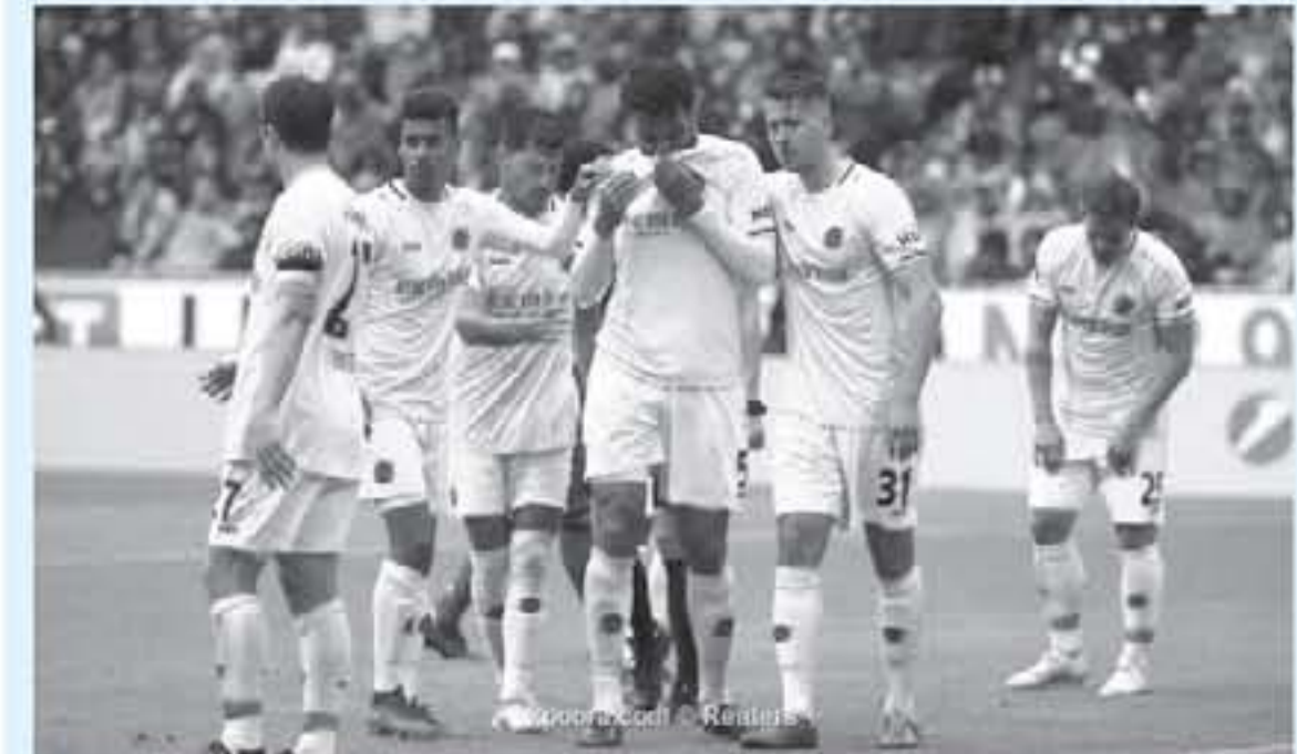
برلين - وكالات

فريق على لانس هانوفر الألماني الحجر الصحي في منازلهم، بعدما أصيب اثنان من لاعبي الفريق بفيروس كورونا، وألقى الاتحاد الألماني لكرة القدم مباريات الجولة 21 من الدوري الألماني (بوندسليجا) التي كان مقرا انطلاقها الجمعة، إلى 13 أبريل/نيسان المقبل، كما أقيمت أيضا مباريات دوري الدرجة الثانية، وقرر مكتب الصحة في مدينة هانوفر، أن يفرض لاجو الفريق جميعهم في منازلهم لمدة 14 يوما، كتوجع من الحجر الصحي، بحسب موقع «شمسبورت»، ويعمل قانون العدوى سلطات الصحة في الولايات الألمانية الحق في إجبار المسافرين على البقاء في الحجر الصحي، وبحسب معهد روبرت كوخ، فإن فترة حضانة الفيروس من 14 يوما، ومولاه اللاجون مجبرون الآن على البقاء في منازلهم وعدم الخروج منها وثلا ولو حتى أثناء حاجياتهم من الطعام والشراء، كما أن مكتب الصحة سيتابعهم يوميا، ومن يخالف هذا القرار يعاقب ويمكن أن تكون العقوبة مالية أو حتى عقوبة الحبس.