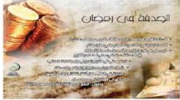
الصدقة من رمضان