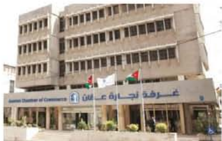
أظهرت إحصائيات إحصائية تراجع عدد شهادات المنشأ التي أصدرتها غرفة تجارة عمان خلال الثلث الأول من العام الماضي ٢٠١٩، ووفقاً للإحصائيات الخاصة

بالفترة، فقد راقى انخفاض عدد شهادات المنشأ خلال الثلث الأول من العام الحالي تراجع قيمة الصادرات إلى نحو ٢٢٥ مليون دينار مقابل ٣٤٢ مليون دينار للفترة نفسها من العام الماضي. وحسب الإحصائيات الإحصائية، ذهبت شهادات المنشأ التي أصدرتها الغرفة خلال الثلث الأول من العام الحالي إلى العديد من البلدان أبرزها دولة الإمارات العربية المتحدة بمقدار ١٣٦٦، والسعودية ١١١٦، ثم قطر بمقدار ٥١٨، والمغرب ٤٨٠، ولبنان بمقدار ٦٦ شهادة. وتوزعت غالبية صادرات الغرفة خلال الثلث الأول من العام الحالي على الإمارات بقيمة ٦٠ مليون دينار، ودولة الإمارات العربية بقيمة ٤٣ مليون دينار، ثم قطر بقيمة ٢٢ مليون دينار، والسعودية نحو ٢٠ مليون دينار ولبنان بقيمة ١٦ مليون دينار، ويبلغت صادرات المنتجات الأجنبية