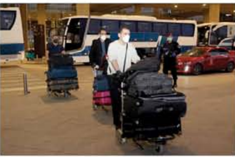
الاجراءات الوقائية التي تتخذها القوات المسلحة والأجهزة الأمنية والحكومية

مدير رئيس اتحاد رجال الأعمال العرب حمدي الطيحات ان تبلغ خسائر الاقتصاد العربي جراء جائحة كورونا ما يقارب 323 مليار دولار. واستند الطيحات بتقديره الى تقرير صدر اخيرا عن صندوق النقد الدولي الذي توقع انحسار الناتج المحلي الإجمالي في منطقة الشرق الأوسط وشمال أفريقيا بنسبة 3.3 بالمئة بفضل مكافحة فيروس كورونا وتراجع أسعار النفط. وأكد الطيحات أن الدول العربية سواء تلك المصدرة للنفط أو المستوردة تأثرت سلبا وبطأها اضطراب وخسائر تراوحت عن مليارات فيرويس كورونا المستجد، لعل نسبتها تنمو 12 بالمئة من حجم اقتصادها. وأوضح رئيس الاتحاد الذي يتخذ من عمان مقرا له، ان التوقعات تشير الى ان ديون الحكومات العربية سترتفع بمقدار 190 مليار دولار خلال العام الحالي 2020 تصل الى 1,496 تريليون دولار.