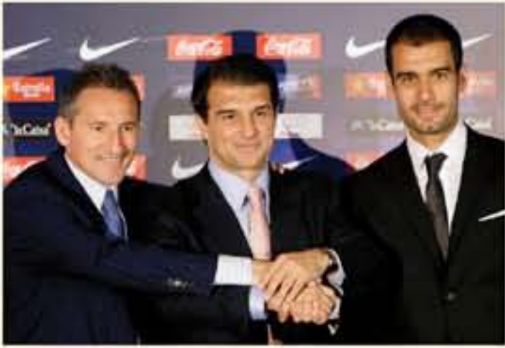
عواصم - وكالات

التي طعن ضدها الفريق الإنكليزي، ونقلت شبكة لبي في 3 الكتلونية عن لابورتا قوله "أعمل على ترشيح نفسي للرئاسة". كنت الرئيس من قبل ومتحمس للعودة، أود عودة غوارديولا لكنه الآن في سبيل وهذا قرار يجب على بيت ألكسندر، إنه التحيز لبرشلونة والعديد من أهل كتالونيا يريدون عودته لتدريب برشلونة مرة أخرى". وتابع "في الوقت المناسب سأحدث إلى الشخص الذي يؤمن أنه يجب أن يكون مدرباً لبرشلونة بدءاً من 2021". وقال برشلونة 14 لقباً تحت قيادة غوارديولا قبل رحيله في 2012 من بينها ثلاثة ألقاب في الدوري واثنان في دوري أبطال أوروبا.