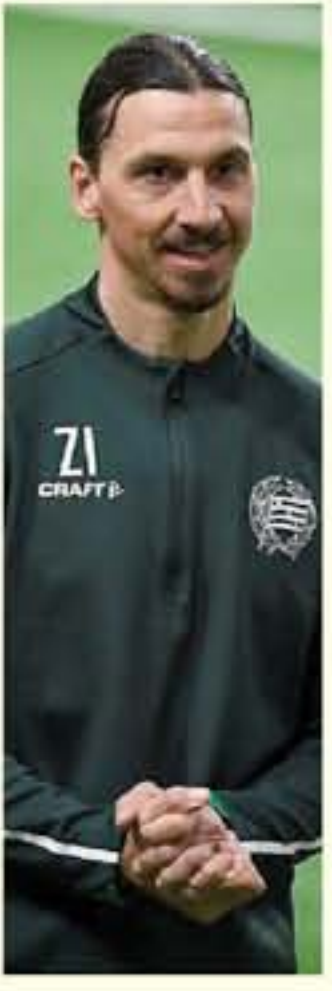
عواصم - وكالات

عاد النجم السويدي المخضرم زلاتان ابراهيموفيتش إلى إيطاليا للانضمام إلى صفوف نادي ميلان بعد أن أمضى شهرين في بلاده كما ذكرت عدة وسائل إعلام إيطالية. وبنت شبكة "سكاي سبورت" صوراً عدة للمهاجم لدى وصوله إلى ميلانو وهو يرتدي قميصاً وكشازات قبل أن يتوجه إلى ميلانيلو مقر تدريبات نادي الروسونيري ويحسب وسائل اعلام عدة، سيمنك ابراهيموفيتش في الحجر الصحي في مقر النادي لمدة 14 يوماً. ويترب زملاء ابراهيموفيتش بشكل فردي منذ اسبوع وقد يعاودون التدريبات الجماعية في 18 الحالي في حال سماح السلطات الصحية بذلك. وكان "أبيرا" غادر إيطاليا في 12 آذار/مارس لتستقر في ستوكهولم حيث تمكن من إجراء تدريبات في صفوف نادي هاماربي الذي يملك حصة فيه. ويعودة "أبيرا" يكون الدوري الإيطالي قد استعاد جميع نجومه الدوليين بعد عودة النجم البرنغالي كريستيانو رونالدو الاثنى الماضي إلى لوريو والفريسي فرانك ريبيري إلى فلورنسا يوم الجمعة الماضي.