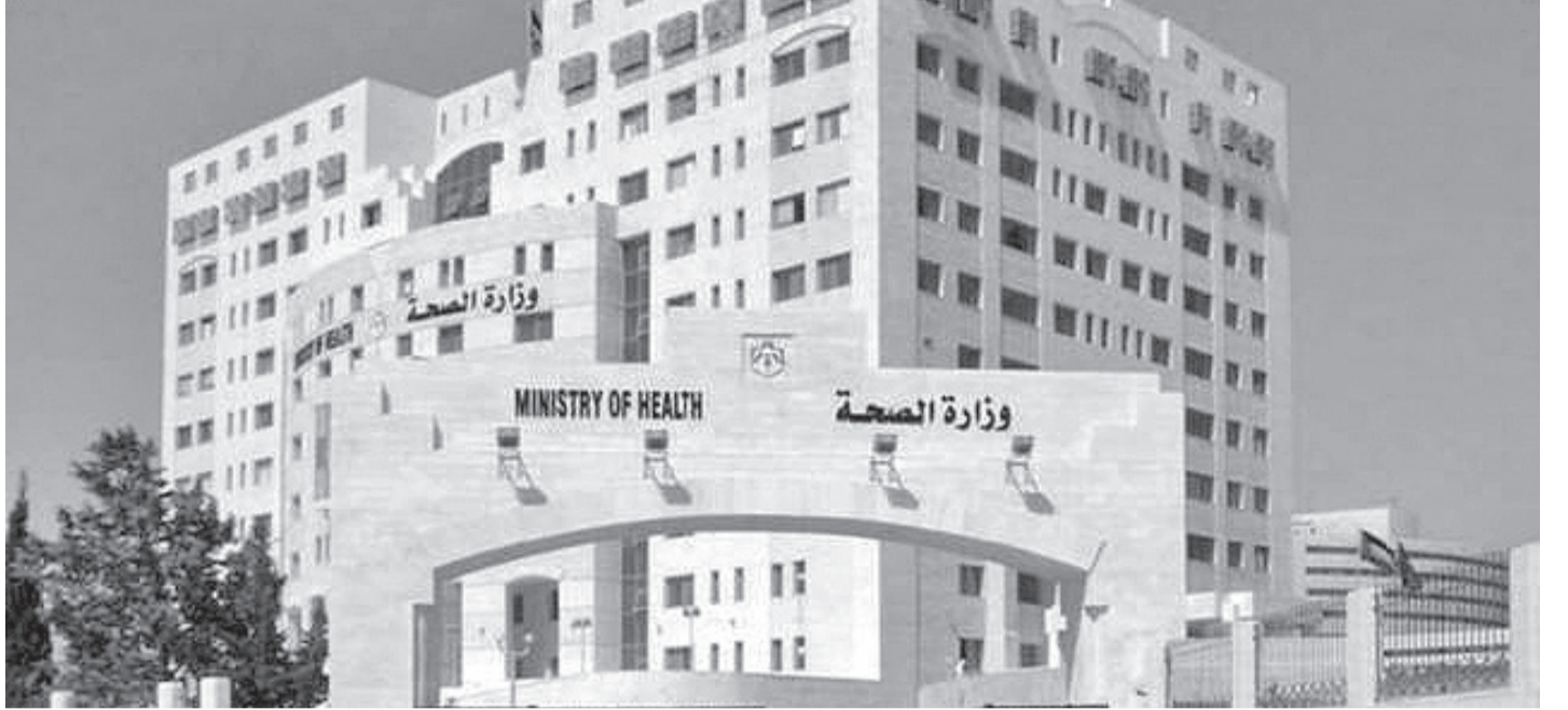
الانبات - عمان

حالتان مخالطتان لمصاب و أخرى لسبب إيجابية باريد و رابعة بالمفرق لمواطن يعمل بمرکز «جابر»