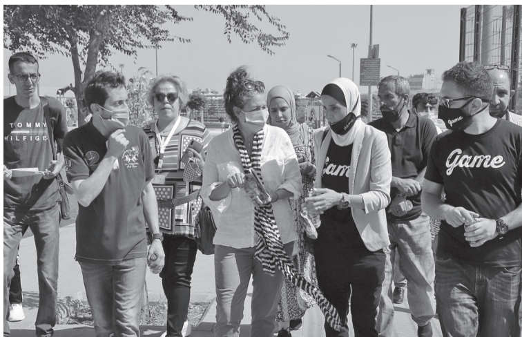
وزارة الصحة. وفي ختام الفعاليات، وزعت الميداليات الذهبية والشهادات التقديرية على الأطفال المشاركين.

أعلنت شركة مياه الأردن "مياها" عن تأجيل ضخ المياه لمناطق محددة جنوبي العاصمة عمان، حتى مساء اليوم السبت، بسبب أعمال صيانة تنفذها شركة الكهرباء الأردنية. ورجحت الشركة في بيان صحفي،