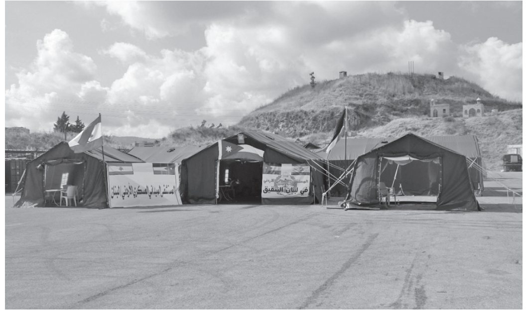
الانباط-عمان بدأ المستشفى الميداني الأردني في العاصمة

لهم، ضمن المساهمة في الجهود الإغاثية والطبية بعد الانفجار الذي وقع في مرفأ بيروت. وقال مدير المستشفى: إن الطواقم بدأت فور وصولها بتحضير وتهيئة المرافق والأجهزة والمعدات الطبية المعدة لاستقبال الجرحى وتقديم أفضل الخدمات الطبية والعلاجية لهم. والمستشفى الذي جُهز بالطواقم الطبية اللازمة كافة لإجراء العمليات الصغرى والكبرى، يشمل على 48 سريراً، و10 أسرة (ICU)، وغرفتي عمليات يشرف عليها طواقم طبية وتمريضية وصيدلانية وفنية وإدارية متخصصة. من جهتهم، عبّر الأشقاء اللبنانيون عن شكرهم وتقديرهم للأردن؛ قيادةً وحكومةً وشعباً على هذه اللفتة الإنسانية النبيلة والمساهمة في تقديم الخدمات الطبية والعلاجية لهم. وكان جلالة الملك عبدالله الثاني، القائد الأعلى للقوات المسلحة، وجه رئيس هيئة الأركان المشتركة، إلى تجهيز مستشفى عسكري ميداني لإرساله إلى جمهورية لبنان، من منطلق الرسالة الإنسانية التي يحملها الجيش العربي.