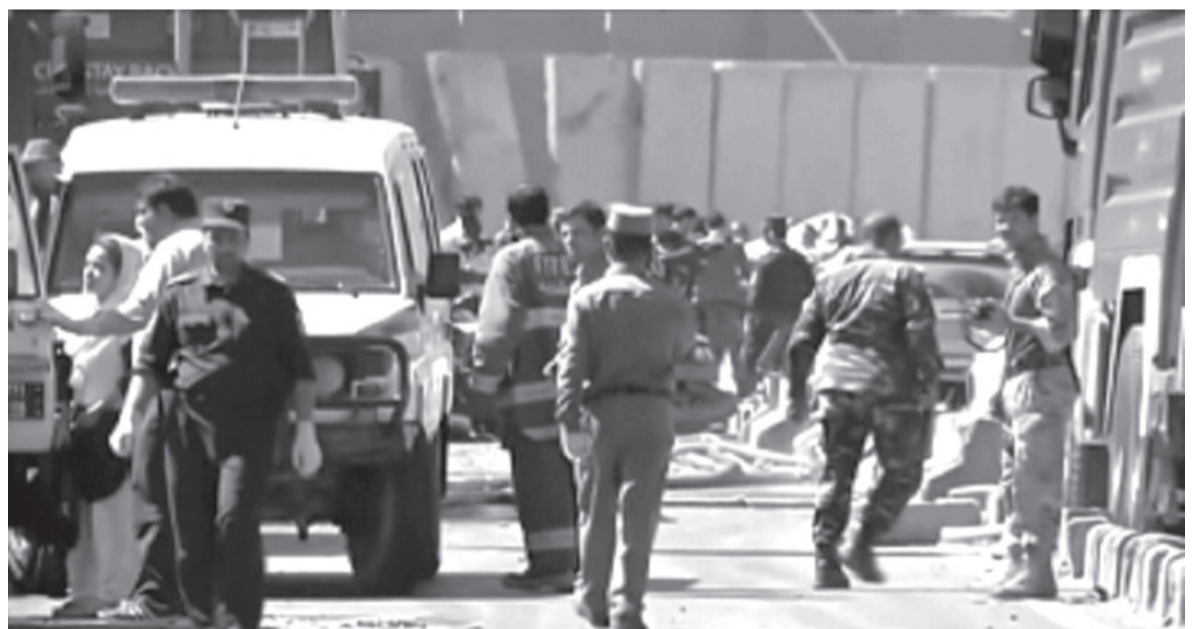
الانباط - وكالات

دفعت لطالبان في أعقاب الجدل حول المكافآت الروسية للهجمات على القوات الأمريكية، وهي القضية التي قللت إدارة ترامب من شأنها باستمرار في الأسابيع الأخيرة، وفتتها روسيا جملة وتفصيلاً. كما أن عدم الإفادة العينية لإيران أو طالبان وقرار عدم متابعة رد دبلوماسي أو عسكري، يسلط الضوء أيضاً على رغبة إدارة ترامب في حماية محادثات السلام مع طالبان، والتي بلغت ذروتها في اتفاق تم توقيعه في فبراير الماضي، بهدف مساعدة ترامب على الوفاء بوعد حملته المعلن منذ فترة طويلة بسحب القوات الأمريكية من أفغانستان.