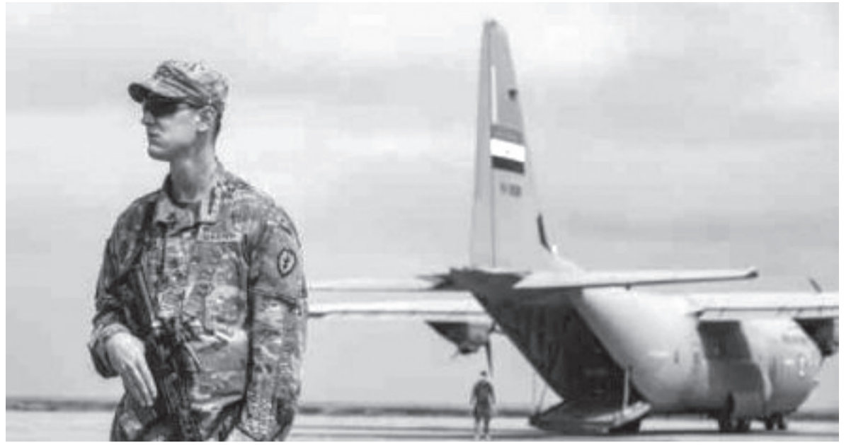
الانباط - وكالات

وقامت مجموعات عدة مجهولة الانتماء، بهجوم قواع أميركية بصواريخ «كاثيوشا» وقذائف هاون من دون أن تتعمد الايقاع بإصابات قاتلة. وأوقفت قوافل عراقية تنقل معدات ووسائل نقل تابعة للقوات الأميركية لتضرم فيها النيران ويوجه إنداز لسائفتين بالامتناع عن تقديم أي خدمة للقوات الأميركية خشية أن يتعرضوا هم أيضاً للقتل. وشكلت هذه المجموعات هدفاً مشتركاً لها، ألا وهو توجيه رسالة تحذيرية لأميركا بأنها لن تكون مرتاحة إذا لم تنسحب كما طلب منها البرلمان. وتالياً فإنه من المنتظر أن تكثف هذه المجموعات هجماتها لتضغط أكثر على حكومة الكاظمي وعلى واشنطن، لتتجهما إلى التصادم الفعلي والأعنف ليس بعيد.