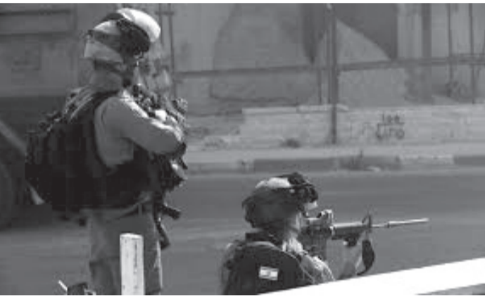
الانباط - وكالات

برصاص جنود الاحتلال في قدمه بعد إطلاق النار عليه بحجة حيازته سكيناً، لكن تبين أنه أعزل ولم يكن يحمل شيئاً. ونشرت إحدى صفحات موقع «تويتير»، فيديو يوثق الحادثة على حاجز قلنديا شمالي القدس، وأغلق جيش الاحتلال الحاجز أمام المركبات الفلسطينية في الاتجاهين.