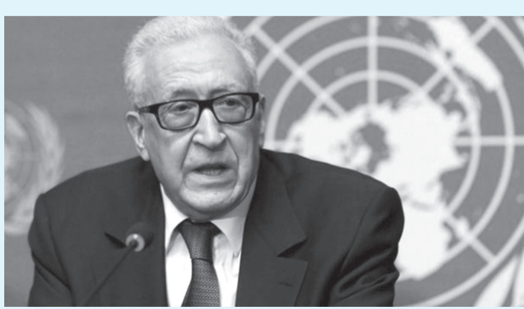
الانباط - وكالات

الاحتلال، وفي مجابهة الخطر العالمي للسلام والأمن، والمتأتي من خطة ترامب - ننتياهو، وأعلن الموقعون التزامهم بالعمل على المساهمة في تعزيز الخطوات اللازمة لتأمين حل عادل لهذا الصراع يؤدي إلى الاعتراف بالحقوق القومية والجماعية والفردية للشعب الفلسطيني.